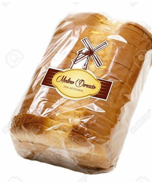
Imagen 1. Este empaque será realizado para las ferias a las cuales asiste el emprendedor.

El diseño del empaque fue hecho debido a las grandes fallas que encontramos en el anterior empaque, lo que se hizo fue mejorar la conservación del producto y así mismo mejorarla visualmente para los clientes, esta bolsa de acetato o polipropileno no deja que el producto sude y lo que hace es que los clientes puedan observarlo completamente.