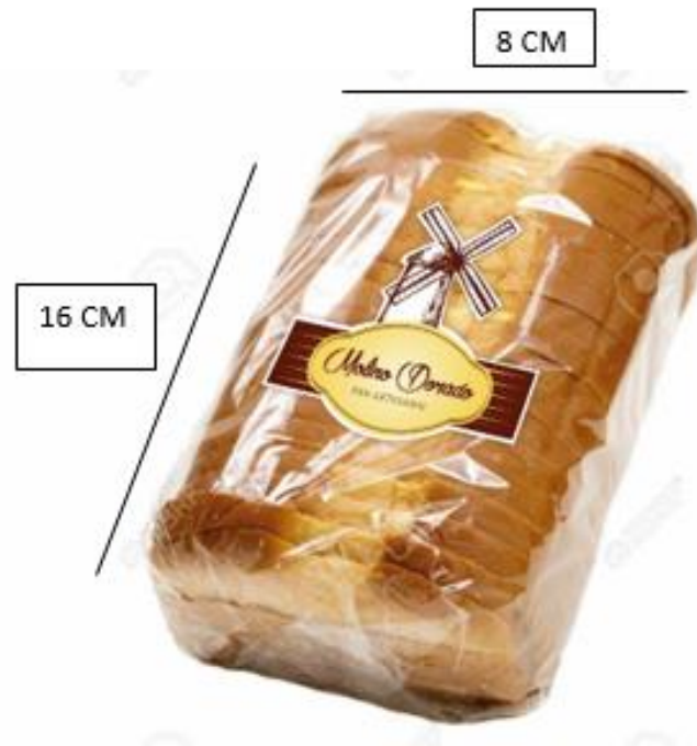
Imagen 2. Empaque primario para pan de Semillas

Esta medida es la adecuada ya que por sus dimensiones no permite que el producto se vea estrecho y que sude dentro de su empaque; además que el material del empaque también ayuda a su conservación.