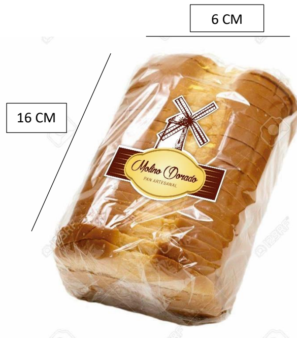
Imagen 3. Empaque para mogollas

Este empaque nos ayuda a conservarlas y a brindarle a nuestro producto una mejor presentación.