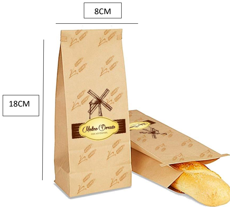
Imagen 4. Empaque secundario