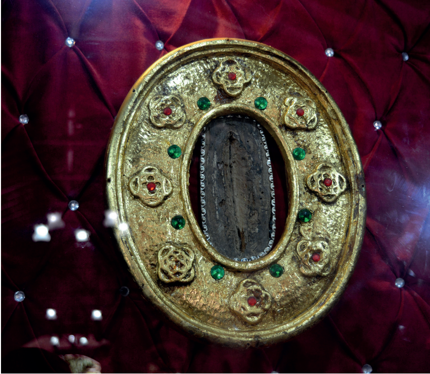
Figura 88. La Virgen de las Gracias de Torcoroma, capilla del Santuario, Ocaña, Norte de Santander, Colombia