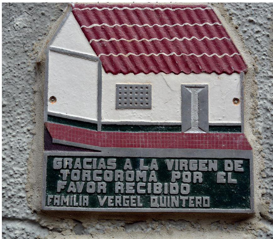
Figura 91. Exvoto contemporáneo: capilla del Santuario,

Fuente: Luis Evert Mendoza Salazar, O. P.