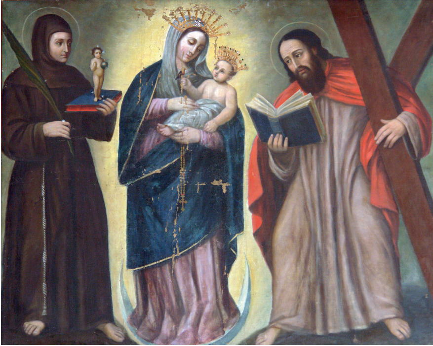
Figura 86. Nuestra Señora del Rosario de Chiquinquirá . Anónimo, siglo XVII, convento de Santo Domingo, Bogotá, Colombia