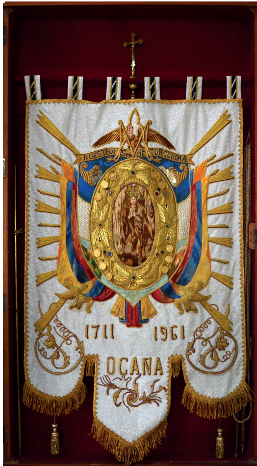
Figura 90. Estandarte conmemorativo por los 250 años de la aparición, bordado con hilos de seda y oro, capilla de Nuestra Señora de las Gracias de Torcoroma, Ocaña, Norte de Santander, Colombia