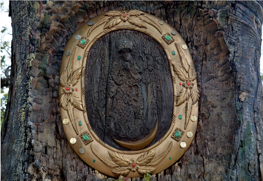
Figura 89. La Virgen de las Gracias de Torcoroma, parque de la plaza principal de Ocaña, Norte de Santander, Colombia