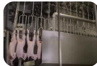
Planta de beneficio