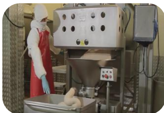
Planta de carnes frías