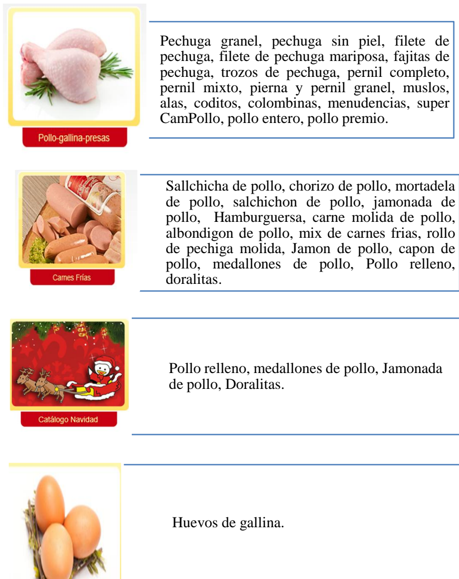
Figura 2: Portafolio de productos CAMPOLLO S.A.