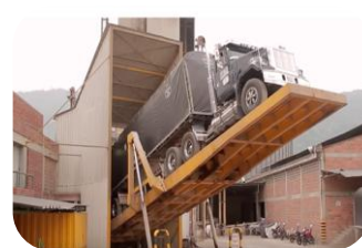
Planta de concentrados