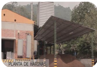
Planta de harinas