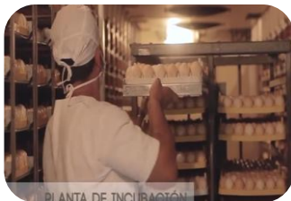
Planta de incubacion