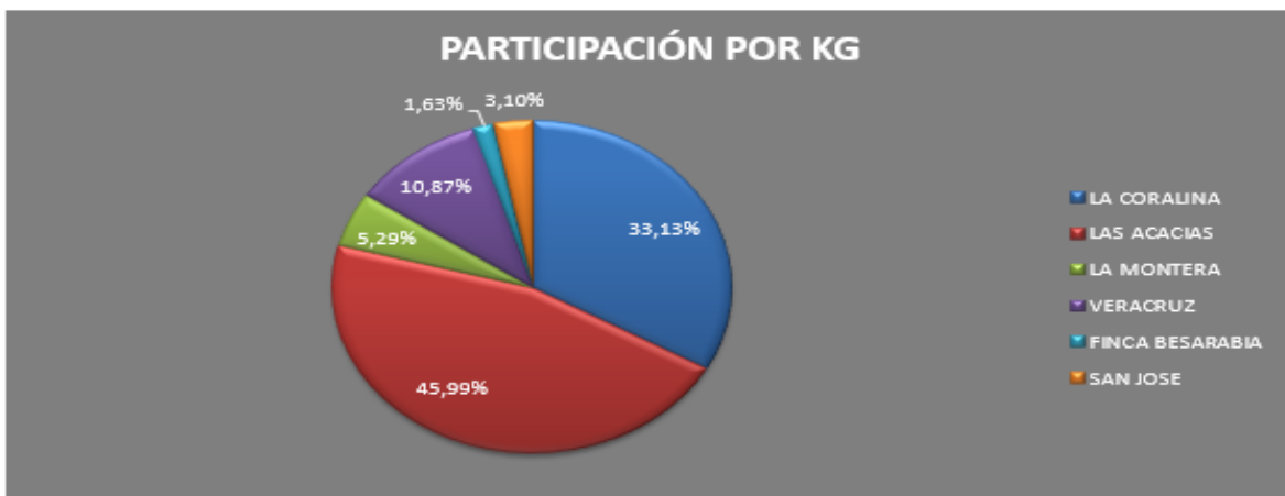
Ilustración 12 Basados en el costo por packing se muestra la participación por predio en kg