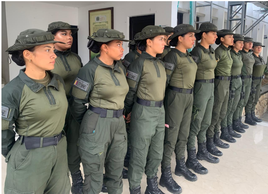
Figura 12 Grupo de Prevención Femenino de Operaciones Rurales EFEOR

Nota. Llega a Sucre escuadrón femenino de operaciones rurales EFEOR. Adaptado de (CV Noticias, 2023).