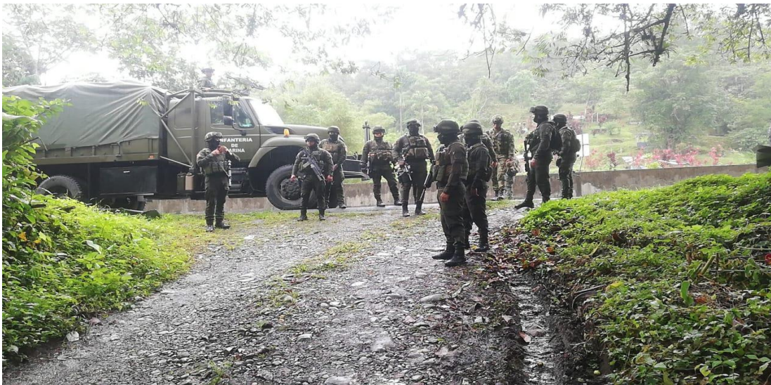
Figura 10 UNIMIL

Nota. Fuerza Pública propina contundente golpe contra minería ilegal en zona rural de Buenaventura. Adaptado de (Armada de Colombia, 2022). Armada de Colombia.