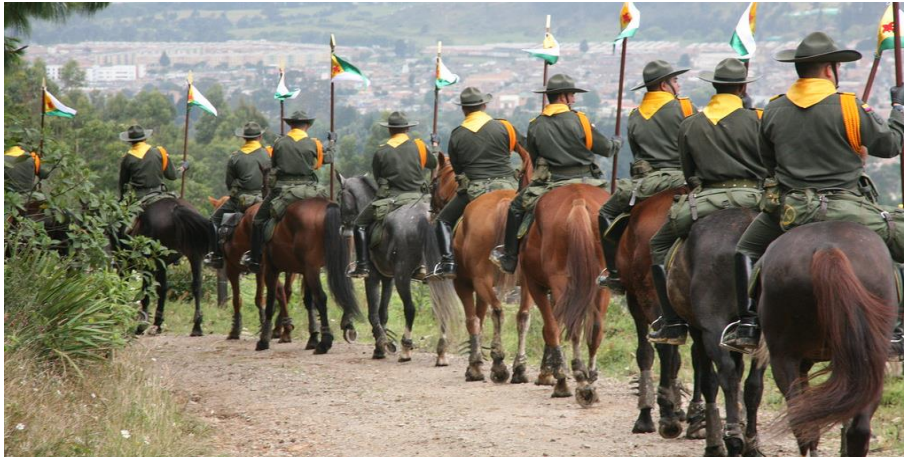
Figura 8 Los Escuadrones Móviles de Carabineros EMCAR

Nota. Fuerte de carabineros reforzará seguridad entre Soacha y Ciudad Bolívar.