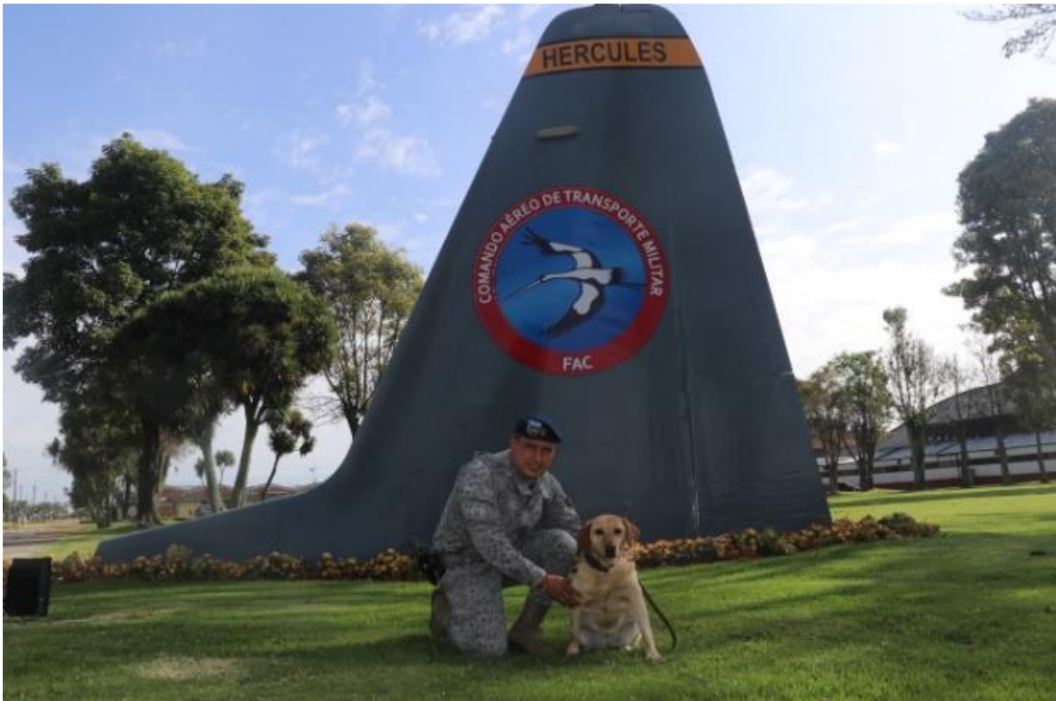
Figura 3 Equipos Caninos Fuerza Aérea Colombiana

Nota. Caninos militares al servicio de Colombia. Adaptado de (Fuerza Aerea Colombiana (FAC), 2021)