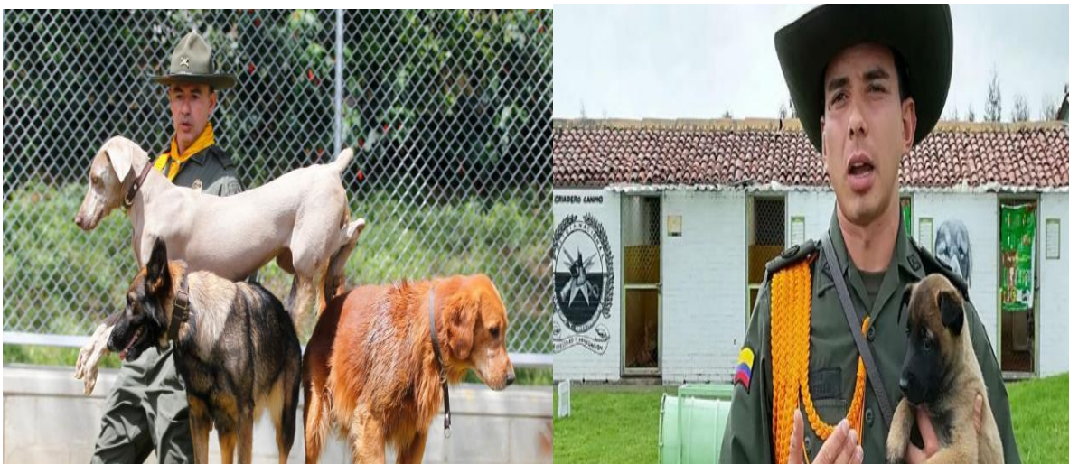
Figura 6 Escuela de Guías y Adiestramiento Canino

La Policía también cuenta con el grupo Remonta y Veterinaria (GREVE), encargado de mantener la salud de la población animal y de hacer seguimiento a la operatividad de los binomios.