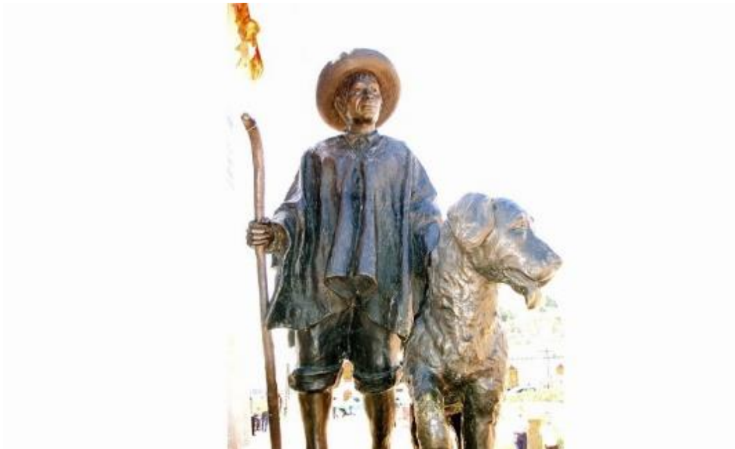
Figura 2 Nevado & Tinjaca

Nota. Nevado & Tinjaca: Simón Bolívar's companions. Adaptado de (Adri021, 2009)