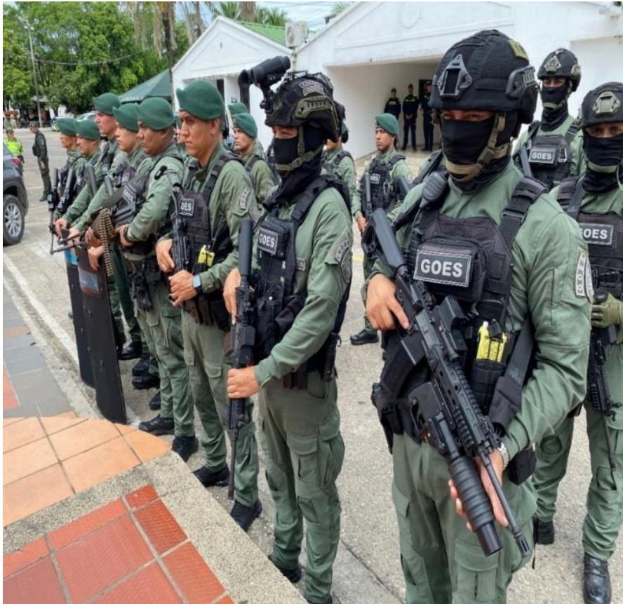
Figura 11 Grupo de Operaciones Especiales de Hidrocarburos GOES

Nota Seguridad de Neiva se refuerza con la llegada del Grupo de Operaciones Especiales (GOES). Adaptado de (Alcaldía Municipal de Neiva, Huila, 2024).