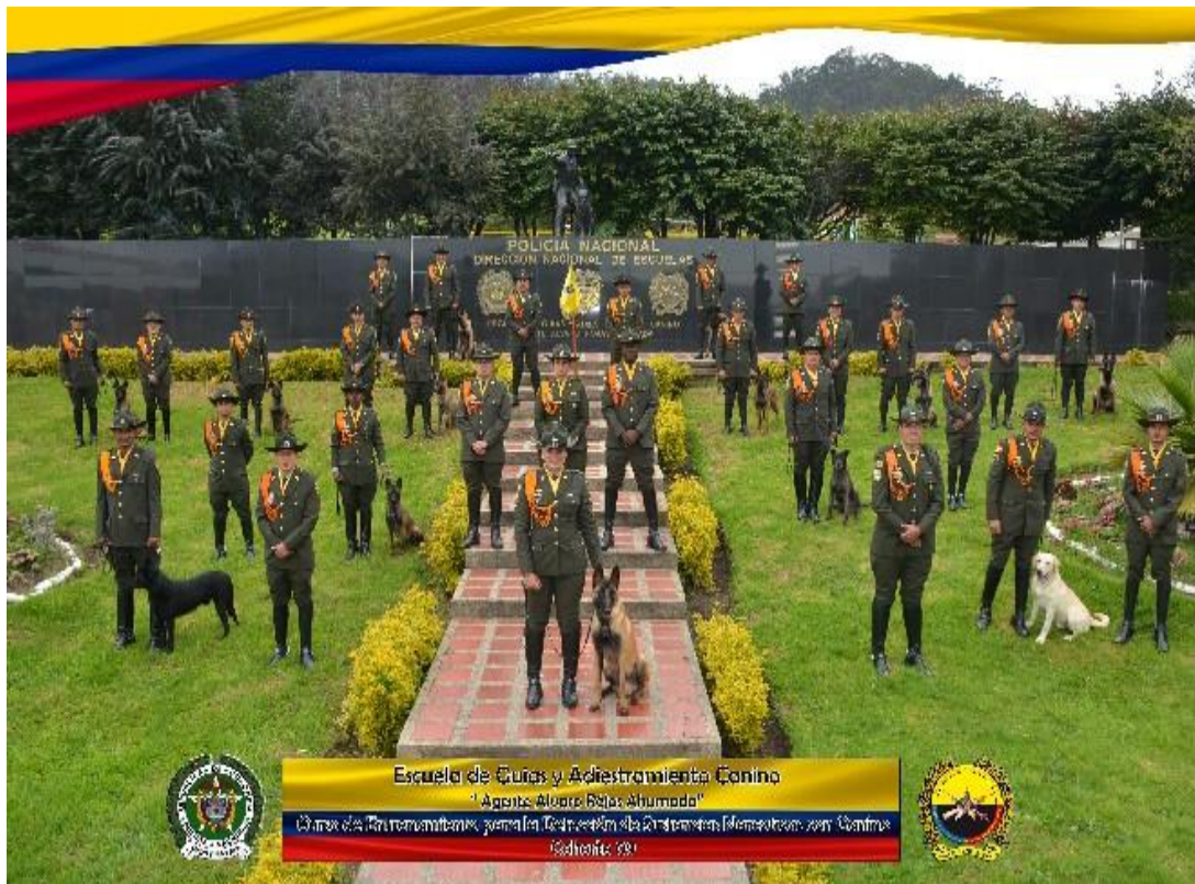
Figura 5 Equipos Caninos de la Policía Nacional de Colombia

Nota. Ceremonia de graduación de los programas académicos Técnico Laboral en Guía Canino para Detección de Sustancias Explosivas y Estupefacentes. Adaptado de (Policía Nacional de Colombia, 2024).