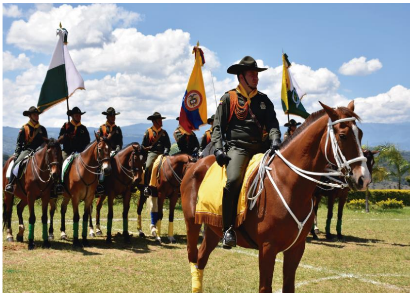
Figura 7 Dirección De Carabineros Y Protección Animal

Nota. Una Policía que se transforma: Nuevo rumbo área rural. Adaptado de (Colegio de Coroneles, 2020)