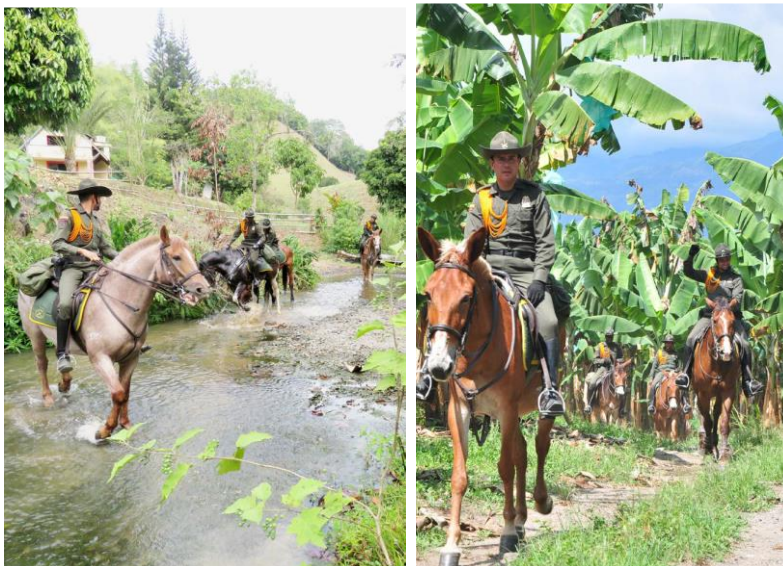
Figura 9 UNIRET

Nota. La Policía al servicio del campesino Adaptado de (Policía Nacional de Colombia, 2023).