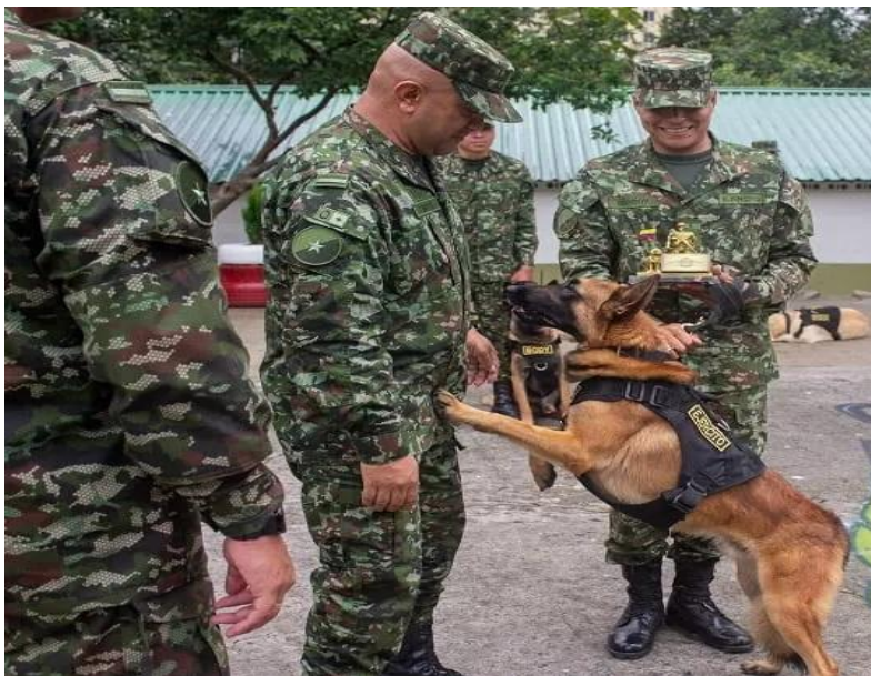
Figura 4 Equipos Caninos Del Ejército Nacional Colombiana – Binomio Canino

Nota. Adaptado de (Comando General de las Fuerzas Militares de Colombia., 2024).