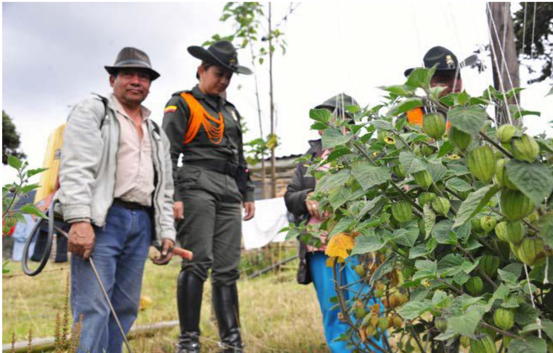
Figura 14 Unidades Básicas de Carabineros UBICAR

Nota. La Policía al servicio del campesino Adaptado de (Policía Nacional de Colombia, 2023).