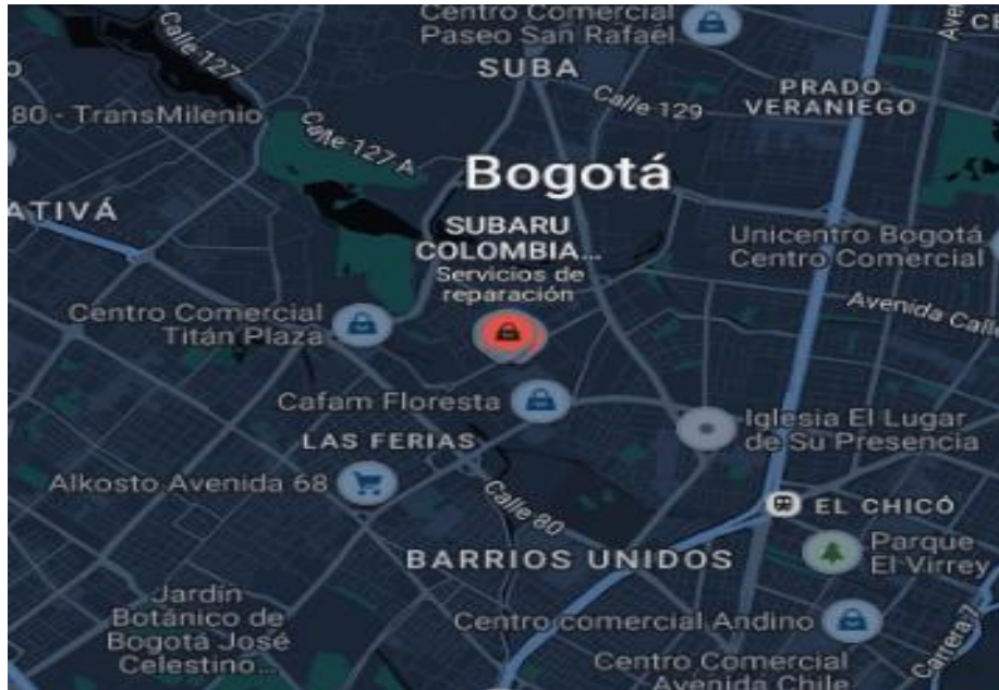
Figura 1. Ubicación sede Morato en la ciudad de Bogotá de Inchcape Colombia

Inchcape opera con más de 100 puntos de servicio y concesionarios distribuidos estratégicamente en las principales ciudades del país, incluyendo Bogotá, Medellín, Cali, Barranquilla y Bucaramanga. Estos puntos están capacitados para ofrecer tanto ventas de vehículos como servicios posventa de alta calidad.