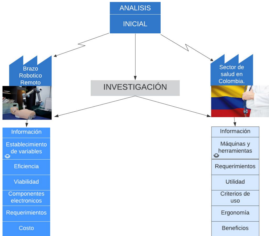
Ilustración 1. Etapa 1 - Análisis inicial.

fundamental como entregable deberá ser capaz de consolidar diseños existentes para analizar la viabilidad del proyecto.