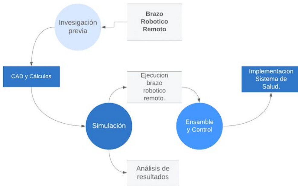
Ilustración 3. Etapa 3 - Compilación de las estrategias de intervención