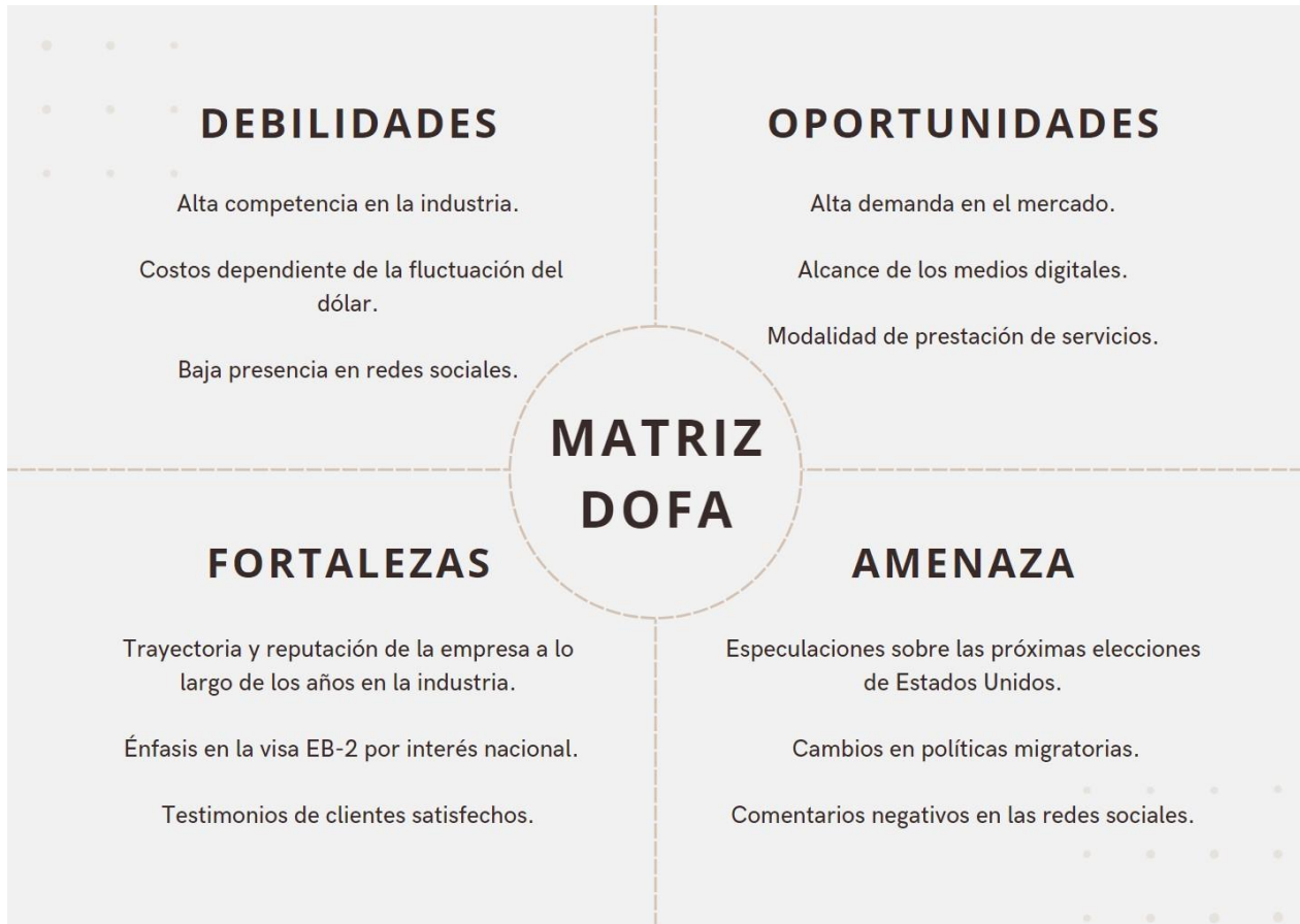
Nota. Matriz DOFA de la empresa Colombo and Hurd.