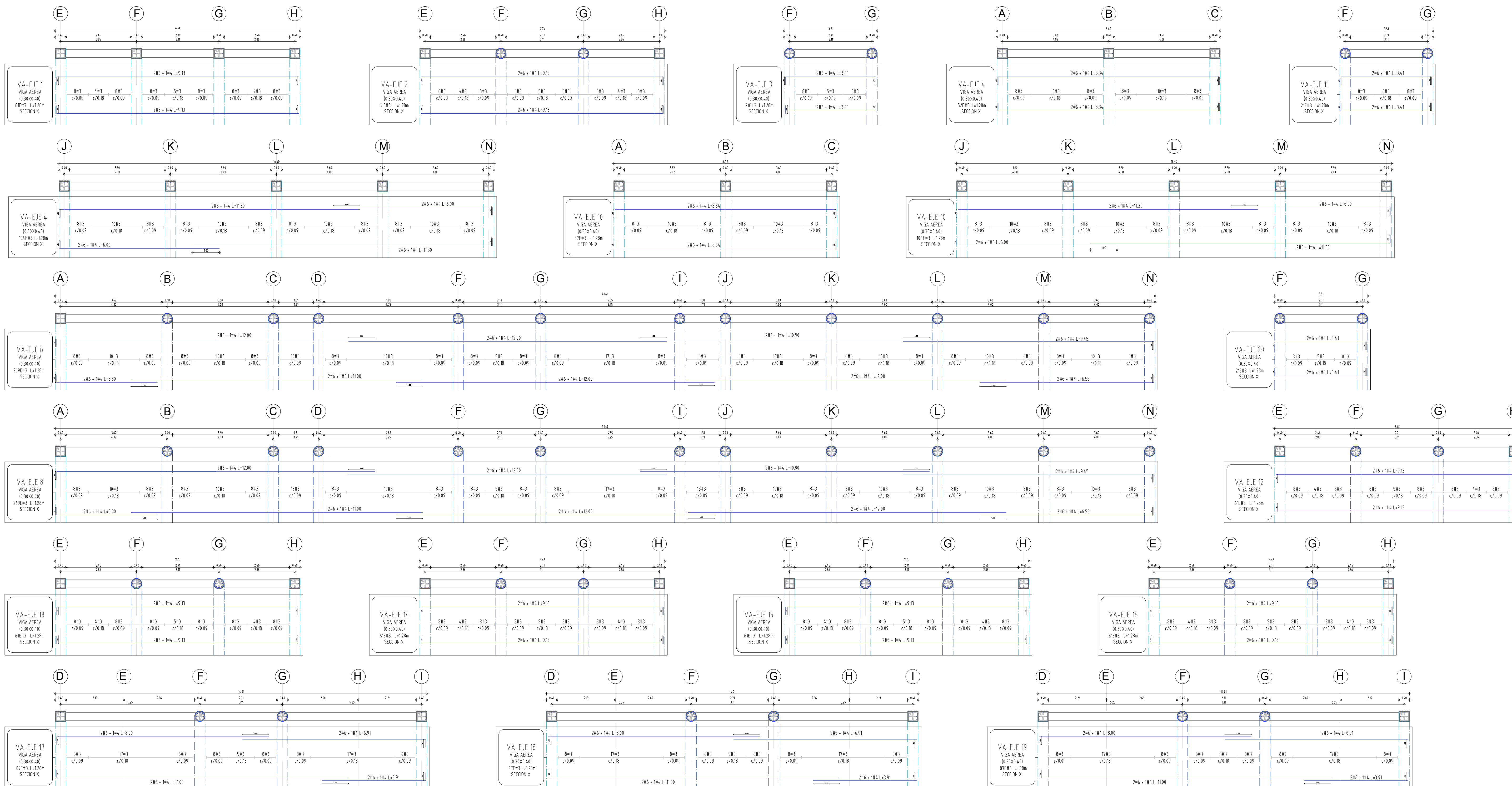
DETALLES VIGAS SENTIDO X ESCALA 1:75