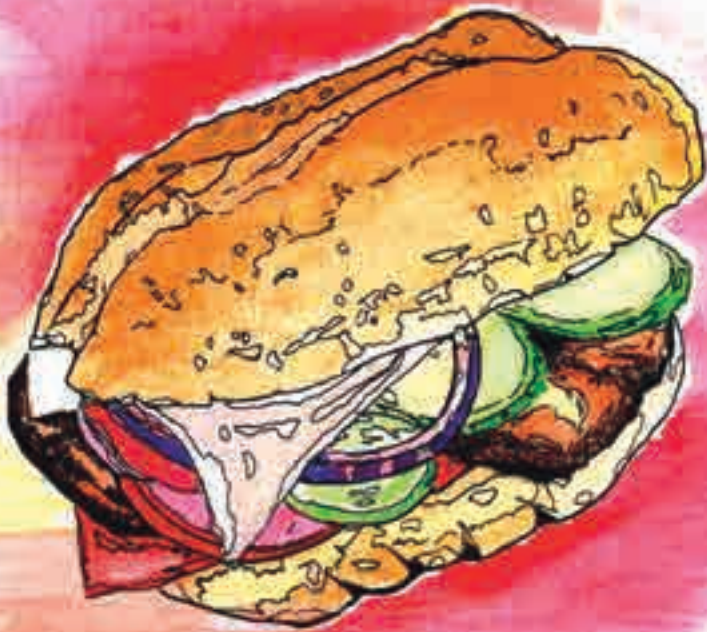
Ilustración 5. Los frailes dominicos se sintieron complacidos, una extraña sensación de tranquilidad se apoderó de ellos mientras miraban detenidamente a los maestros coinvestigadores, quienes degustaban con mucho agrado un sándwich cubano y una buena taza de café.