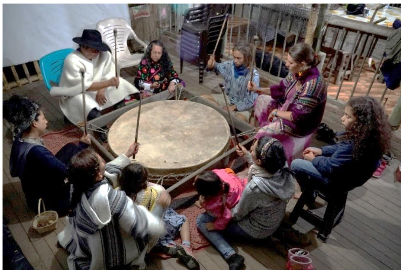
Toque de Tambor. Ecoaldea Anthakarana. Abril 2020