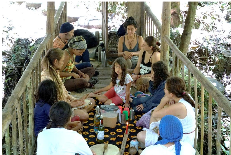
Canto al agua. Ecoaldeia Anthakarana. Marzo 2020.

El canto al agua afirma una ontología relacional, primero por la ruptura entre el mundo biofísico y humano/ el mundo sobrenatural o espiritual. Al poder estos rezos coadyuvar a la purificación de las aguas y transformar alguna situación del plano físico a través de la proyección mental, entiende que existe un vínculo de continuidad entre ambos mundos. 25 Segundo, reconoce al agua como un ser vivo, sintiente y sujeto de derechos del cual todos los seres vivos dependemos y con el cual se puede entablar una relación dialógica, rompiendo el dualismo humano/naturaleza.