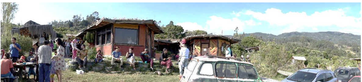
Espacios de convivencia durante el Llamado de la Montaña. Proyecto Gaia. Enero 2020.

El Llamado de la Montaña afirma una ontología relacional mediante discursos y prácticas formales en sus foros, talleres y actividades programadas. Entre los más relevantes estarían los foros sobre los paradigmas del Buen Vivir y la Ley de Origen que manifiestan la interrelacionalidad, interdependencia y complementariedad de todos los seres y la Madre Tierra. También con las iniciativas en pro de los Derechos de la Madre Tierra, reconocen a esta