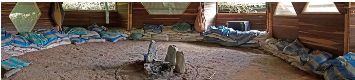
Buenoka. Ecoaldea Anthakarana. Abril 2020

Es una práctica que se la realiza en la Buenoka 21 o Casa de Pensamiento, donde participan los miembros de la ecoaldea sentados alrededor de un pequeño altar de piedras que tienen instalado al centro de la estructura.