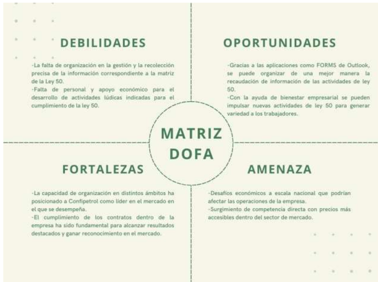
Figura 3 Matriz DOFA.

El análisis DOFA que desarrollado se basa en las actividades realizadas dentro del período de prácticas. Este análisis fue la base para elaborar un plan de mejora que permita potenciar las fortalezas y aprovechar las oportunidades, mientras se abordan, así como mitigar las debilidades y amenazas identificadas.