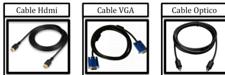
Figura 2. Cables