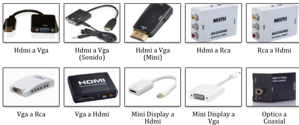
Figura 4. Convertidores-Adaptadores