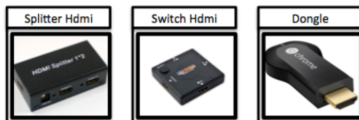
Figura 3. Accesorios Tecnologicos