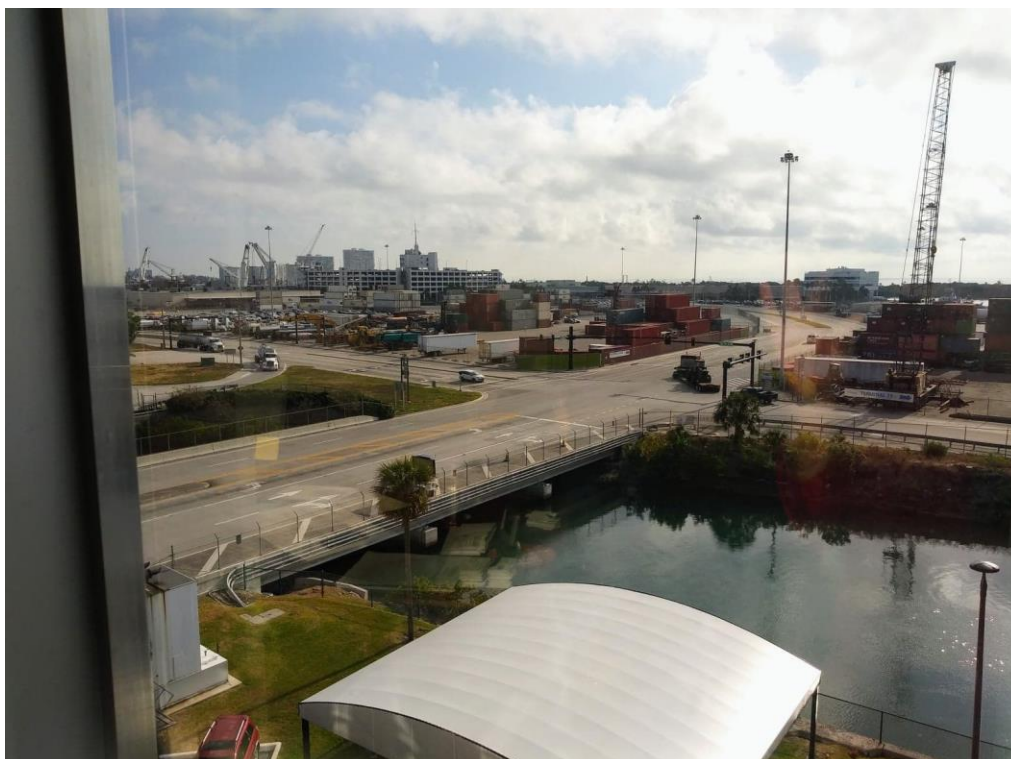
Anexo D. Visita Port Everglades. Elaboración propia.