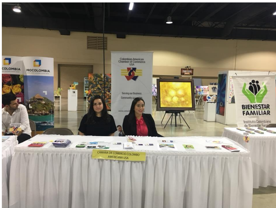
Anexo B. Evento Feria de Servicios para Colombianos en el Exterior. Elaboración propia.