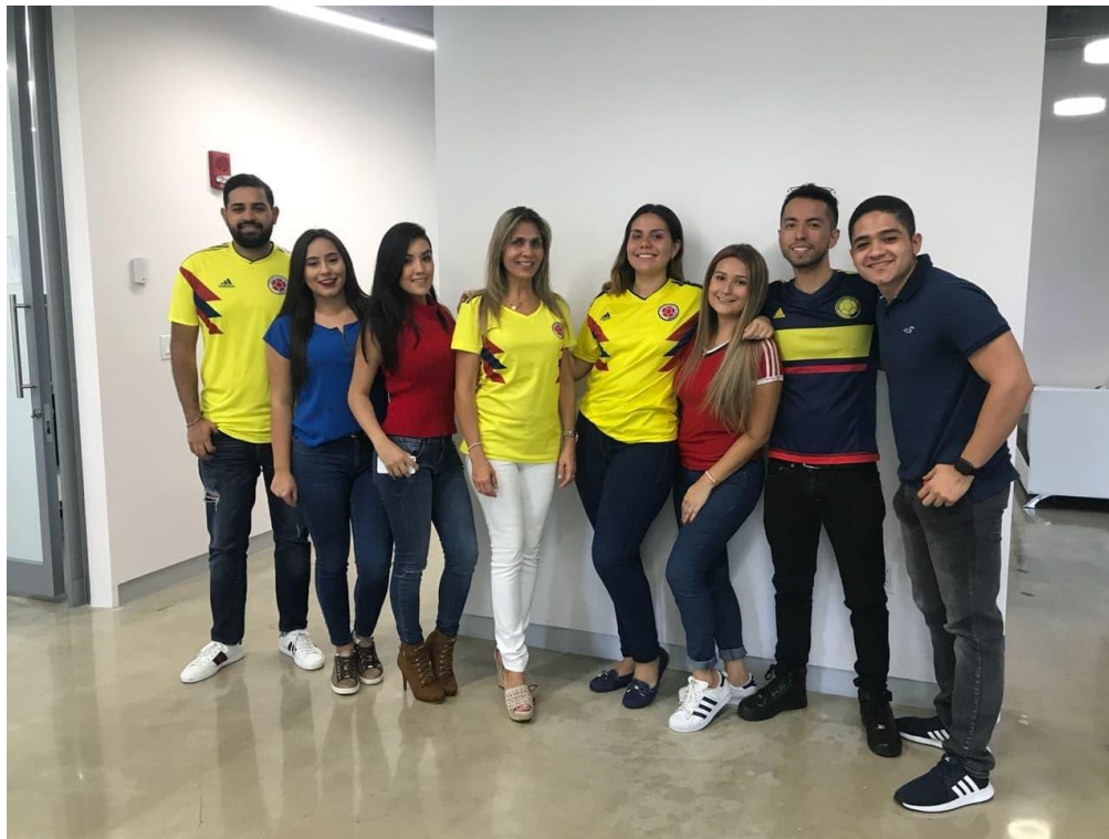
Anexo C. Evento Trustees. Elaboración propia.