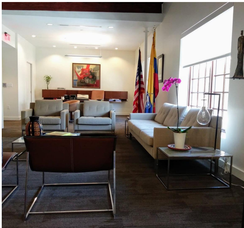
Anexo E. Visita Consulado de Colombia en Miami. Elaboración propia.