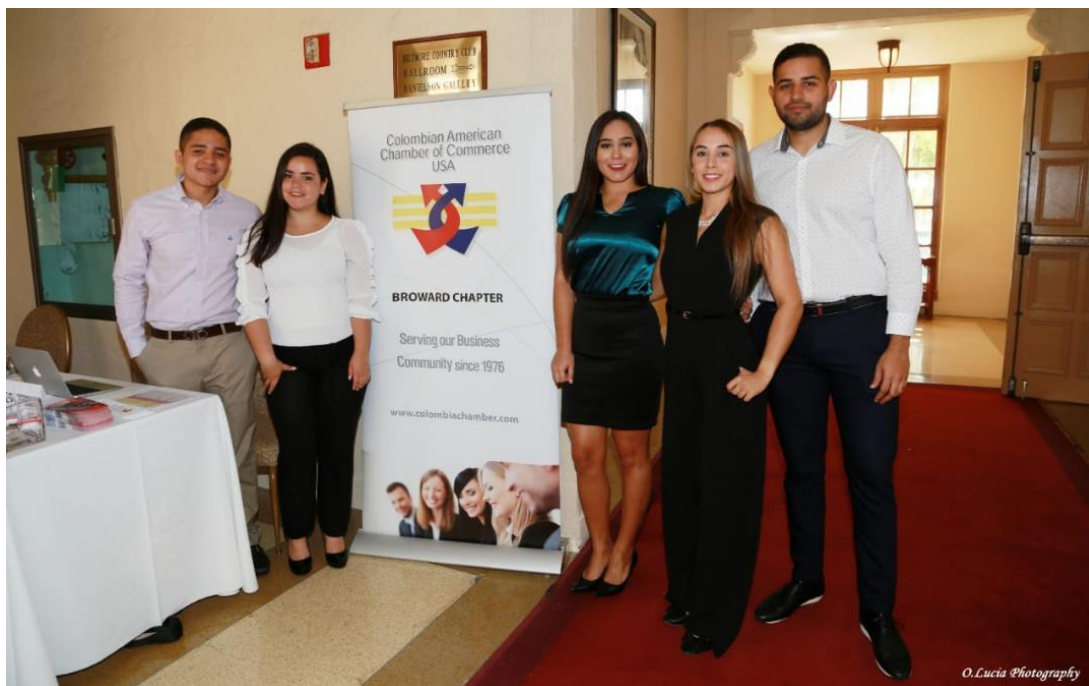
Anexo A: Staff de la Cámara de Comercio Colombo Americana.