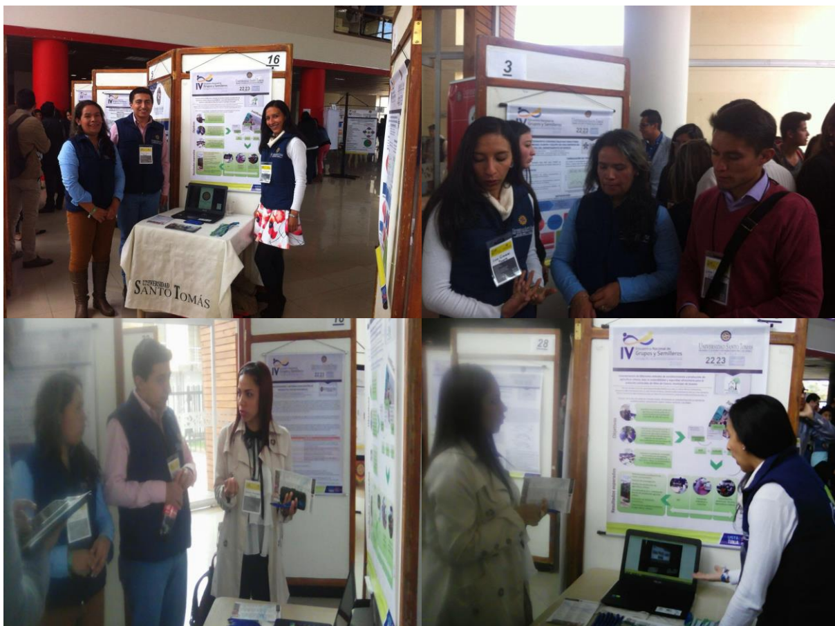
Ponencia en la modalidad de poster en “IV ENCUENTRO NACIONAL DE GRUPOS Y SEMILLEROS” Investigación con pertinencia e impacto social, celebrado los días 22 y 23 de septiembre de 2016 en la ciudad de Tunja.