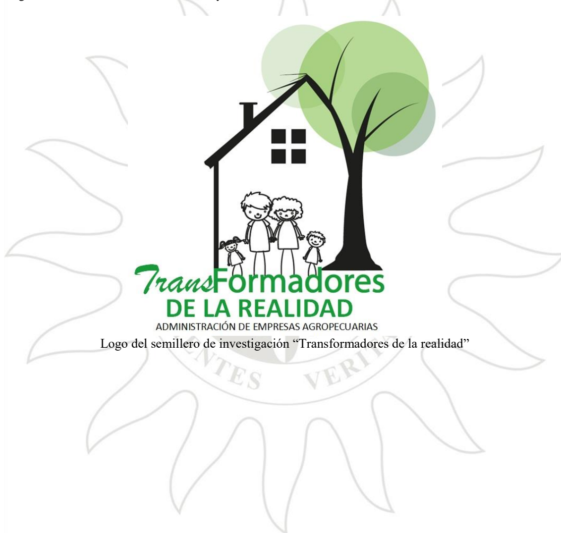
Logo del semillero de investigación "Transformadores de la realidad"

Se creó el logo, el cual es un símbolo formado por imágenes y letras que sirve para identificar al semillero de investigación ante la comunidad académica y la comunidad donde se realizan las acciones del semillero.