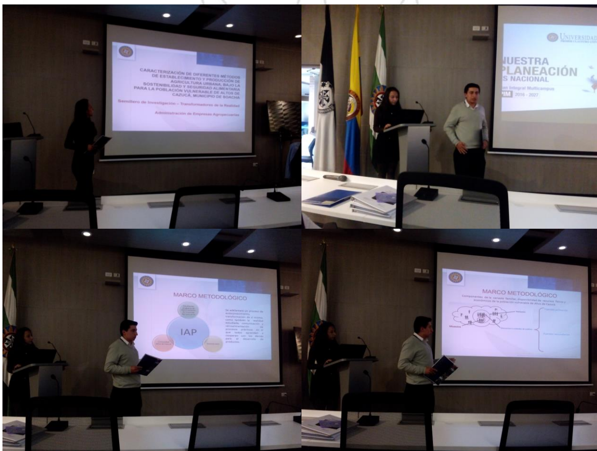
El semillero de investigación, Transformadores de la Realidad, representó a la Facultad de Ciencia y Tecnología de la VUAD en el IX Encuentro de Experiencias Significativas en los Centros de Proyección Social, en la ciudad de Bogotá

El encuentro también fue una oportunidad para que las facultades evaluaran el desempeño de sus docentes y estudiantes en los Centros de Proyección Social.