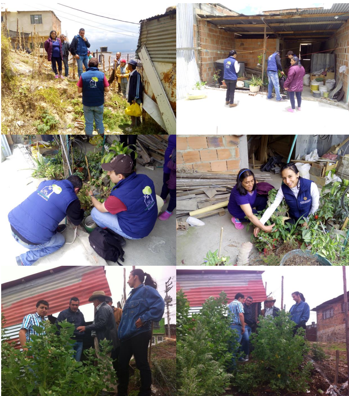
Capacitaciones en campo a los integrantes de la Fundación Siglo XXI

En la comunidad intervenida se realizan construcciones simples con el objetivo de realizar prácticas con los integrantes de la Fundación, para lograr sensibilizar en los procesos de agricultura urbana.