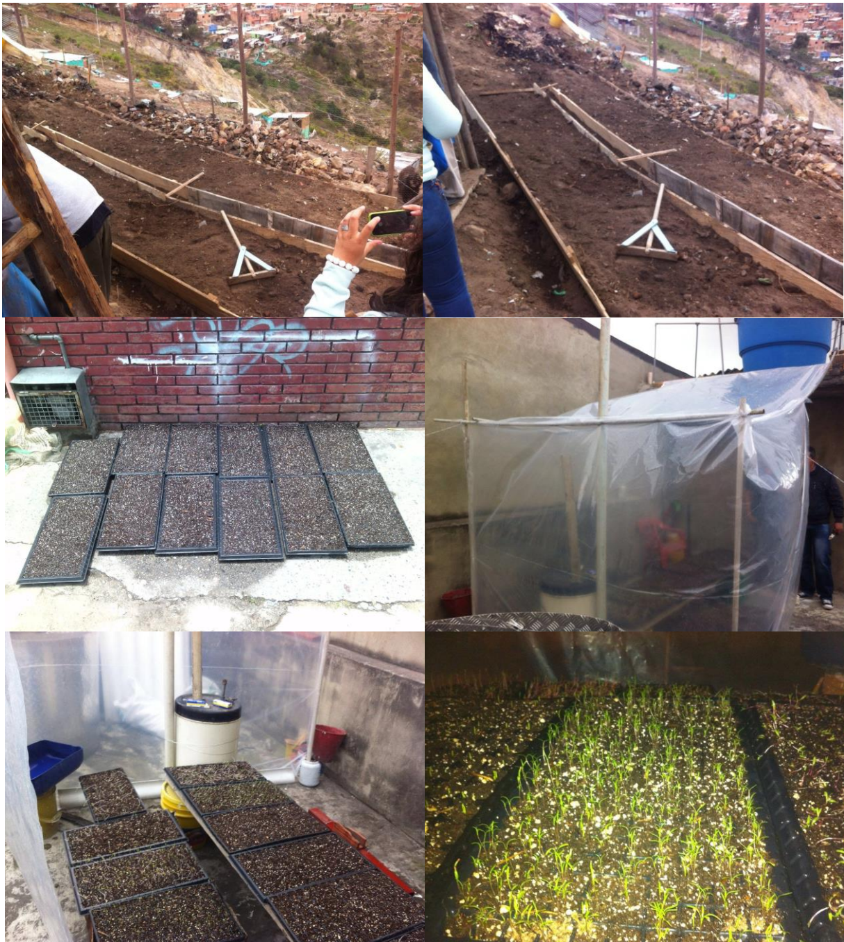
Preparación de terreno y construcción de semillero bajo cubierta plástica, para obtener material vegetal para la siembra