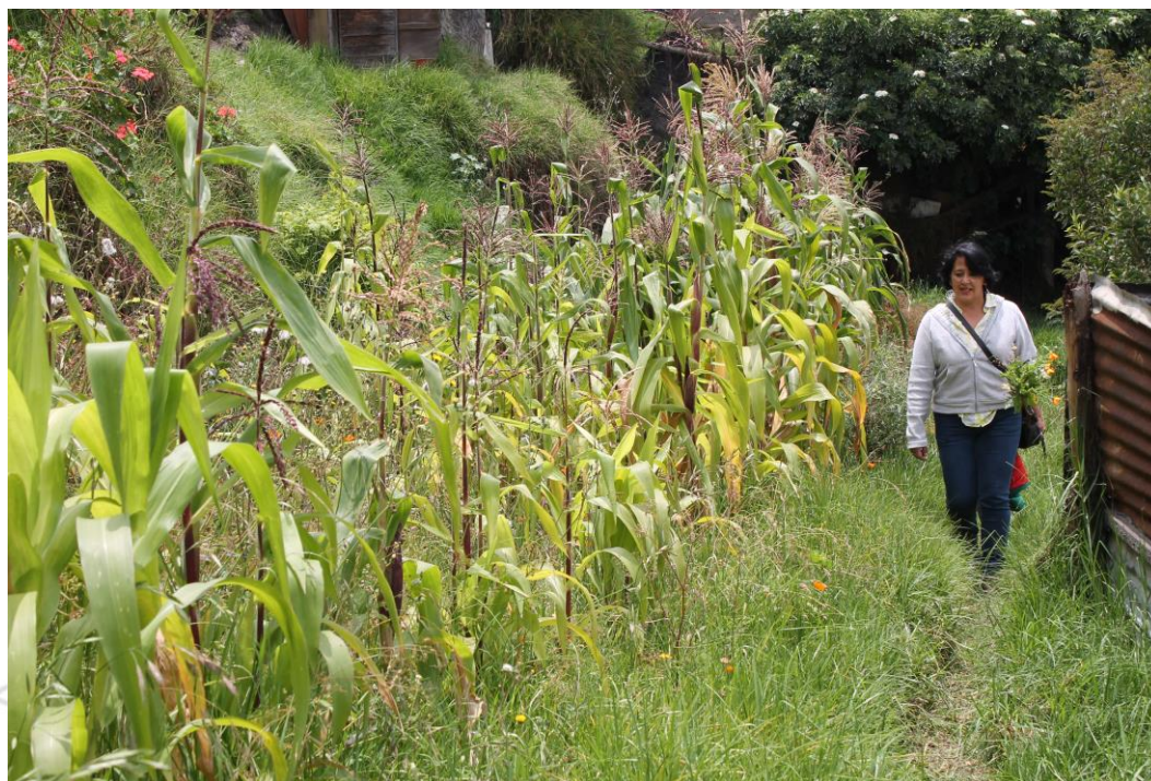
Huertas caceras urbanas