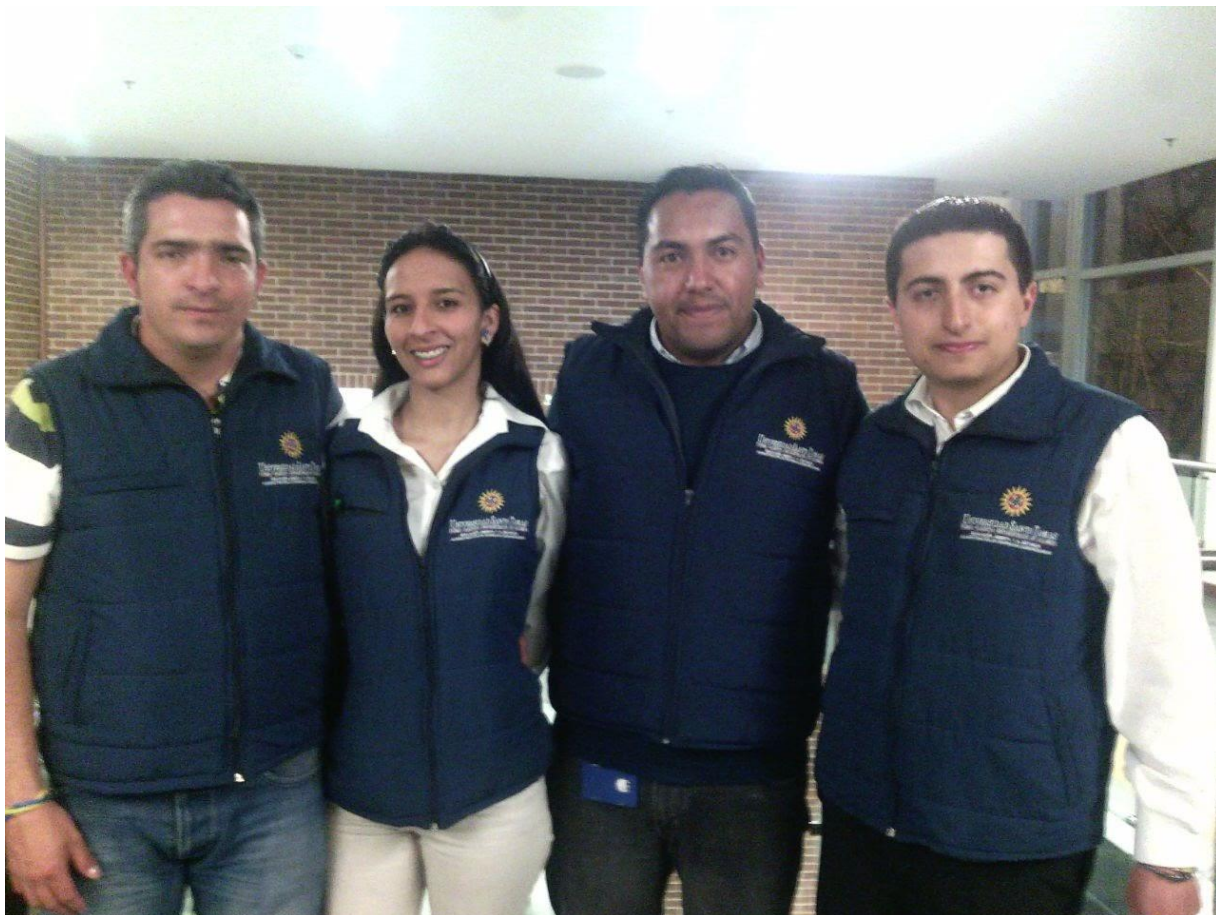
Integrantes del semillero de investigación “Transformadores de la realidad” con chalecos que identifican a la Universidad Santo Tomás y al semillero con el logo en la espalda.