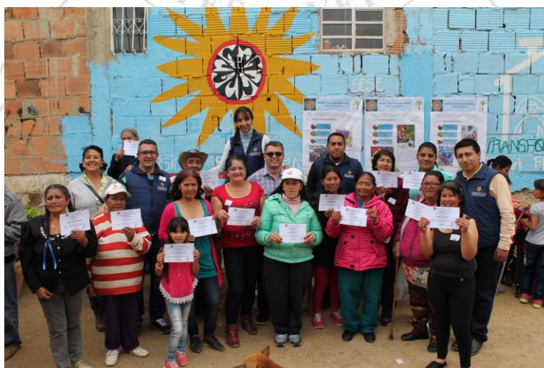
Entrega de certificados de participación

Culminación de trabajo de campo del proyecto de investigación con una muestra de productos obtenidos y entrega de certificados de participación a la comunidad beneficiaria