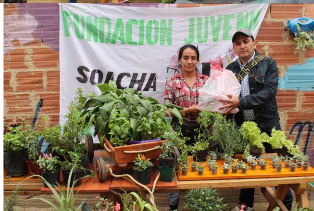
Muestra de productos obtenidos