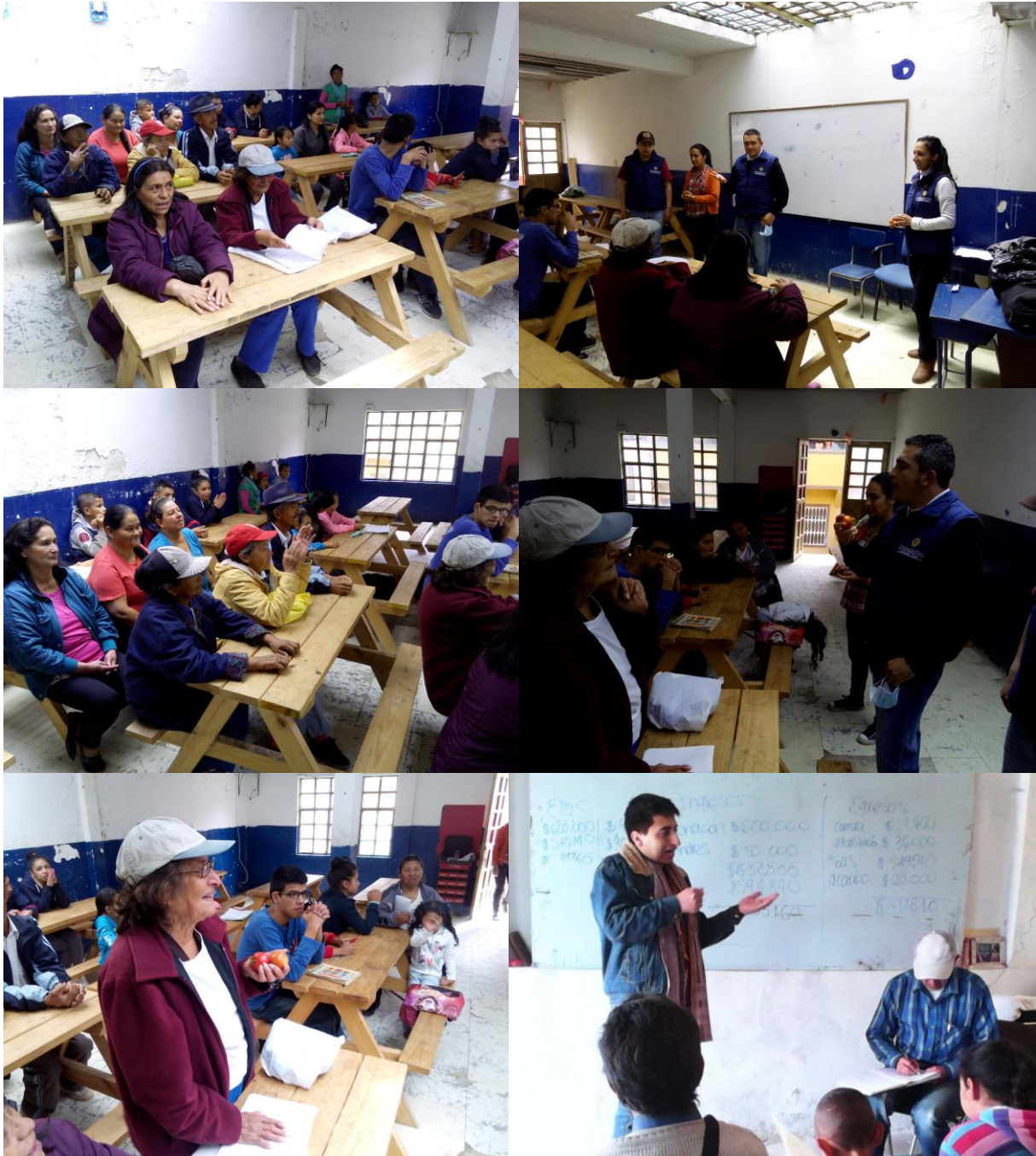
Capacitaciones a los integrantes de la Fundación Renacer Siglo XXI

Capacitación teórica con la participación de la comunidad, en diferentes métodos y técnicas de agricultura urbana en cuanto a la producción de especies vegetales de acuerdo a la disponibilidad de recursos físicos de la población vulnerable, bajo los parámetros de la sostenibilidad y la seguridad alimentaria.