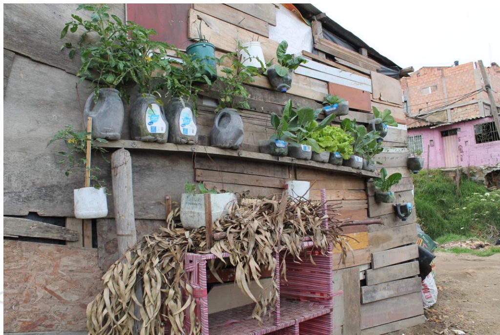
Obtención de productos en materas