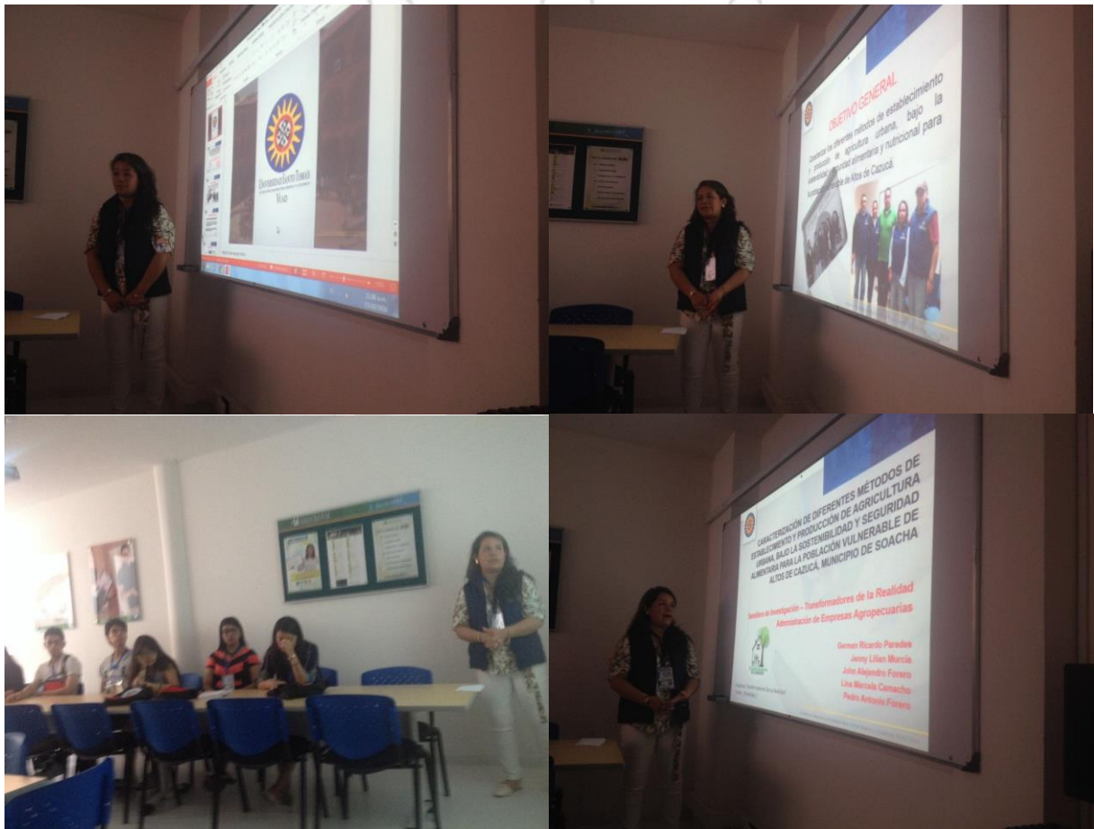
Ponencia de resultados parciales en el XIX encuentro nacional y XIII internacional de semilleros de investigación (ENISI 2016), universidad Simón Bolívar, Cúcuta, Norte Santander

El encuentro tuvo la finalidad de socializar los avances en investigación, innovación y/o desarrollo tecnológico y emprendimiento desde las diferentes áreas temáticas de la RedCOLSI, así como propiciar espacios participativos para el encuentro de estudiantes y docentes investigadores, quienes por líneas (áreas) temáticas tengan la posibilidad de articulación, retroalimentación, cualificación y trabajo en Red: promover la creación, fortalecimiento y articulación de redes, comunidades académicas, científicas y organizaciones afines a los objetivos e intereses de la RedCOLSI tanto a nivel nacional como internacional y ofrecer una retroalimentación formativa a los ponentes por parte de evaluadores especializados por áreas.