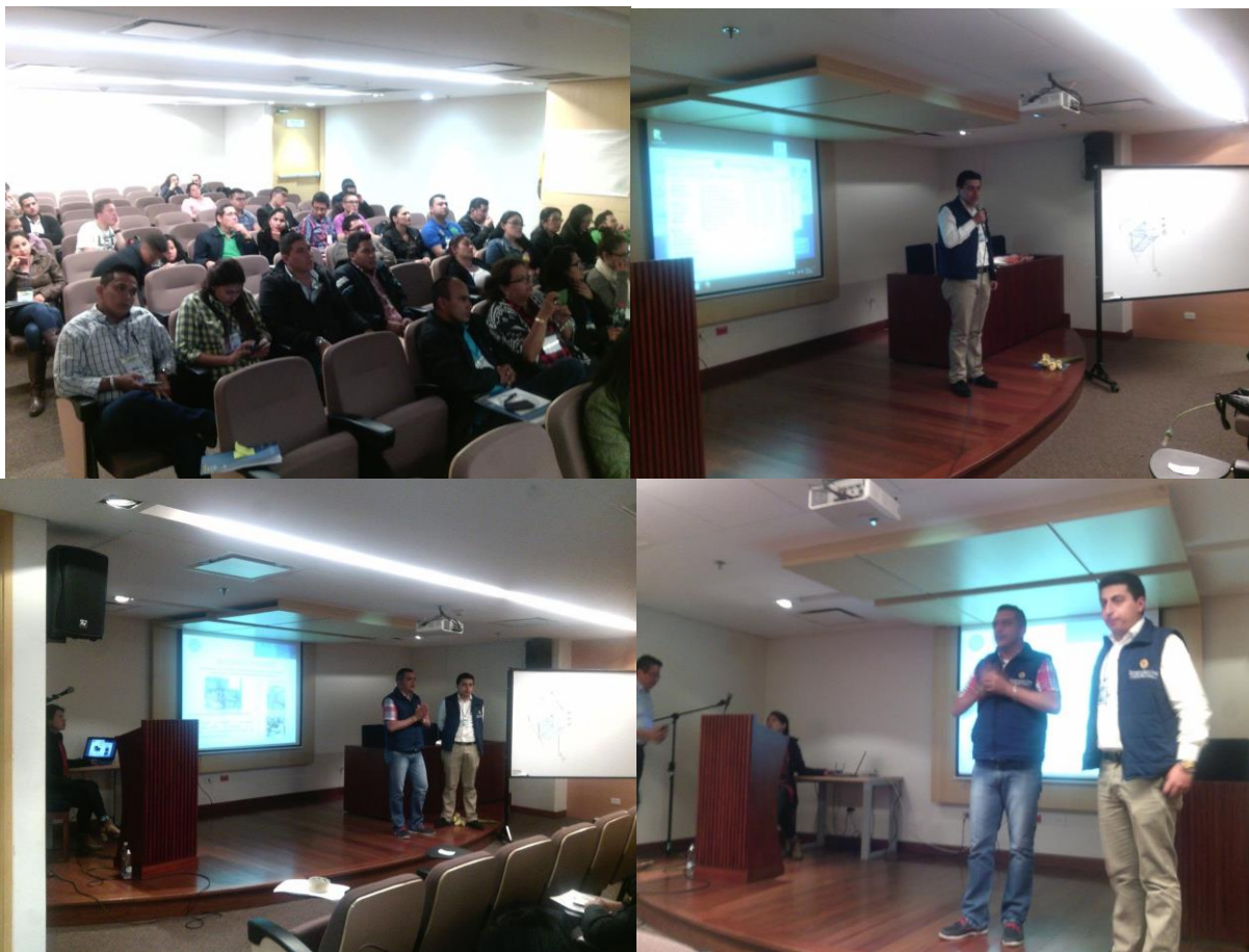
Ponencia del proyecto a cargo del semillero de investigación Transformadores de la Realidad, en el X Congreso Virtual en Ciencias y Tecnologías

Culminación de trabajo de campo del proyecto de investigación con una muestra de productos obtenidos y entrega de certificados de participación a la comunidad beneficiaria