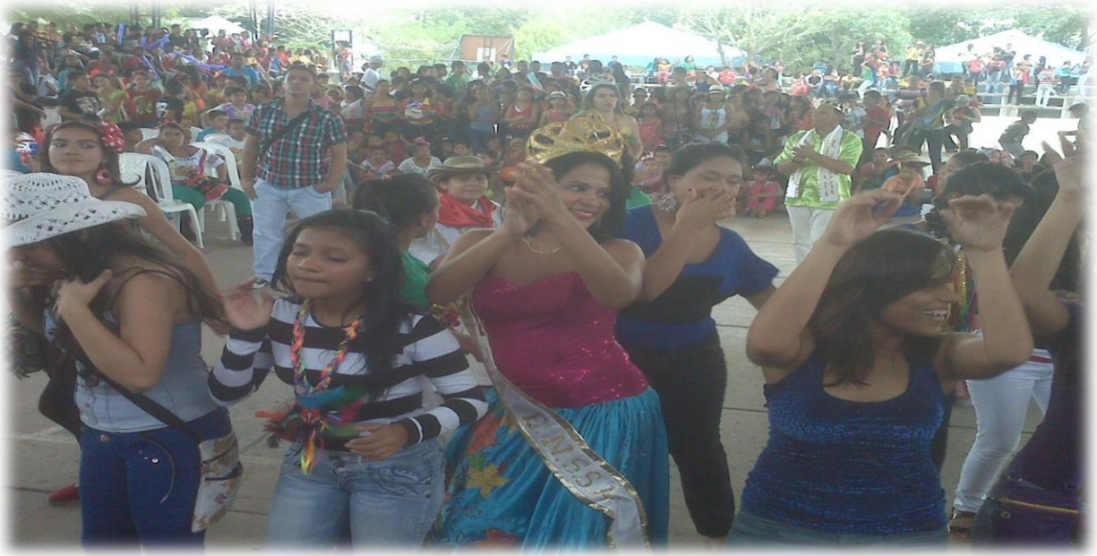
8 Carnavalito ENSSA.