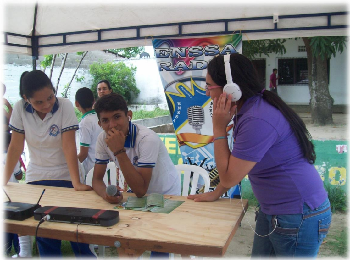
11 Transmisión de la Feria Pedagógica municipal. Semillero de ENSSA Radio.