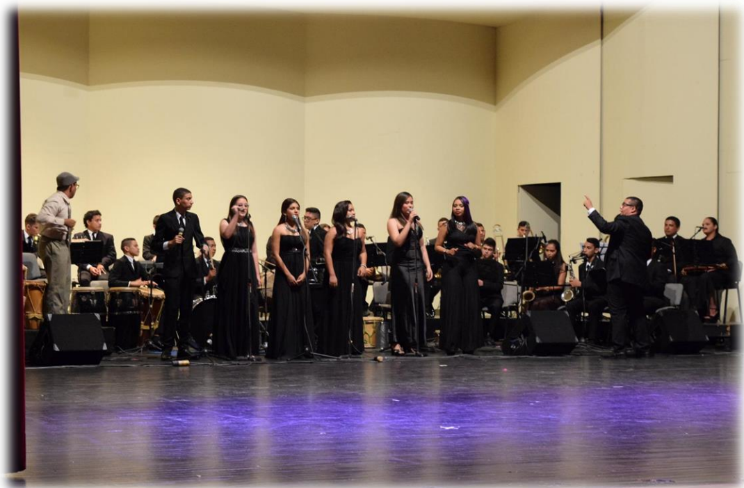
12 Orquesta ENSSA en una de sus presentaciones.