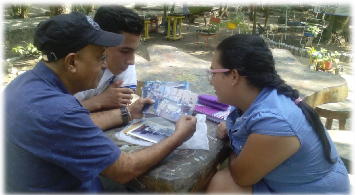
1 Reconocimiento del trabajo Folklórico en la Escuela Normal Superior Santa Ana.

-Realización de una feria educativa para dar a conocer todos los contenidos producidos en el transcurso del club radial, con el fin de visibilizar el trabajo educativo para el rescate de las tradiciones por medio del uso de la música folklórica como mediador en el proceso de aprendizaje.