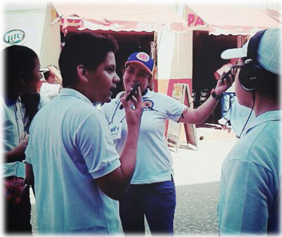
10 Transmisión del desfile conmemorativo a la Batalla de Boyacá. Semillero de ENSSA Radio.