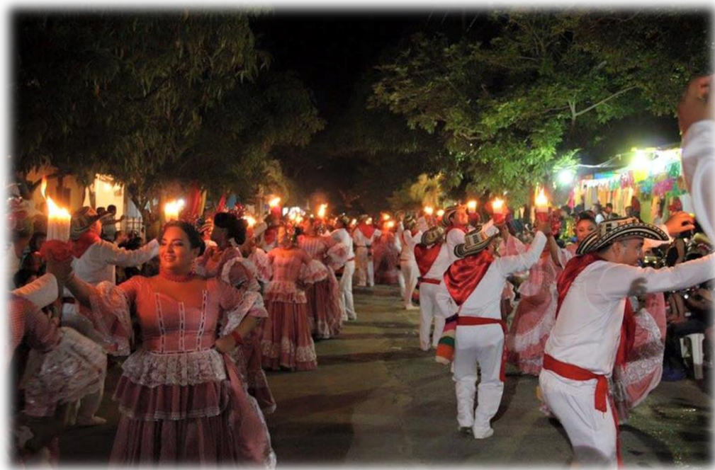
13 Noche de Guacherna. Cumbión 79.