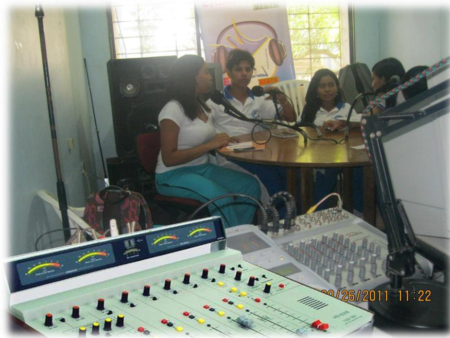
3 Inicios de la Emisora ENSSA Radio.