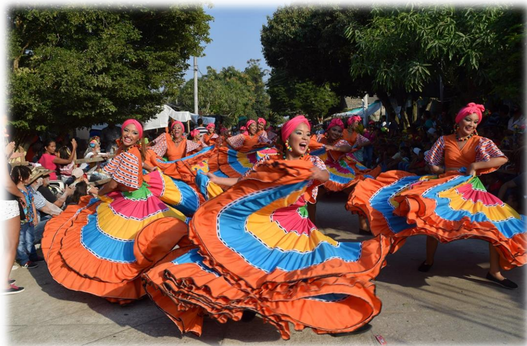
15 Carnaval del Recuerdo 2016.