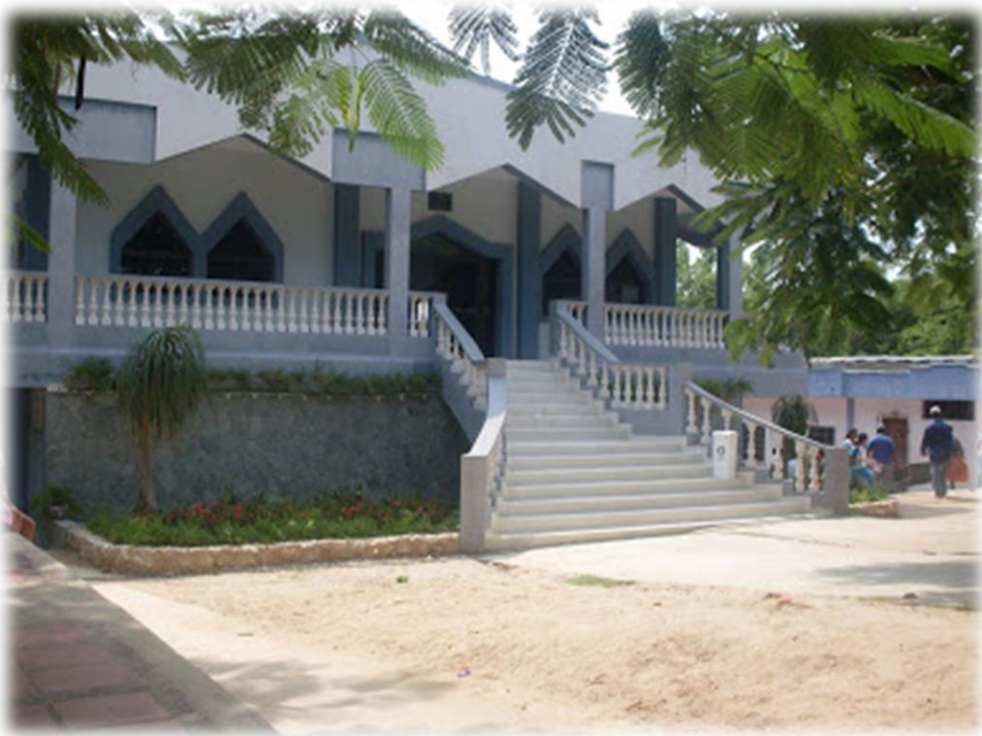
7 Auditorio de la Escuela Normal Superior Santa Ana.