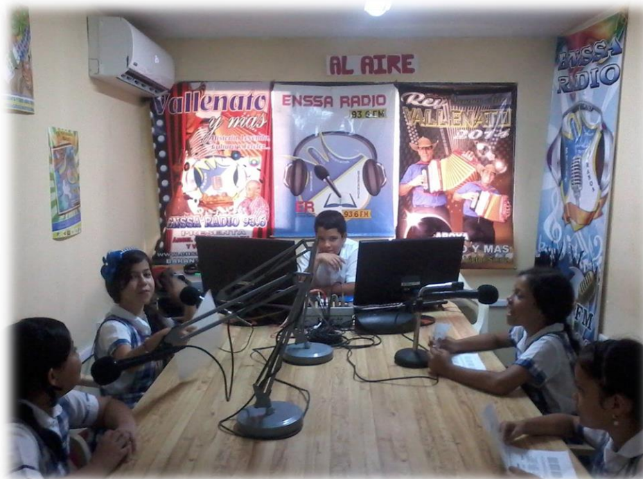
4 Actual instalaciones de la emisora ENSSA Radio.