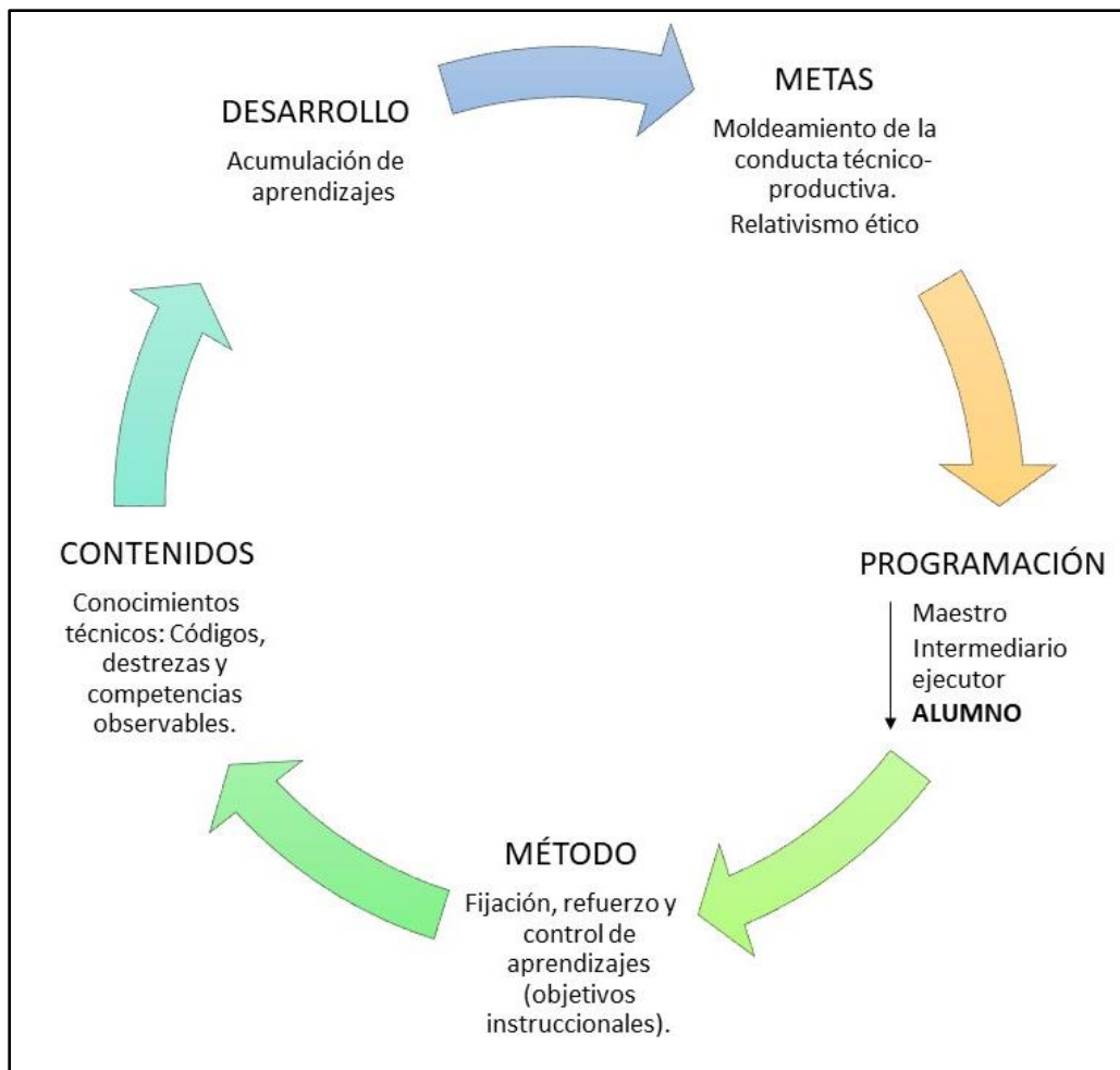
Figura 3. Modelo Conductista.

el dominio del objetivo con la calidad que se esperaba. Mientras el refuerzo no ocurra, los estudiantes tendrán que ocuparse de observar, informarse y reparar en los elementos que contiene el objetivo instruccional, que es precisamente la respuesta moldeada que tienen que ensayar, practicar y ajustar hasta lograr producirla con la perfección prevista; y es el profesor quien la acepta y la refuerza.