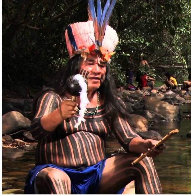
Ilustración 2. Captura de pantalla entrevista Álvaro Tucano. Adaptado de: (Alex Pinago, 2012).

grupos de regiones aledañas al resguardo de Mitú, en los diferentes departamentos de la región amazónica.