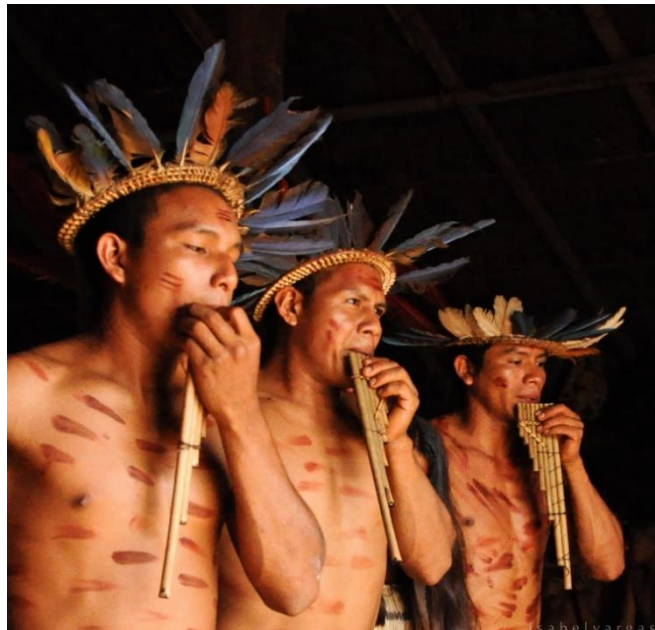
Ilustración 1. Captura de imagen: ritual cubeo en el documental Pezca cubeo dabucury vaupes piramiri wacuraba cubeos . Adaptado de ( Memoria Festival Dabucury , 2007).

Como comunidad cubea , los miembros de Urania Mituseño se consideran hijos de Kubay, y pertenecen a una antigua tradición de grupos indígenas que “viven en el río Vaupés, de Santa Cruz de Waracapurí para arriba y dominan los grandes afluentes del Vaupés, como los ríos Querarí y Cuduyarí y los caños Cubiyú y Carurú” (Borrero & Pérez, 2004, p. 29). A continuación, una imagen que muestra sus rasgos étnico-raciales: