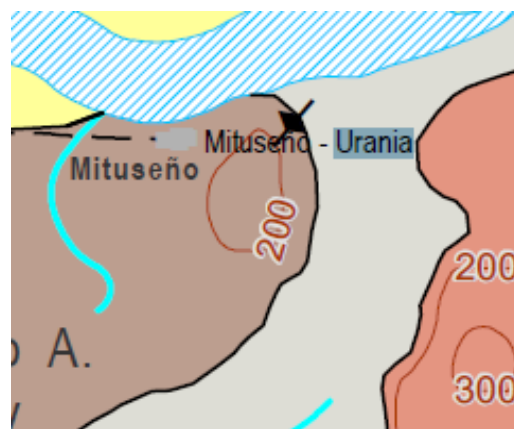
Mapa 2. Geología de la Plancha 443 Mitú – Vaupés (detalle) – 2. Adaptado de: (Servicio Geológico Colombiano, 2011).

En esta primera plancha se observa claramente la información que se ha presentado de la constitución del suelo, la orografía y la hidrografía de la región; la geografía mituseña es pues una “mixtura de sustratos y niveles; de paisajes negros de tierra y de verdes de vegetación; de una riqueza tan infinita como su origen ancestral” (Borrero, 2017). Así mismo, se constata, como muestra el detalle de la misma plancha, la altura relativa del terreno en el que está ubicada –200 metros más arriba del nivel del mar– y su proximidad con el río, el cual nutre esencialmente la vida de la comunidad.