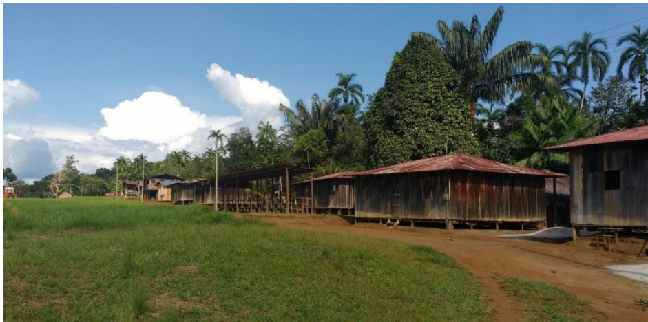
Ilustración 5. Bohío de Urania Mituseño. Adaptado de: (Roldan, 2016).

Ahora bien, para terminar de describir las condiciones físicas es indispensable entender cómo los indígenas han entrado a modificar el plano natural del desarrollo. Si bien es cierto que la intervención indígena es mucho menos densa, como se dirá a continuación, en contraste con el municipio de Mitú, la utilización de la geografía les ha permitido distribirse armónicamente en el espacio sin causar mayor sobre salto; de ahí que sea necesario comenzar a hablar de cómo está constituida la vivienda indígena, y cómo ésta encuentra un aprovechamiento óptimo con el establecimiento de la maloca tipo bohío, que como se verá en las siguientes gráficas utiliza una forma de arquitectura que permite en la suspensión de los pilares vivir en una zona como la antes descrita, sin sufrir también consecuencias a la salud.