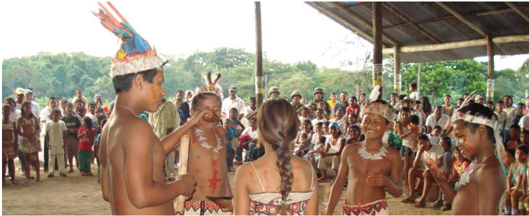
Ilustración 4. Muestra infantil de un grupo Siriano en el festival Dabucury, 2007. Adaptado de: (X Festival de la Solidaridad y el Dabucury, 2007.)

La segunda referencia complementaria a las dos grandes etnias que componen la comunidad de Urania Mituseño, y que aquí se ha de anotar, es sub reconocerse como parte de la familia étnica de los Sirianos, de quienes algunos miembros obtienen las siguientes características: