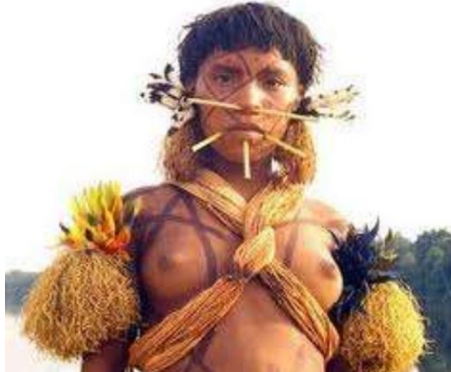
Ilustración 3. Indígena Desano con ropas y tocados característicos. Adaptado de: (Ministerio del interior, s.f.).

Los siguientes perfiles etnográficos, aunque son de menor representación, a la hora de considerar cómo está constituida etnográficamente la comunidad Urania Mituseño, muestran otros aspectos raciales esenciales. La primera de ellas es Desana etnia que: