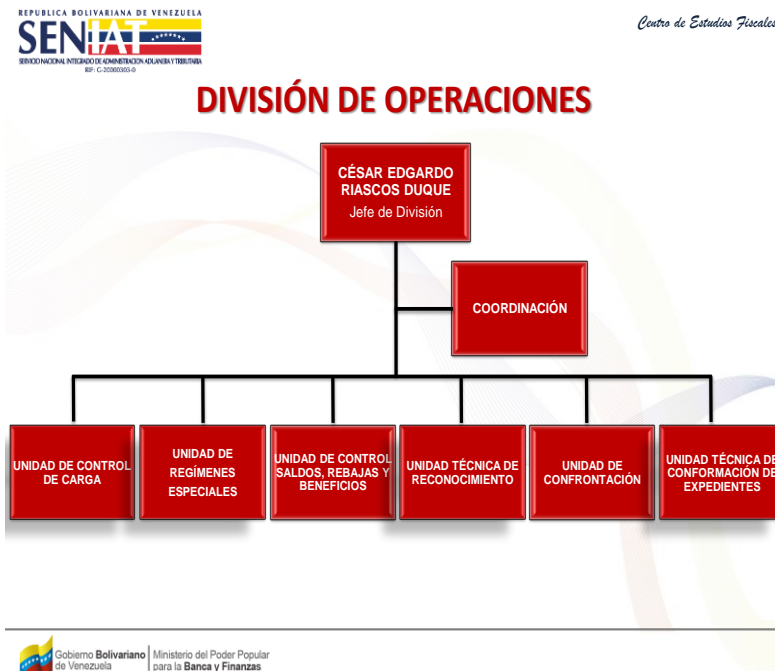
Figura 2. Estructura Organizativa de la División de Operaciones.

2.1.5. Productos y servicios de la práctica profesional. Está habilitada para las operaciones de: Importación, Exportación y Transito a través del territorio nacional y con los servicios de Bultos Postales y Cabotaje, para la administración de la actividad aduanera. Tiene como objetivo Confrontar, registrar, verificar que la documentación suministrada este completa y conforme con las exigencias en la ley orgánica y sus reglamentos.