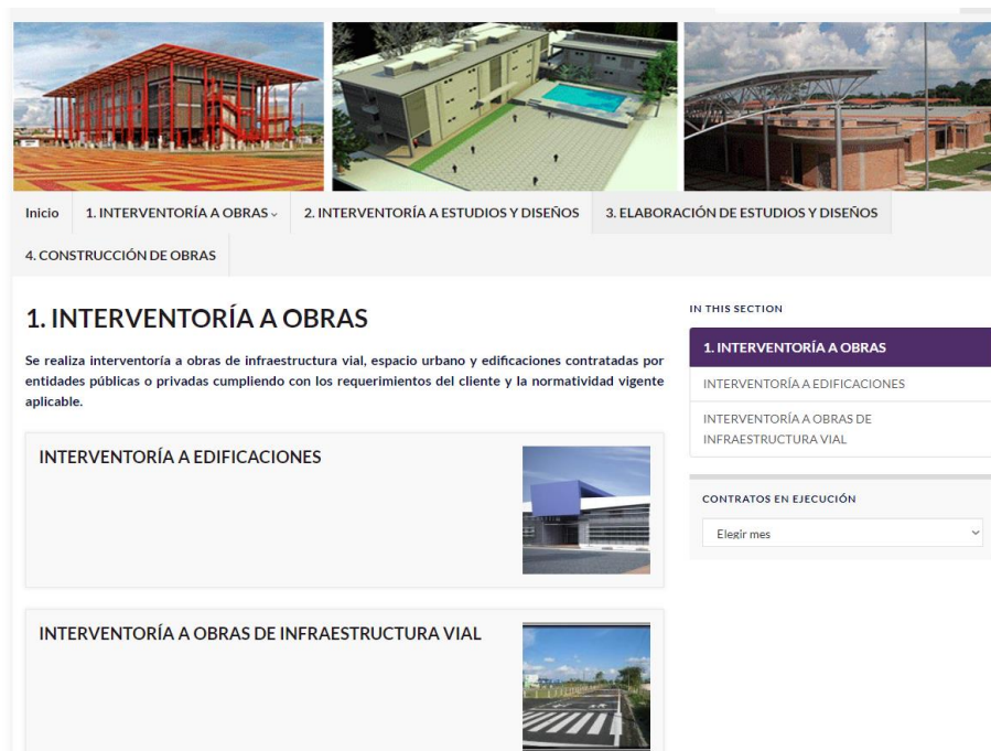
Ilustración 1. Presentación página web

La empresa brinda servicios de consultoría a nivel nacional y de construcción a nivel regional, cuenta con su sede en la ciudad de Villavicencio y en sus instalaciones se brindó el acceso a energía e internet para el desarrollo de la pasantía; de forma virtual se accedió a la experiencia total y al cuadro de seguimiento de los procesos de contratación. Dentro del rango de procesos de participación va desde los noventa millones de pesos a cinco mil millones de pesos colombianos. En su página web podemos encontrar algunos de las interventorías realizadas, así como la elaboración de estudios y diseños.