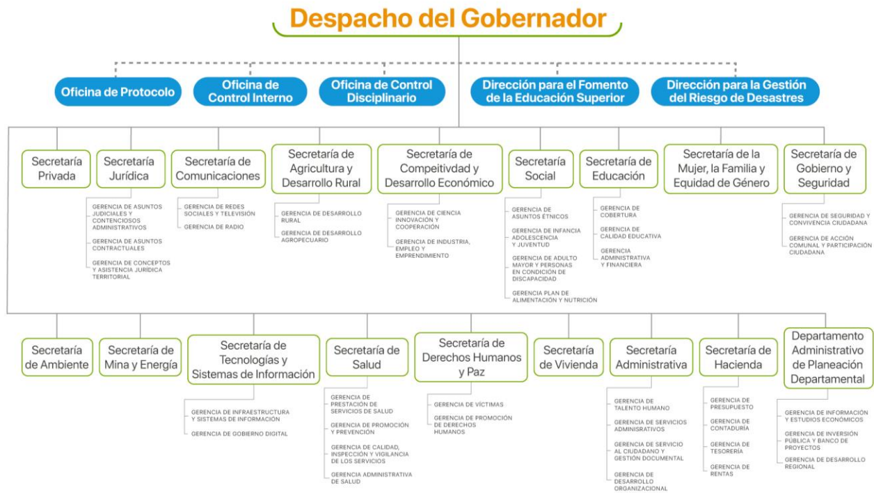
Organigrama Gobernación del Meta Administración Central.

Nota. Estructura organizacional de la Gobernación del Meta, Adaptado de (Gobernación del Meta, s.f.)