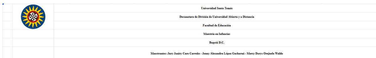
Matriz 1: Revisión de Programas de Licenciatura en Educación Infantil en Colombia