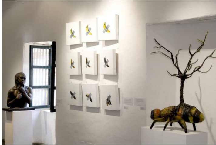
Figura 7 Abeja