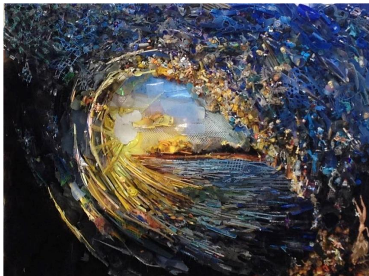
Figura 2: Ola 3 (sol amarillo)

Un segundo referente fue Tom Deininger, un experto pintor que usa sus habilidades pictóricas y del manejo del color, para hacer piezas de arte que demuestran que hasta la más minúscula e insignificante pieza de basura puede ser un objeto esencial para componer magnificas obras de indudable manejo de la composición y el color.