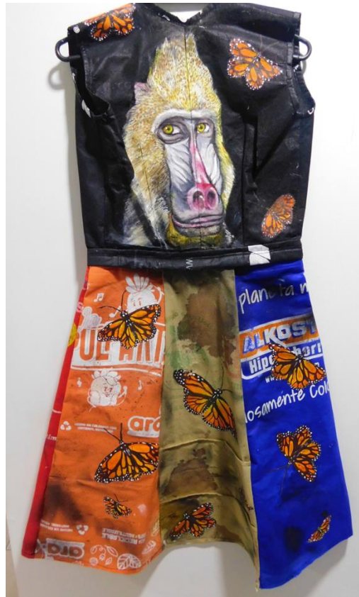
Figura 16: Mandril

El mandril habita en el oeste africano y como todo primate actúa en el ecosistema como dispersor de semillas de una variedad de plantas, que contribuyen a que el ambiente sea sostenible y mantenga la diversidad en el ecosistema. Actualmente se encuentra en vía de extinción debido a la extensión de fronteras agrícolas que invaden su territorio, otro factor es que su carne se considera un manjar y al vivir en manadas tan grandes, es común que en una sola casería gran parte de un grupo de mandriles sea comercializado, limitando así su existencia.