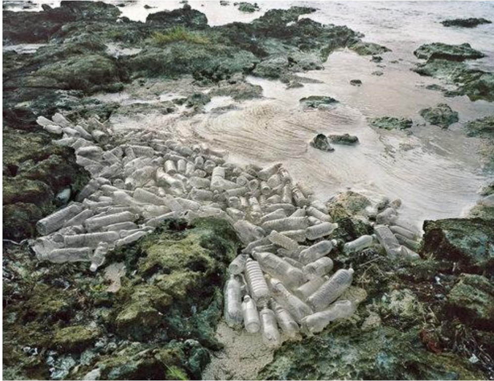
Figura 4: Espuma

Con su obra “Espuma” Alejandro Durán demuestra a través de su composición fotográfica como los residuos plásticos se han infiltrado en los ecosistemas naturales y empiezan a ocupar lugares que les corresponden a especies nativas de los ecosistemas en los que se encuentra la basura internacional.