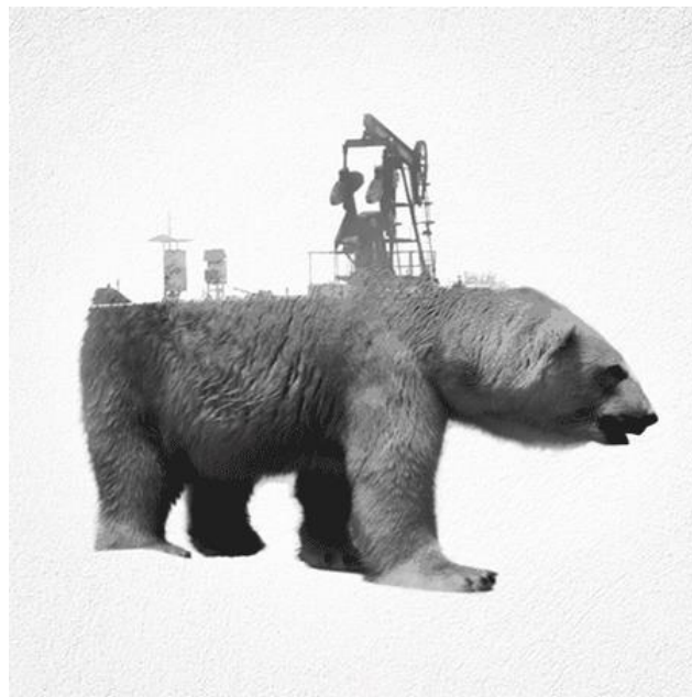
Figura 3: Salva el mundo, salva la vida

Un tercer referente fue el diseñador gráfico Said Dağdeviren, quien en su obra muestra los calvarios que sufre la naturaleza y como afecta en muchos casos a especies que están al borde de la extinción. La silueta de estos animales sirve de marco y lupa, para observar lo que no queremos ver.