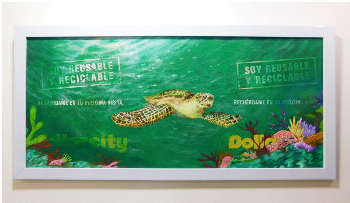
Figura 11: Tortuga Carey

La tortuga carey (figura 11) es representada en un cuadro de dimensiones 100 cm X 50 cm. es una especie altamente migratoria que ayudan a mantener los arrecifes de coral saludables y transita en aguas tropicales de los océanos atlántico, pacífico e indico, en el mar negro y el mediterráneo; se alimenta de moluscos, algas marianas, crustáceos, erizos de mar, entre otros. Actualmente está en peligro de extinción por la expansión urbana en las costas que son su lugar de habitación y la comercialización de su carne que hace parte de la dieta alimentaria del hombre en algunos lugares, así como su caparazón el cual es muy apreciado como insumo en la creación de objetos decorativos de carey.