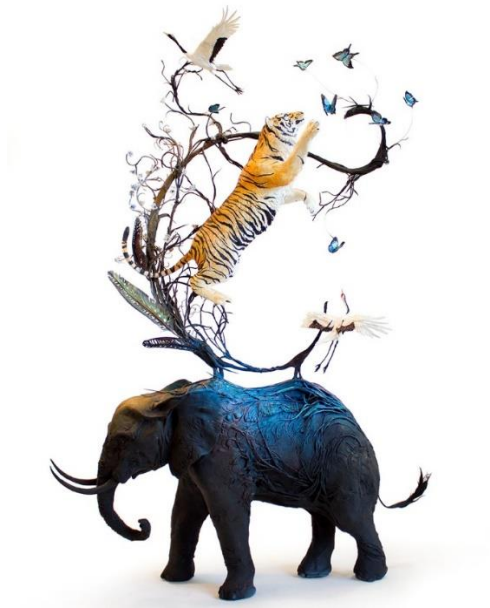
Figura 5: Caminos sin resolver

Jewett en su obra resalta el valor de los ecosistemas y el ciclo de vida que se desarrolla en ellos, con su escultura demuestra la importancia de la coexistencia de las diferentes especies y como el respeto por la existencia del otro es necesaria para la supervivencia de los ecosistemas y sus habitantes, gestando en el observador la inquietud ¿Qué hago yo para la sana coexistencia en los ecosistemas?