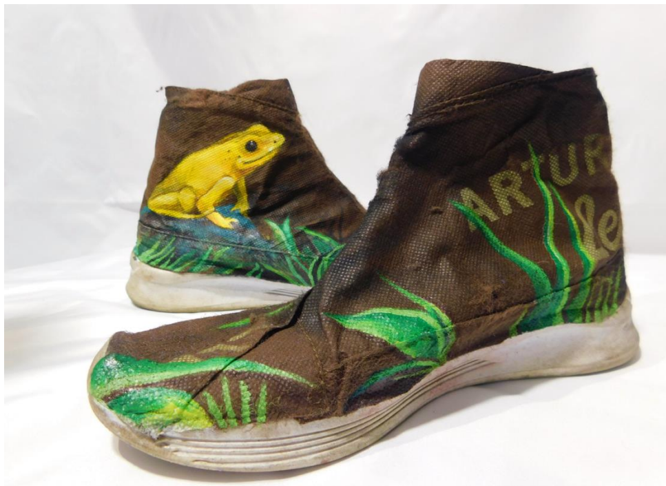
Figura 13: Rana dorada

La rana dorada (figura 13) es una especie que se encuentra en la selva tropical de la costa del pacífico colombiano, se destaca por ser un anfibio de colores brillantes y llamativos que van desde el amarillo, el naranja hasta el verde pálido los cuales usa para protegerse de posibles depredadores y es considerada altamente venenosas; es importante dentro del ambiente porque se alimenta de moscas, termitas, escarabajos, grillos y hormigas lo cual contribuye en el ecosistema a controlar las plagas de insectos de transmiten enfermedades como el dengue, el zika, entre otros, que pueden ocasionar la muerte. Se encuentra en vía de extinción por la destrucción de la selva