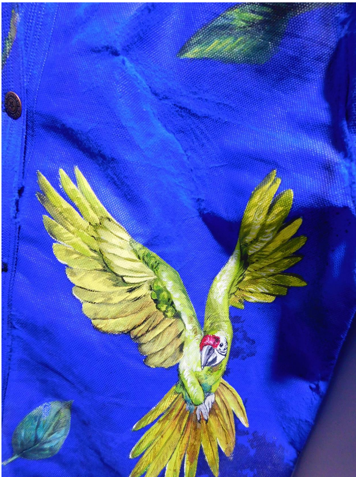
Figura 17: Detalles del Guacamayo militar