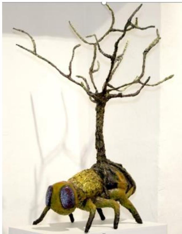
Figura 9 Escultura de la abeja

Abeja (figura 9) es una escultura que tiene unas dimensiones de 70 cm de largo por 70 cm ancho por 105 cm de alto, realizada a partir de la indagación sobre la importancia de la especie para los ecosistemas y la vida del hombre. La abeja es una especie polinizadora que se encarga de más del setenta y cinco por ciento (75%) de los alimentos que producen y consumen los seres humanos y diversas especies de vertebrados, que actualmente se encuentra en vía de extinción