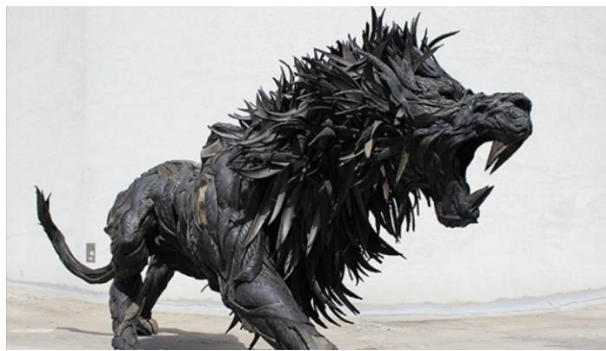
Figura 6: León

Es así como la obra que desarrolla el artista Yong, demuestra como un desecho de larga descomposición como son los neumáticos pueden ser transformados dándoles un nuevo sentido y oportunidad de vida, que no solo hagan recordar al espectador el sentido de utilidad del material en la cotidianidad del hombre, sino la oportunidad que tiene al convertirse en una pieza de arte.