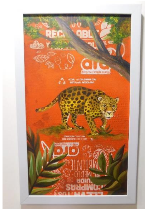
Figura 10: Jaguar

El jaguar (figura 10) animal que habita en bosque húmedos del choco, la Orinoquia y la Amazonia, es representado en un cuadro de dimensiones de 80cm X 45cm es una especie muy importante para mantener los entornos en los que habita, se encarga de controlar la proliferación de otros animales contribuyendo al equilibrio en los ecosistemas; actualmente los jaguares están en vía de extinción debido a la pérdida de su hábitat por el crecimiento en las fronteras agropecuarias, mineras y la explotación forestal y el conflicto armado de la región, además del tráfico ilegal de las especies.