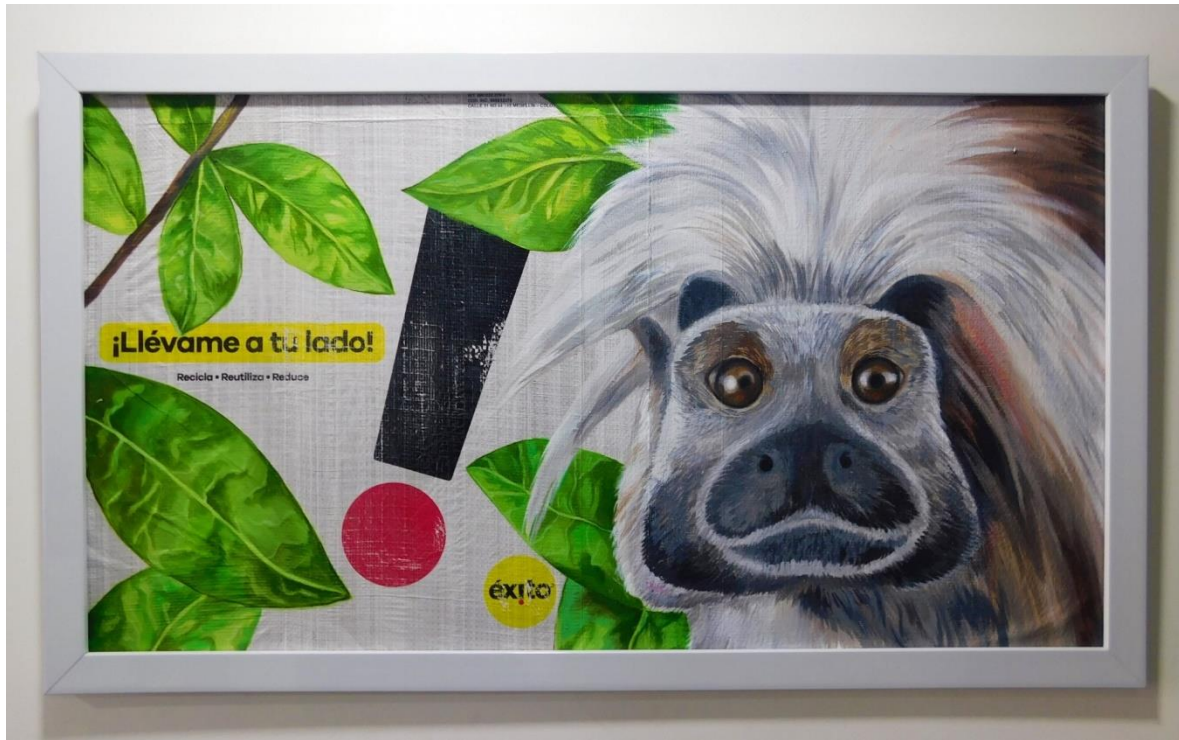
Figura 12: Mono titi cabeza blanca

El mono titi cabeza blanca (figura 12) es representado en un cuadro de dimensiones de 100 cm X 55 cm, esta especie desarrolla un papel importante en los ecosistemas tropicales en los que habita debido a que contribuye a la difusión de semillas con sus heces que son una fuente excelente de fertilizante para la germinación de vegetación en los lugares que vive. Actualmente, se encuentra en vía de extinción por el desarrollo de la agricultura y proyectos de explotación petrolera que han fomentado la pérdida de su hábitat (selva tropical). Además de ser exportados y puesto en cautiverio de manera ilegal a los EEUU, para realizar investigaciones y estudios relacionados con el cáncer del colón.