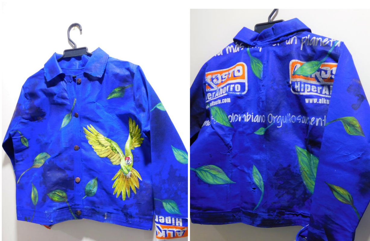
Figura 14: Guacamayo verde

La guacamayo verde o guacamayo militar (figura 14) es importante en el ambiente en el que habita debido a que se encargan de la dispersión de semilla en los bosques, propiciando el sostenimiento de la vegetación de esos lugares. Esta en vía de extinción porque su voz e imitaciones es llamativa para el hombre como entretenimiento, lo cual la convierte en una especie exótica para mantener en cautiverio como mascota. Además, en algunas zonas los campesinos que han invadido su hábitat la atacan por considerarla una plaga debido a que consumen algunos alimentos de los cultivos.