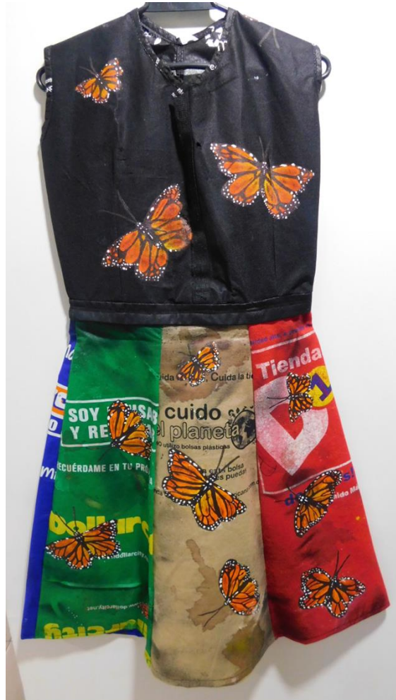
Figura 15: Mariposa monarca

La mariposa monarca (figura 15) es importante en el ambiente porque es un indicador de la calidad medioambiental y la salud de los ecosistemas, debido a que donde hay mariposas también hay gran cantidad de invertebrados, contribuyen además a la polinización y el control natural de plagas. Ahora bien, se encuentra en vía de extinción por el uso de pesticidas durante la producción agrícola que originan la muerte de las mariposas monarcas y particularmente perturban el proceso de gestación de la mariposa pues ella solo deposita las larvas en la planta denominada algodoncillo que por el uso de pesticidas está contaminada ocasionan así su muerte.