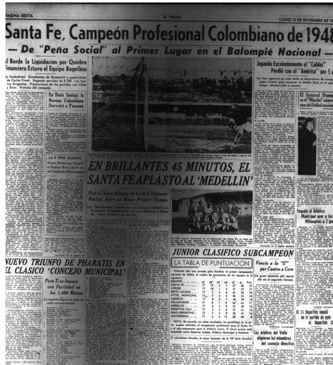
Figura 6: foto tomada a la edición del 13 de Diciembre de 1948 de “El Tiempo”.

En 1949 El Tiempo prestó gran cuidado al fútbol, sin embargo una que otra vez manifestó no asistir a las elecciones y denunciar al partido conservador por fraude también atacadas a los liberales mientras que El Siglo habla de violencia liberal y la renuncia de los mismos para las elecciones del 27, intervención de la milicia a imponer orden mientras la gente solo piensa en fútbol, también manifestaba respaldo a Ospina Pérez y a Laureano Gómez, también hablaba de fútbol pero de los resultados y cosas mínimas no con los detalles del periódico liberal, para este año Millonarios habría quedado como campeón del fútbol profesional colombiano.