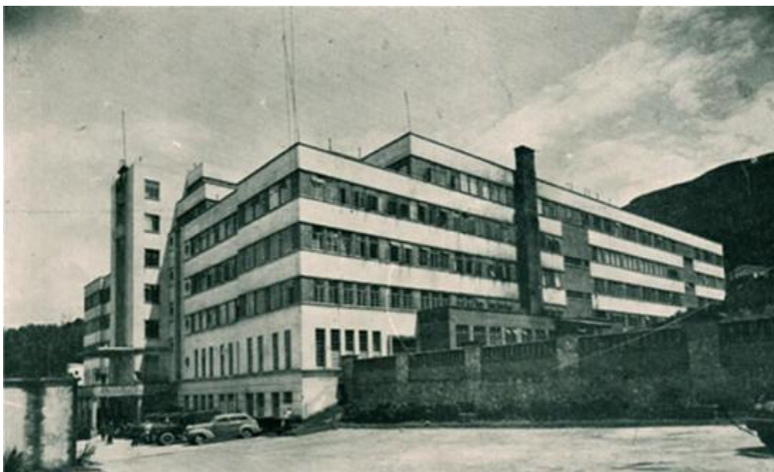
Figura 5: Colegio San Bartolomé La Merced.

sus labores en 1604 y fue fundado por la Compañía de Jesús con la ayuda del Arzobispo de Bogotá, el señor Bartolomé Lobo Guerrero en la Plaza de Bolívar de Bogotá, para la década del 30 la compañía de Jesús se vería amenazada por el gobierno a causa de presiones políticas que éste ejercía por el contrato que se tenía entre el mismo y la institución; debido a ello Los Jesuitas iniciaron la construcción de la sede del colegio en la finca de La Merced para iniciar clases en 1941 y desde entonces hasta la actualidad ha sido dirigido por la compañía de Jesús (Colegio San Bartolomé, La Merced)