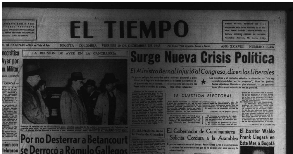
Figura 1: foto tomada de El Tiempo, 10 de diciembre

ejemplo de ello son estos periódicos y su interdependencia con los partidos políticos dado como una relación entre fenómenos interdependientes (prensa-política), vemos que en la actualidad no se ve tan arraigada esta interdependencia entre la prensa y la política dada a partir de reglamentos y decretos que así lo estipulan, sin embargo no del todo podemos decir que estos fenómenos son en la actualidad totalmente ajenos e independientes pues si realizáramos un estudio sobre los dueños de las cadenas radiales, televisivas y/o periódicos, entre otras veríamos que sus dueños pertenecen a ciertos grupos ideológicos o políticos, pero pues ese no es un tema que compete en el presente escrito, sino una aclaración.