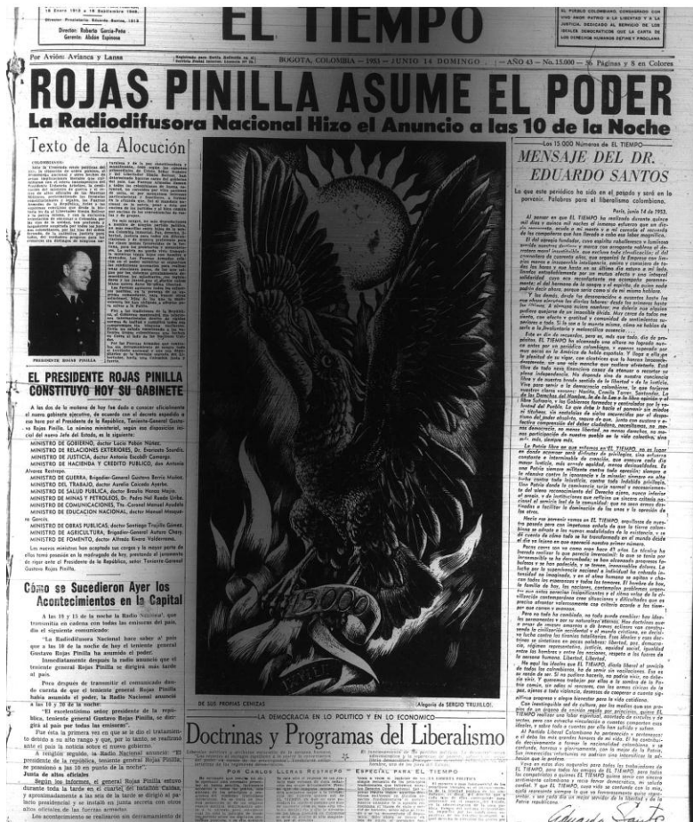
Figura 9:

administrativos, voto femenino, respecto a los partidos se invito a 2 de Santa Fe y 1 de Millonarios.