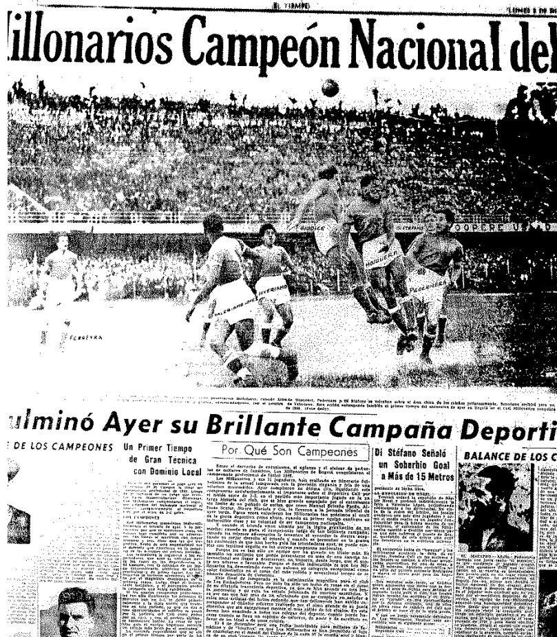
Figura 7: foto tomada del periódico “El Tiempo” del 5 de diciembre de 1949.

Para el 51 las noticias serían referentes al fútbol para El Tiempo, casi no hubo noticias sobre política al igual que el 49 pues la mayoría de las noticias se referían a la guerra nazi, ataque alemanes y asuntos del exterior, respecto a las invitaciones al estadio hubo 12 referentes a partidos de Santa Fe vs (San Lorenzo, Quindío y Universidad de Chile) mientras que de Millonarios también contra (Racing y San Lorenzo). El Siglo casi todo comprendía el fútbol y la convención conservadora y la nueva directiva del partido y su