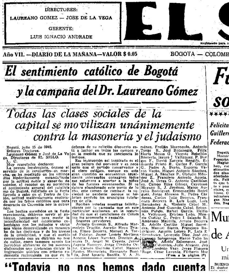
Figura 4:

Para este año el Independiente Santa Fe permitió dejar entrar jugadores de otros colegios, también tendría para este año el equipo roji blanco el sub campeonato de la segunda categoría de la Asociación Deportiva de Bogotá. Posteriormente la prensa empezaría a pedir el ingreso del equipo a la primera categoría donde en un partido contra Universidad derrotado este último por 7-4 subió (González, 2013)