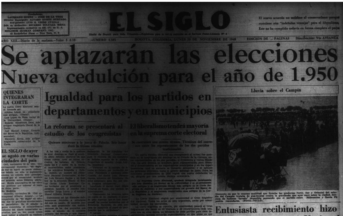
Figura 2: foto tomada a la edición del 29 de Noviembre de 1948, de El Siglo.

El contexto espacial a estudiar es Bogotá teniendo en cuenta que es la ciudad de origen de los equipos y durante dicha temporada la república estaba estatuida como centralista –como ya se había mencionado en capítulos anteriores-; y de los procesos dados en Bogotá se derivaban los demás siendo este el epicentro político del país.