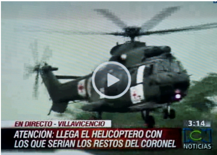
Imagen 8. Vehículo de corporeidades cautivas