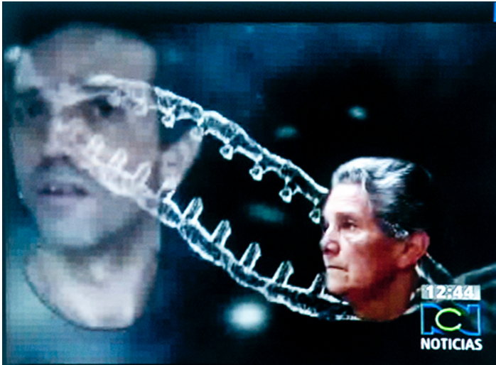
Imagen 12. . Corporeidades que trascienden la piel. La continuidad del cuerpo de Guevara en los mapas genéticos.