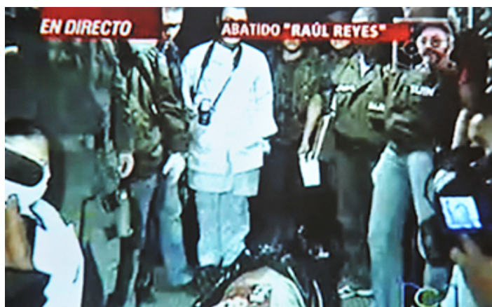
Imagen 1. Arribo de Reyes a los espacios de normalización