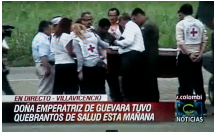
Imagen 9. Arribo del cadáver del Coronel Julián Ernesto Guevara al aeropuerto de Villavicencio