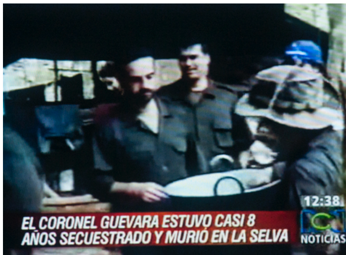
Imagen 10. Guevara en el espacio de las corporeidades cautivas