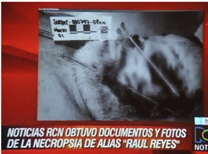
Imagen 4. Necropsia de Reyes