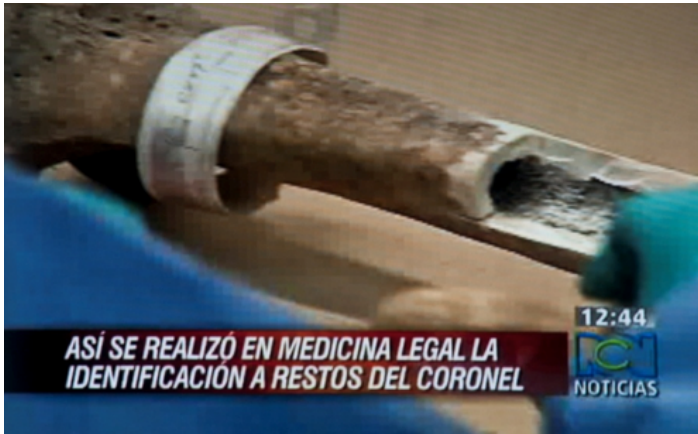
Imagen 13. Identificación ósea de Julián Guevara

Fuente: Noticias RCN (4 de abril de 2010).