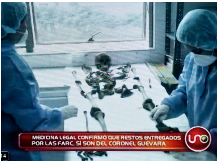
Imagen 14. Microcosmos identitario