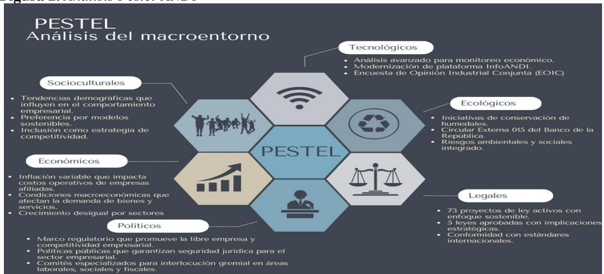
Figura 2. Análisis Pestel-ANDI

Finalmente, la Circular Básica Contable y Financiera del Banco de la República incorpora factores ambientales, sociales y climáticos en operaciones financieras, afectando a las empresas vinculadas a estas entidades (Banco de la República, 2025).