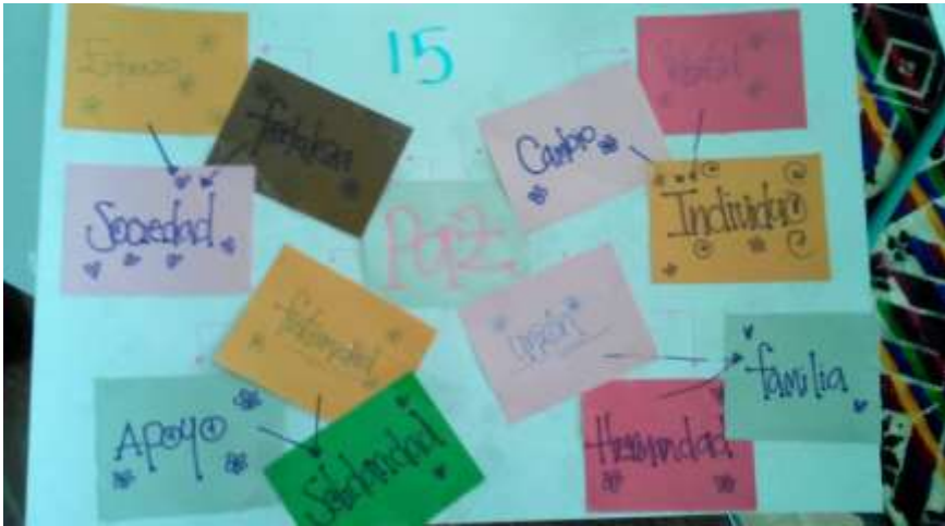
Figura 8. Cadenas semánticas

La paz se representa aquí como un aspecto que guarda relación de significado con la unión, la fraternidad, la fortaleza, el cambio, de donde se desprenden otros aspectos como la sociedad, familia, solidaridad, individuo.