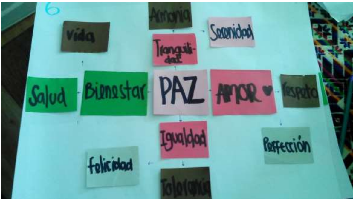
Figura 9. Cadenas semánticas

La paz se representa aquí como un aspecto que guarda relación de significado con la unión, la fraternidad, la fortaleza, el cambio, de donde se desprenden otros aspectos como la sociedad, familia, solidaridad, individuo.