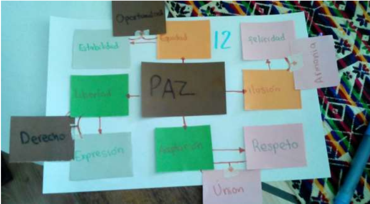
Figura 10. Cadenas semánticas

otorgada por la idea de bienestar y tranquilidad, muy ligadas a construcciones de individuos, más que de sociedad. Con esto se reafirma la inscripción del sujeto en la esfera individual, personal.