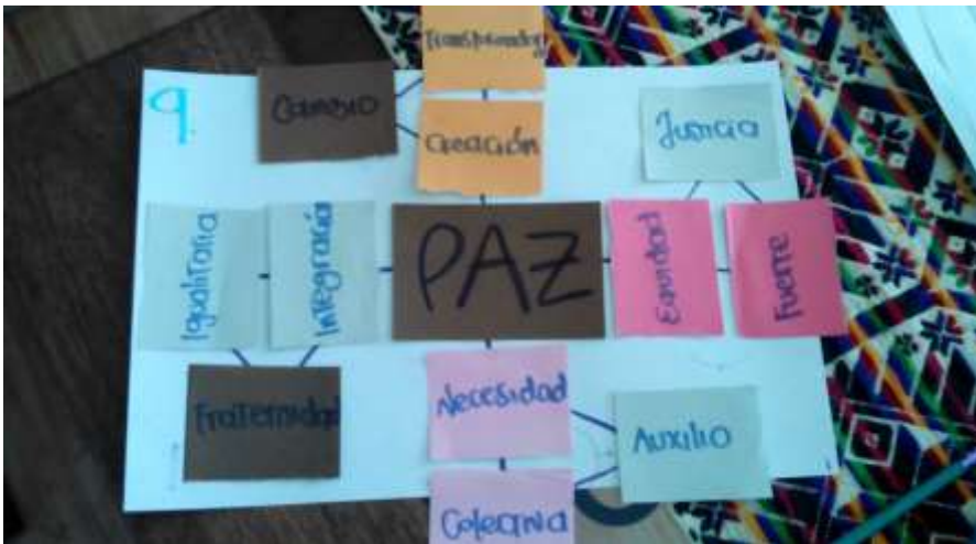
Figura 7. Cadenas semánticas.

gramatical, prevalece la experiencia del individuo en su contexto sociocultural y a partir de esta, concede atributos a la paz: libre, activa, revolucionaria, sabia, responsable, tolerante . Bien podría otorgarse estos atributos a personas. Se produce así una reificación.