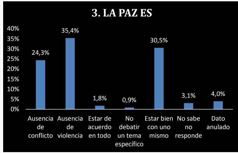
Figura 3. Absoluto. ¿Qué es la paz?