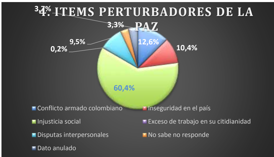
Figura 4. Absoluto. Perturbadores de paz

Los tres ítems que más se relacionan como perturbadores de la paz con los más altos porcentajes son: 60,4 % para la injusticia social, 12,6 % para el conflicto armado colombiano y 10,4 % para la inseguridad en el país. Estas respuestas evidencian que las situaciones que perturban la paz en la cotidianidad de los sujetos, se sitúan en el macro entorno, a gran escala, en el ámbito del país y no de nivel personal, lo cual permite ver unas tensiones entre las responsabilidades individuales y las colectivas en las construcción de paz, en un escenario cualquiera.