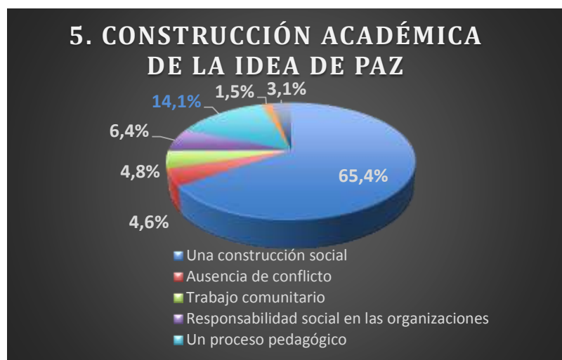
Figura 5. Valorativo. Construcción desde la academia.

Los tres ítems que más se relacionan como perturbadores de la paz con los más altos porcentajes son: 60,4 % para la injusticia social, 12,6 % para el conflicto armado colombiano y 10,4 % para la inseguridad en el país. Estas respuestas evidencian que las situaciones que perturban la paz en la cotidianidad de los sujetos, se sitúan en el macro entorno, a gran escala, en el ámbito del país y no de nivel personal, lo cual permite ver unas tensiones entre las responsabilidades individuales y las colectivas en las construcción de paz, en un escenario cualquiera.