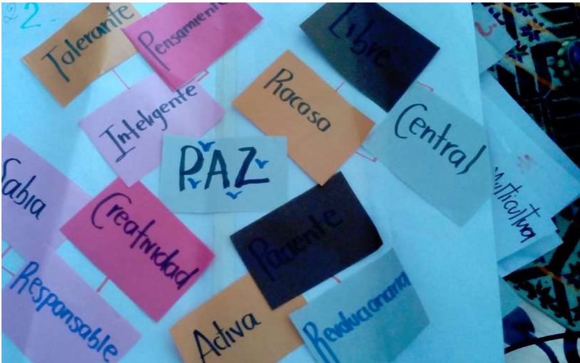
Figura 6. Cadenas semánticas

Primó, por tanto, el acto de la palabra (indistintamente). Un ejemplo de ello, se puede ver en la siguiente fotografía: