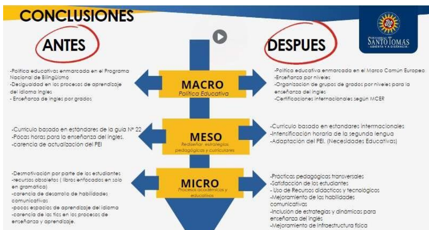
Figura 4 Conclusiones

Es importante resaltar que la información que se presenta a continuación fue basada en una cuidadosa exploración de los resultados obtenidos y los instrumentos de investigación aplicados en el desarrollo de esta investigación, este contenido ha sido registrado en la matriz de análisis cruzado (Apéndice C), la cual ha sido debidamente referida para su consulta. Este análisis se fundamenta en la recopilación de datos rigurosamente recabados y procesados con el objetivo de obtener conclusiones significativas y aportar conocimiento valioso en lo que respecta a la incidencia de la aplicación del modelo de enseñanza por niveles. A través de la siguiente exposición, se desglosarán los métodos utilizados y se presentarán las observaciones e implicaciones de los resultados obtenidos, brindando así una visión detallada y esclarecedora de este proceso investigativo.