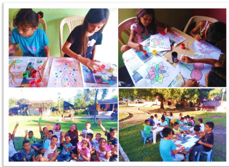
Ilustración 1. Visualización de la realización de talleres

Para ello, las técnicas e instrumentos ejecutados fueron la observación participativa-diario de campo y taller lúdicos pedagógicos-planeaciones; las cuales estuvieron acorde a su madurez cognitiva, para realizar las diferentes actividades que se planearon de manera lúdica, creativa y motivadoras, las cuales permitieron a los sujetos de estudio tener experiencias sensoriales que ayudan a estimular las habilidades artísticas, imaginación, creatividad, fantasía, curiosidad e ingenio. Así mismo, este proceso permitió también la participación activa en el desarrollo del proceso creativo y comunicativo, donde los niños y niñas socializaron e interactuaron de forma