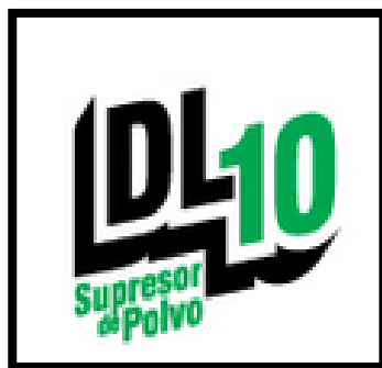
Figura 9 DL-10 Supresor de Polvo

Esta es la línea industrial de la empresa se encarga de producto que se le venden a las compañías que necesitan suplirse de las necesidades y que nosotros ofrecemos esa oportunidad.