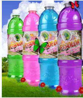
Figura 6 Pisolor

El nuevo desinfectante PISOLOR deja los pisos de los baños, cocinas, sala, comedor, brillantes y limpios; con su exclusiva formula antibacterial concentrada que le permitirá disfrutar de su hogar y alejado de insectos desagradables. Este producto tiene diferentes fragancias: talco, flor de loto, canela, frescura de campo y lavanda e igualmente tiene diferentes presentaciones: 150cc, 500cc, 850cc, galón y 5 galones.