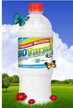
Figura 1 Biovarsol

Son productos que están al alcance en un supermercado o hipermercado de la ciudad e incluso en varias partes del país, es exclusivamente productos para el hogar los cuales esta hechos para el cuidado del medio ambiente y de las personas.