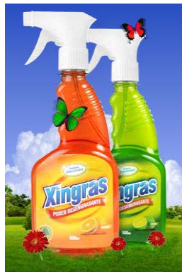
Figura 4 Xingras