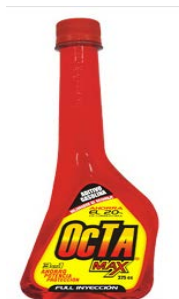
Figura 7 Octamax

Esta es la línea automotriz de la empresa los cuales son productos aditivos que mejoran el combustible de cada uno de los automóviles.