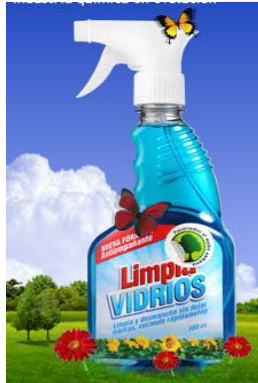
Figura 2 Limpiavidrios

Es un producto con formula avanzada y agentes antiestáticos que repela el polvo, es un líquido transparente y cristalino. Este producto se puede aplicar en vidrios, pantallas de TV, espejos, parabrisas y acrílicos. Se puede encontrar en diferentes presentaciones: 500ccválvula, 1000 cc válvula+ repuesto, galón y 5 galones.