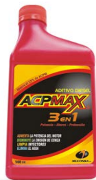
Figura 8 ACPMAX

El producto es una solución oleosa de tensoactivos que produce superficies deslizantes, por tanto se debe usar botas de seguridad antideslizantes, también puede irritar los ojos, por tanto se requiere el uso de gafas de seguridad industrial y al contacto prolongado puede irritar levemente la piel, se recomienda el uso de guantes plásticos industriales.