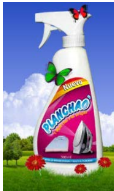
Figura 5 Planchao

Es un producto suavizante, utilizado para facilitar el planchado de cualquier tipo de prenda de vestir. Se puede encontrar en diferentes presentaciones: 500cc, 1000cc válvula + repuesto, galón y 5 galones