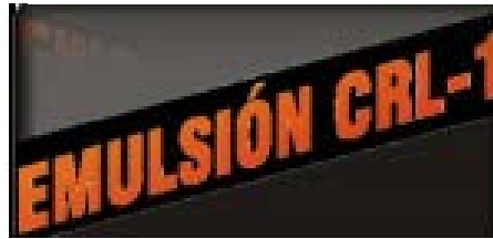
Figura 11 Emulsión CRL-1

El producto se estabiliza por medio de una solución de tensoactivos que produce abundante espuma y superficies deslizantes, se recomienda el uso de botas de seguridad antideslizantes, puede causar irritaciones en ojos, por tanto se requiere el uso de gafas de seguridad industrial.