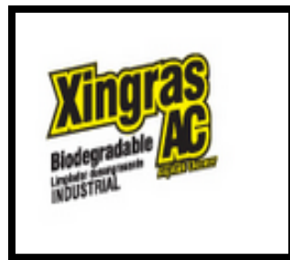
Figura 10 Xingras AC

El producto es una solución de tensoactivos que produce abundante espuma y superficies deslizantes, por tanto se debe usar botas de seguridad antideslizantes, también puede irritar los ojos, por tanto se requiere el uso de gafas de seguridad industrial y al contacto prolongado puede irritar levemente la piel, se recomienda el uso de guantes plásticos industriales.