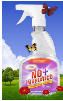
Figura 3 No+Muriatico

Es un producto multiuso diseñado pensando en la salud de las personas, con altas propiedades de limpieza de todo tipo de suciedad en todo tipo de superficies. Se puede encontrar en diferentes presentaciones: 150cc, 500cc, 500 cc válvula, 1000cc válvula + repuesto, galón, 5 galones, 55 galones.