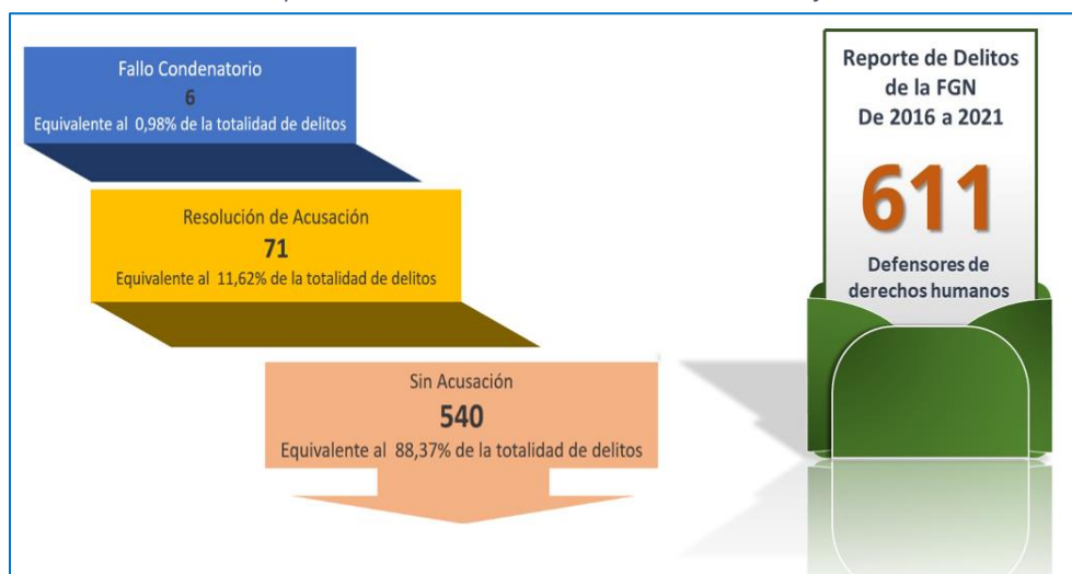
Ilustración 2: Compendio de delitos cometidos a líderes sociales con fecha de corte 2021

Entre el año 2016 y 2021, según el sistema SPOA, fueron registrados como víctimas y denuncias, un total de 611 casos de DDH, encontrando un porcentaje muy bajo de fallos condenatorios en la totalidad de los delitos, siendo tan solo un 0.98% de esclarecimiento, cifra que devela la cantidad de impunidad que se viene presentando en el territorio colombiano, el país se postula en el quinto lugar en Latinoamérica en el índice mundial de impunidad para el año 2017, por debajo de los países de Venezuela, México, Perú y Brasil, si nos vamos al índice mundial, Colombia es octavo de 59 países que se midieron en este aspecto. El despotismo o impunidad es una anomalía que se vive día tras día con altos niveles en Colombia, de los 32 departamentos del país el 57% de ellos se encasilla en un estándar de alto o muy alto de impunidad; sólo el 9% se encuentra en un nivel bajo (Fundación Paz & Reconciliación PARES, 2019, párr. 1).