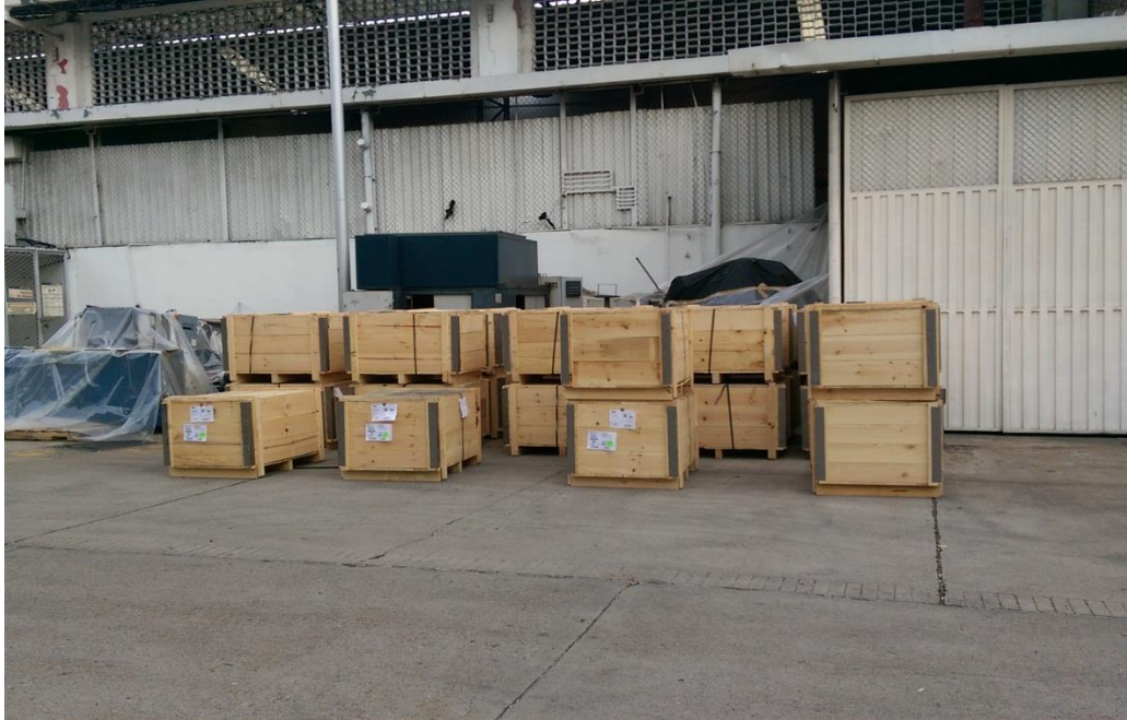
Figura 12. Mercancía descargada en zona secundaria.