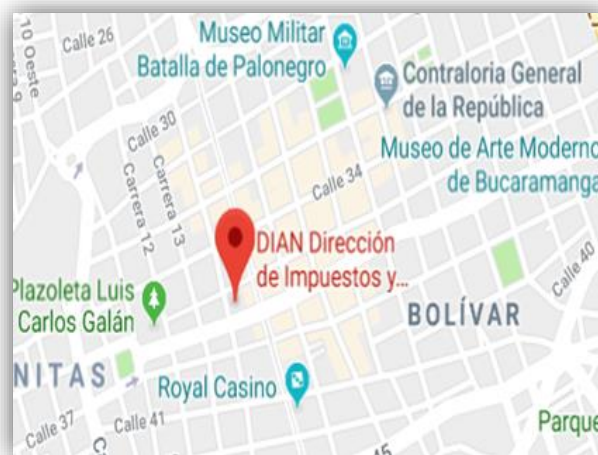
Figura 1. Ubicación Dirección de Impuestos y Aduanas Nacionales (DIAN).

Calle 36 #14-03, Bucaramanga, Santander Tel: (7) 6309444.