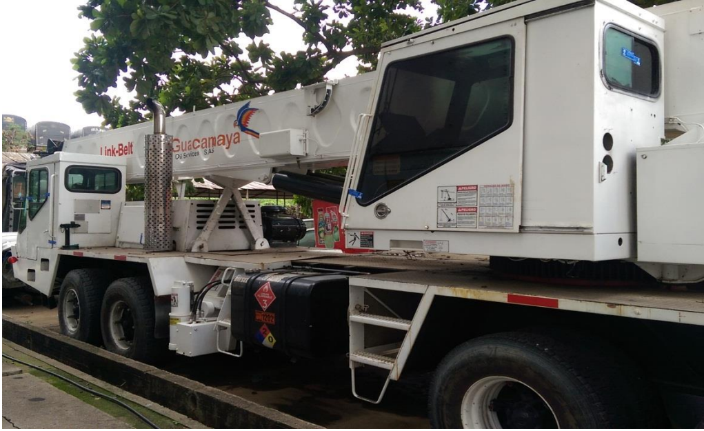
Figura 13. Inspección física de mercancía en zona primaria.