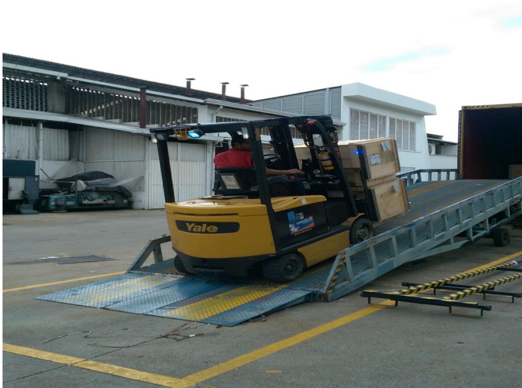
Figura 11. Control de tránsito en zona secundaria.