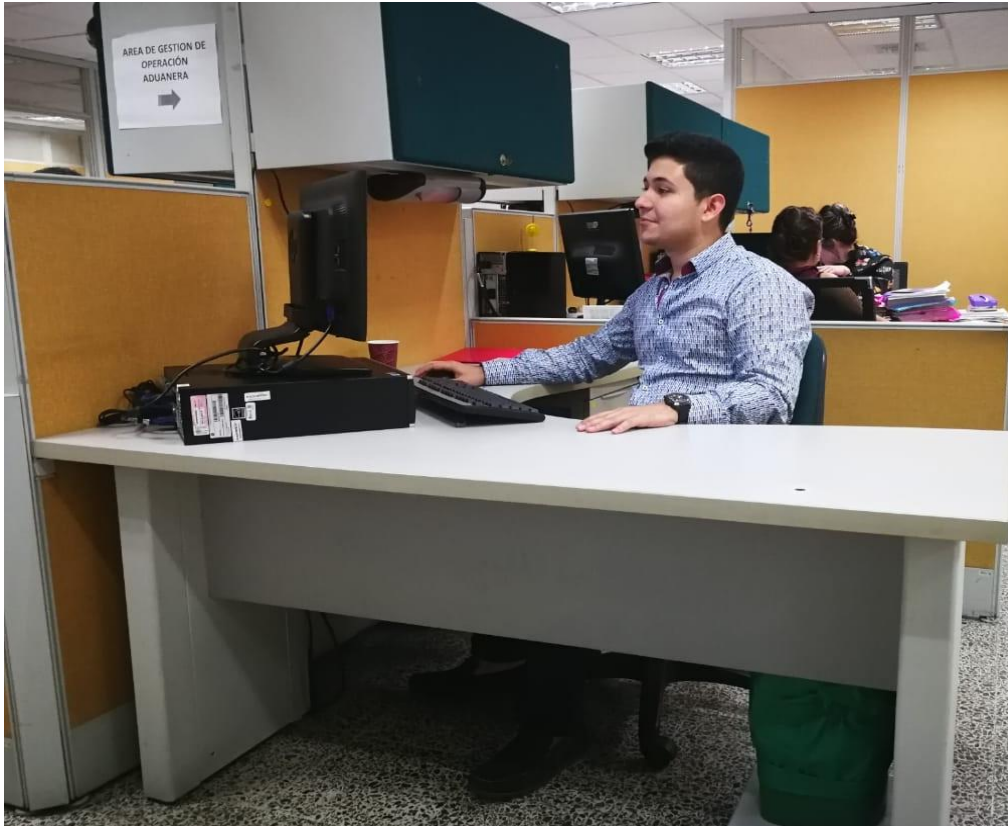
Figura 10. Realizando consulta de deudas exigibles.