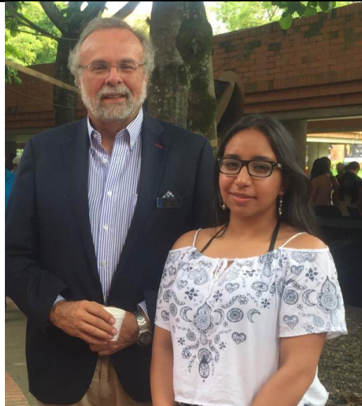
Foto No.2. Encuentro con integrantes de Aneiap Capitulo Icesi.