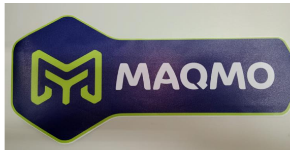
Figura 14. Sticker MAQMO

A. Uribe, archivo personal de la cámara, 16 de mayo del 2023