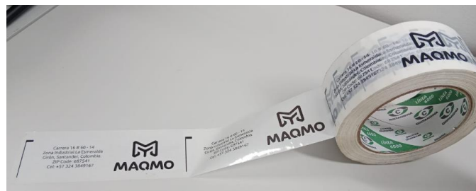
Figura 13. Cinta MAQMO

A. Uribe, archivo personal de la cámara, 20 de febrero del 2023