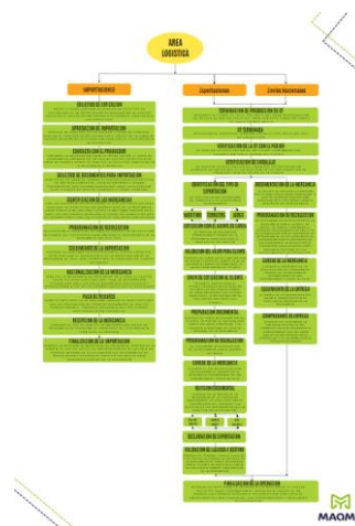
Figura 3. Evidencia del diagrama de flujo

Adaptado de Maquinados y Montajes S.A.S. Infografía ejecutiva