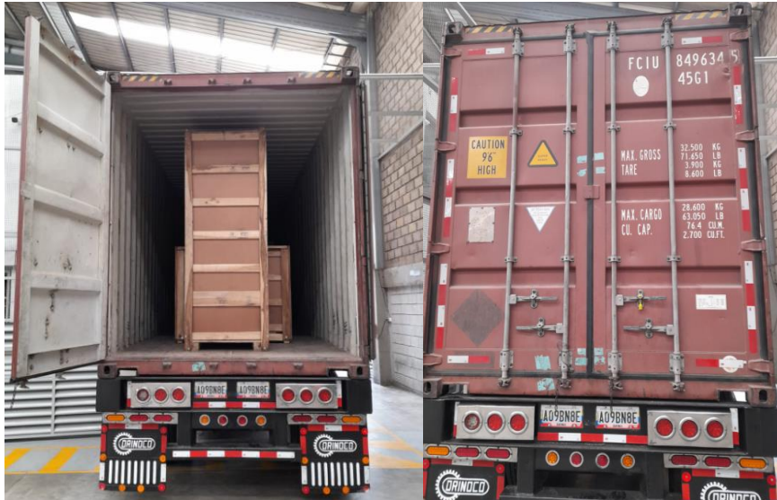
Figura 9. Evidencia cargue de mercancía

A. Uribe, archivo personal de la cámara, 5 de abril del 2023