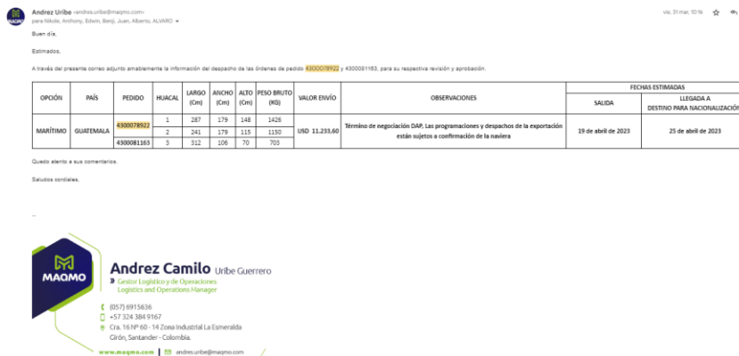
Figura 7. Evidencia de comunicación con el cliente

A.Uribe, Comunicación personal, 31 de marzo del 2023.