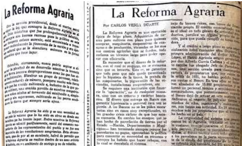
Fuente: EL HERALDO, 15 de diciembre y EL UNIVERSAL, 5 de mayo de 1961.

Pocos fueron los textos hallados que, en medio del listado amplio de bondades que pudiera generar la reforma, incluyeran objeciones técnicas producto de un análisis apartado de la política y el gobierno para sustentarlo desde el tecnicismo y la experiencia en desarrollo rural. Ejemplo de ello fueron sentencias como: "...la simple repartición de la tierra, medida sobre todo de justicia social, es absolutamente insuficiente" y "...un servicio de asistencia campesina...Colombia...con un número totalmente insuficiente de agrónomos, veterinarios y otros consejeros rurales, tendrá que enfrentarse a enormes dificultades", retos que de manera acertada y explicada los aportaron al debate para que fueran contemplados al menos en la fase de normatividad y ejecución de la reforma, aunque no se relataron con la misma fuerza como sus beneficios por ser considerada un instrumento que partía en dos la historia de la atención al campo nacional: "...vale la pena meditar serenamente para comprender que la proyectada reforma agraria...no es arbitraria ni radical como la realizada en otros países".