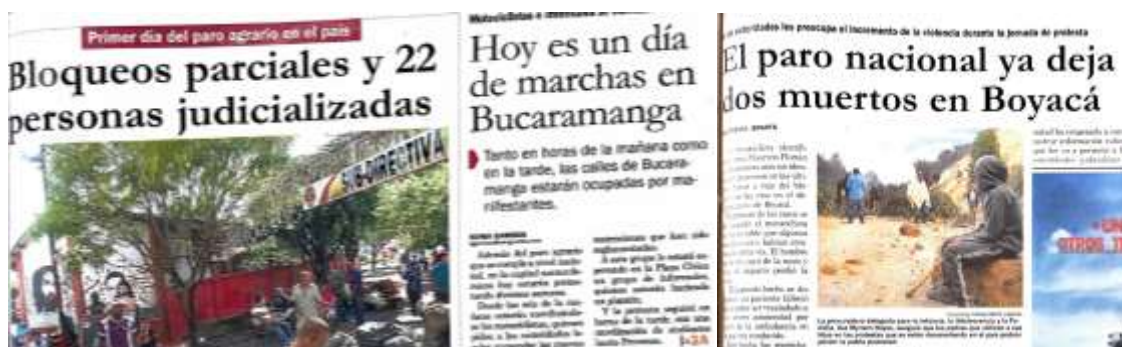
Fuente: VANGUARDIA LIBERAL, 20 y 24 de agosto del 2013, respectivamente.

En una misma publicación quedan dibujadas todas las situaciones, sin otro contexto que solo narrarlas y perfilarlas como si se trata de un mismo escenario vinculante: los hechos de violencia y enfrentamientos, el impacto económico negativo, el derecho de los