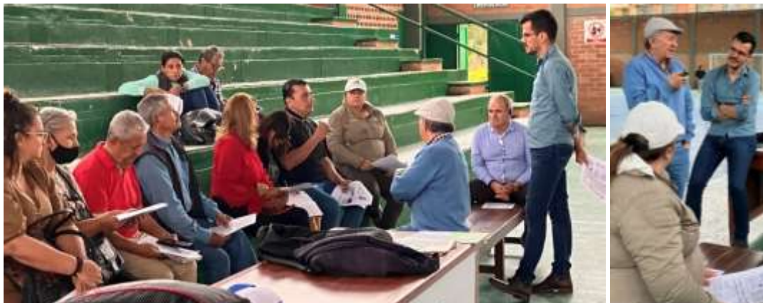
Grupo Focal/discusión con integrantes de la ANUC en el municipio de Fusagasugá, Cundinamarca.

El segundo Grupo Focal se realizó en el corregimiento La Victoria, del municipio El Colegio, Cundinamarca, una región con marcada economía agropecuaria como el anterior pueblo. En esta oportunidad, asistieron 21 integrantes de la asociación registrados en la ANUC, entre los 30 y 75 años, nueve hombres y 12 mujeres de origen campesino, quienes fueron invitados tanto al taller de debate como a definir acciones claves para el futuro de su representatividad en el corregimiento: activar un plan para viabilizar la personería jurídica que les garantice radicar proyectos productivos ante la institucionalidad pública, la