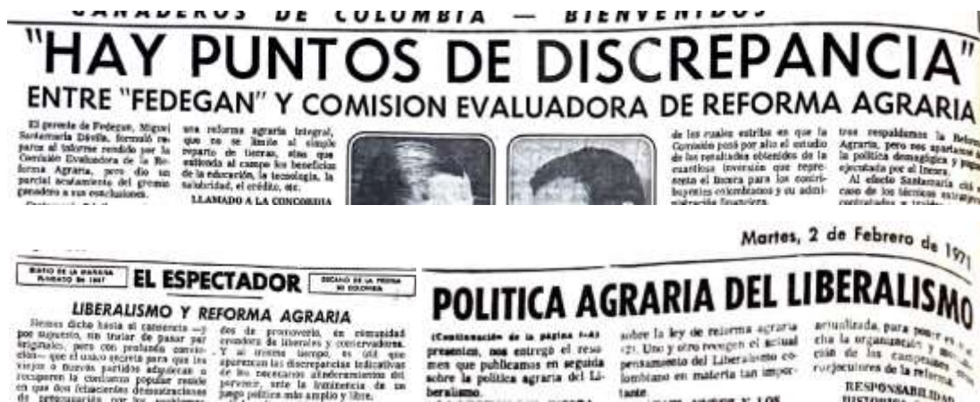
Fuente: EL ESPECTADOR, febrero de 1971.

puso en consideración de los labriegos, por el contrario, estas publicaciones periodísticas invitaban más a agradecer y resaltar la puesta en marcha de la reforma que a replantearla de manera objetiva: "...fue necesario que llegara el gobierno del doctor Carlos Lleras Restrepo con una ideología liberal moderna y actualizada para poner en marcha la organización y movilización de los campesinos como ejecutores de la reforma". Una sentencia que tampoco era tan precisa, pues quienes ejecutaban realmente la reforma era la misma institucionalidad, otra contradicción narrativa.