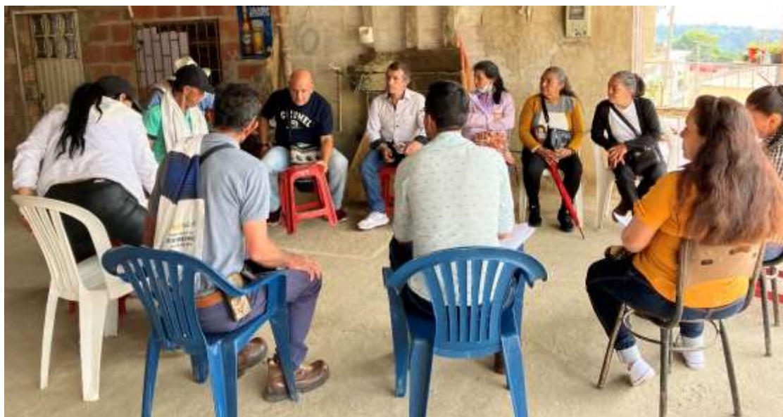
Grupo Focal/discusión con integrantes de la ANUC en el corregimiento La Victoria, municipio El Colegio, Cundinamarca.

Sobre el total de publicaciones periodísticas halladas y analizadas para extraer los puntos de convergencia, se adelantó un proceso de segunda curaduría narrativa para reorganizar los textos, elegir y estructurar un solo documento más corto con los titulares y leads más