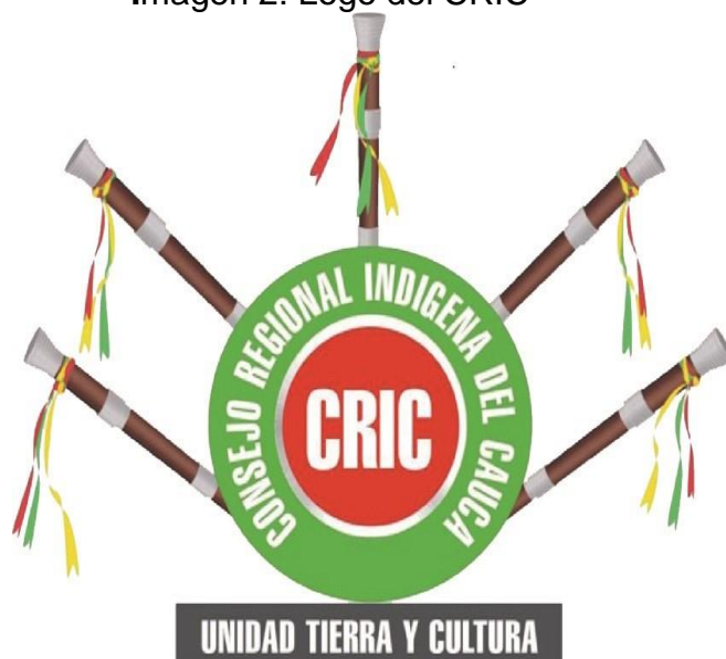
Imagen 2: Logo del CRIC