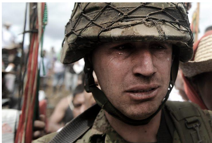
Imagen 6: La agresión indígena que hizo llorar al sargento García

reprocha el empleo, en sus luchas, de acciones y medidas deshumanizantes, como son las degradaciones y humillaciones públicas.