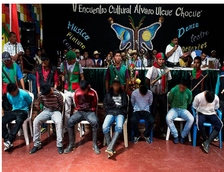
Imagen 8: Santiago Saldarriaga / EL TIEMPO