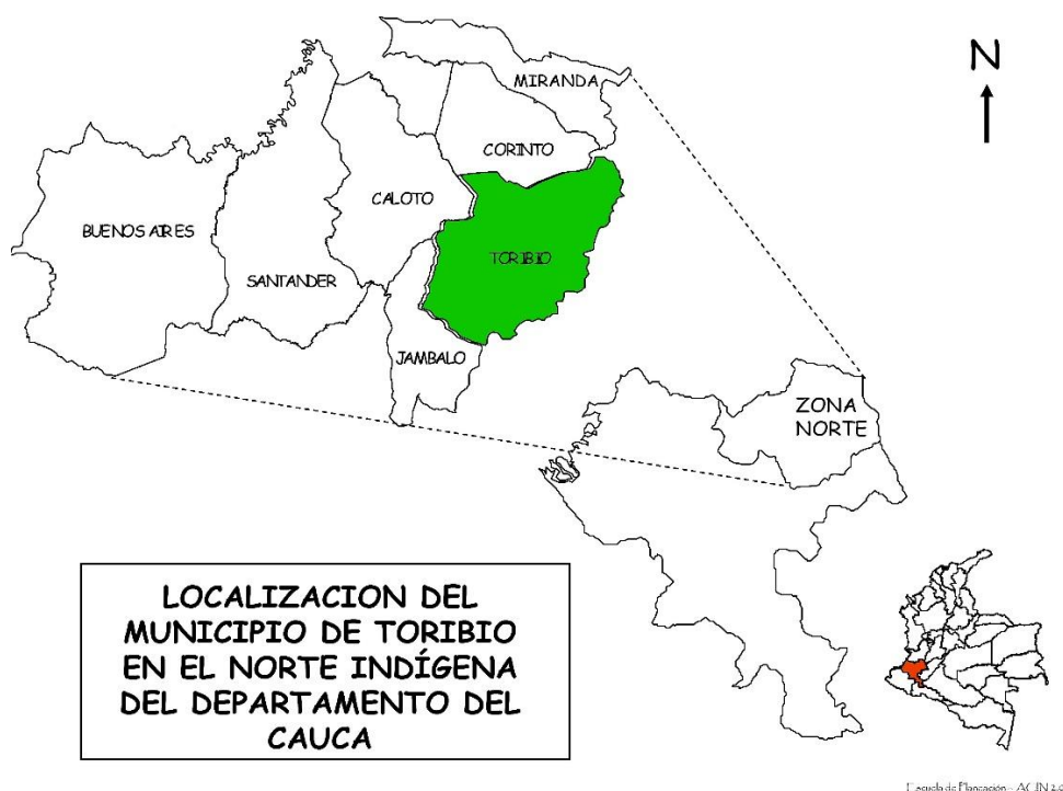
Mapa 1: Ubicación geográfica del Resguardo de Toribio