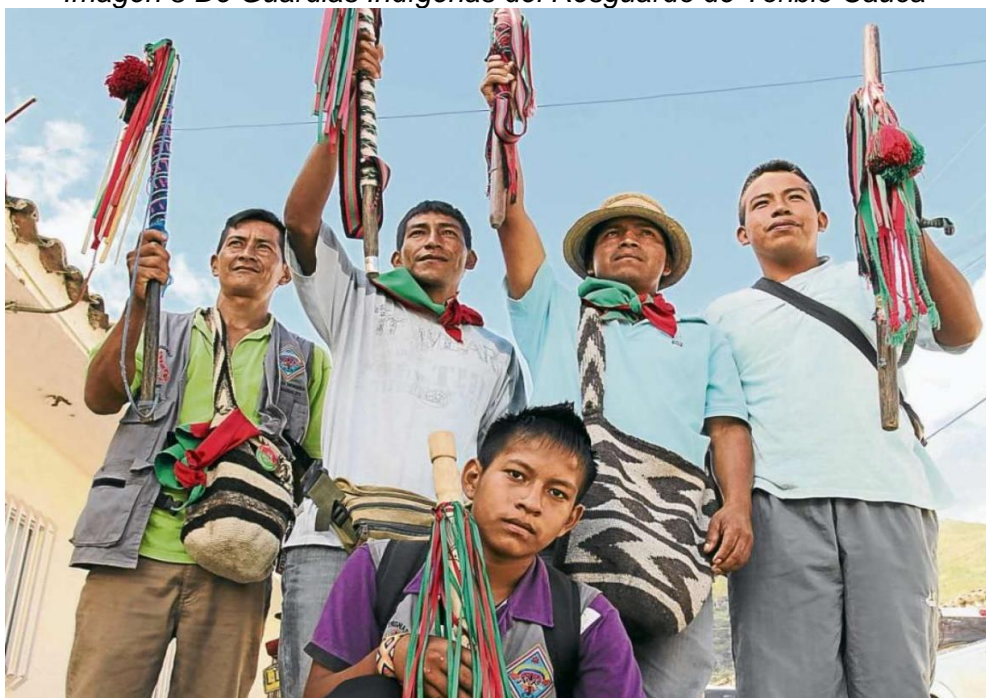
Imagen 3 De Guardias Indígenas del Resguardo de Toribio Cauca