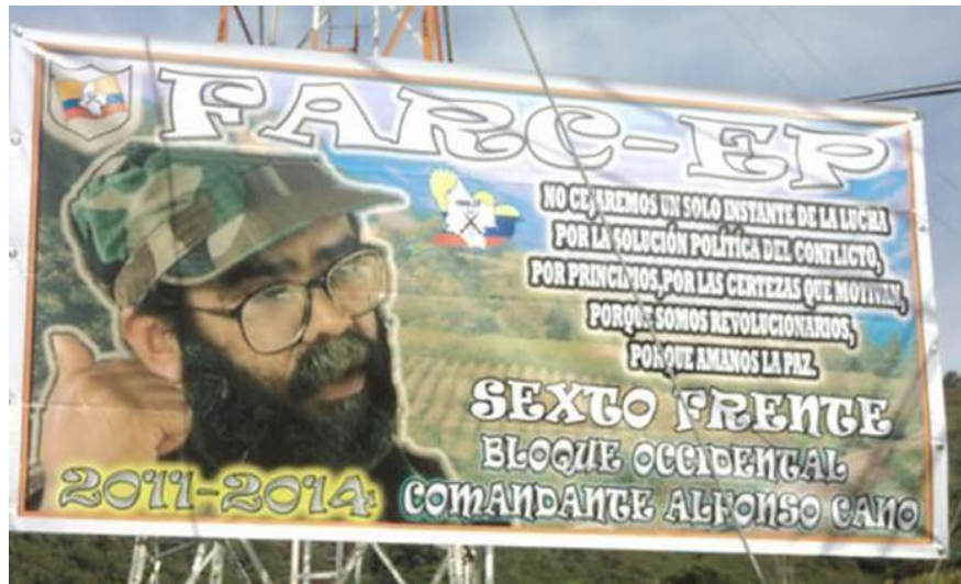
Imagen 7: valla alusiva al segundo aniversario de la muerte de Alfonso Cano