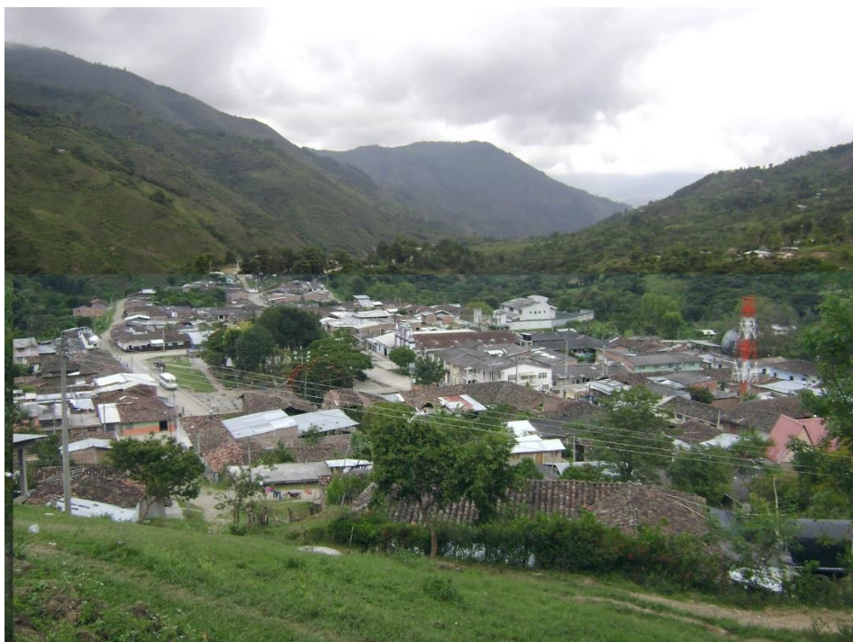
Imagen 1: Ubicación del casco urbano del Resguardo de Toribio