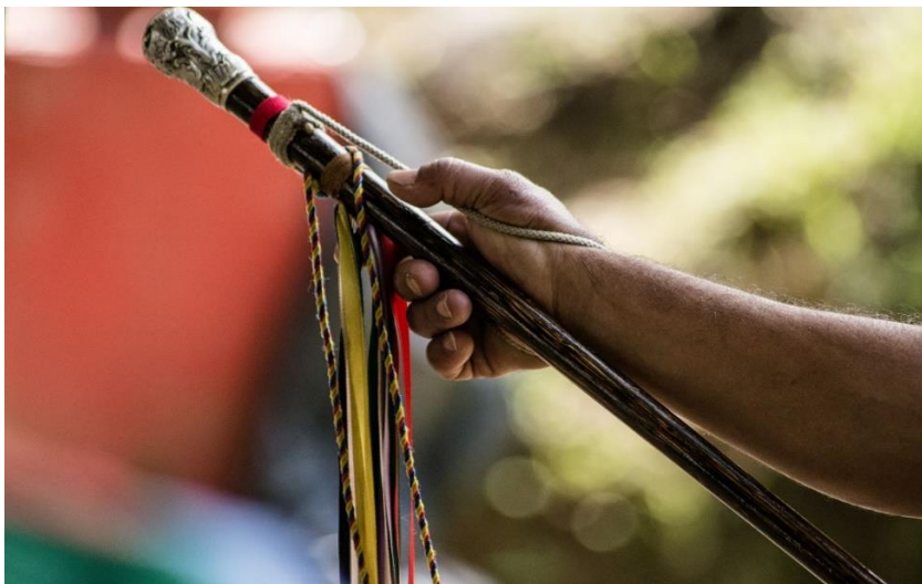
Imagen 4: Bastón de mando de la Guardia Indígena

pensamiento y accionar están en función del fortalecimiento del movimiento indígena Nasa, por lo que su integración presupone siempre el conocimiento de la historia del movimiento indígena y la disposición para el trabajo.