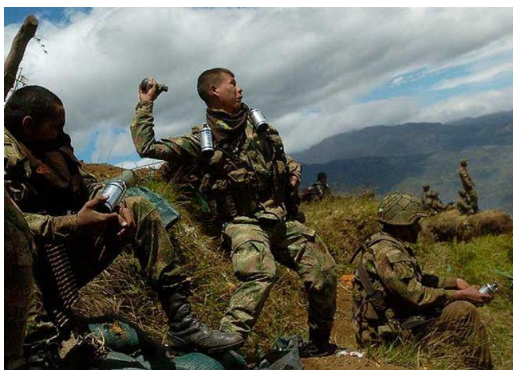
Imagen 5 de la realidad del cerro Berlín

La imagen de un soldado llorando y alzado por indígenas le dio la vuelta al mundo (CRIC, 2012; El Espectador, 2012), aunque para una descripción objetiva de lo ocurrido hubiera sido mejor también mostrar aquellas fotos donde aparecían soldados airados amenazando, apuntando y lanzándoles piedras a los indígenas. Para algunos, en aquella imagen se reflejaba lo loco y lo inaudito de las luchas indígenas, su carácter salvaje y violento. Y para otros, aquel era apenas un reflejo de la determinación indígena en su lucha por la supervivencia.