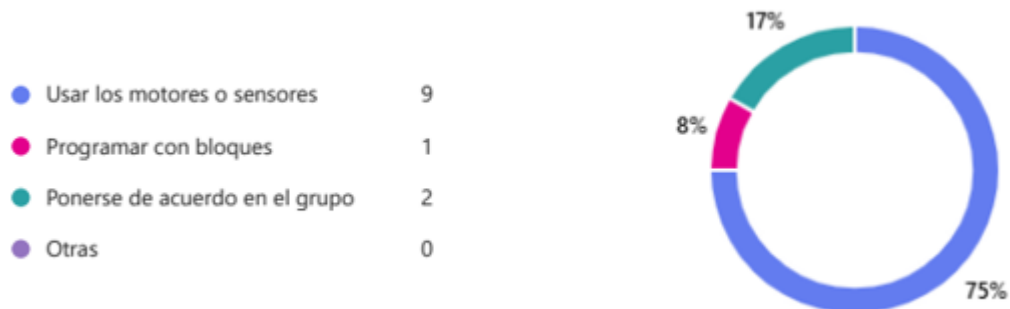
Gráfico 10. Sesión 3. Pregunta 11.

En relación con Brechas tecnológicas , los resultados arrojaron que: