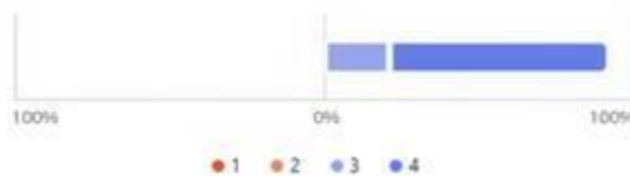
Gráfico 3. Sesión 4, pregunta 3. La retroalimentación de mis compañeros me ayudó a ver qué mejorar en el prototipo.

A su vez, en la categoría de análisis Retroalimentación , se pueden observar los siguientes resultados: