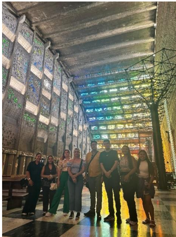
Figura 7 Interior de Iglesia El Rosario

Además, la iglesia alberga un Vía Crucis excepcional, elaborado en hierro negro, una obra artística que resalta por su detalle y profundidad simbólica. Para ingresar a este majestuoso recinto, se exige un código de vestimenta que prohíbe el uso de faldas cortas, camisas sin mangas, bermudas y prendas similares, con el fin de mantener el respeto y la solemnidad del lugar.