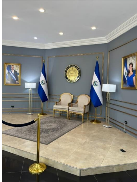
Figura 1 Sala del Aeropuerto Internacional de El Salvador

En la figura 1 se observa el espacio ubicado dentro del Aeropuerto Internacional de El Salvador, en el que resaltan las figuras del Presidente y la primera dama. Observé que es una sala muy fotografiada por los visitantes.