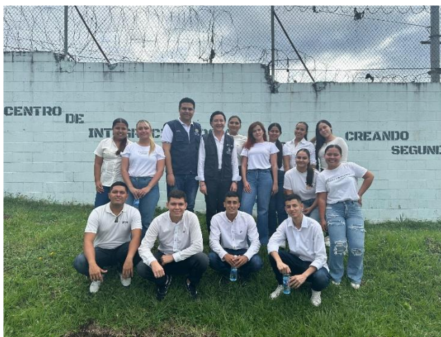
Figura 11 Integrantes de la misión académica en Centro de Integración Social El Espino