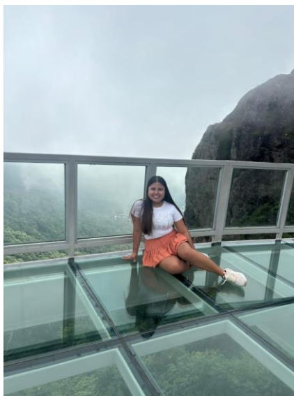
Figura 3 Mirador del Parque Natural La Puerta del Diablo - Panchimalco

El día concluyó con un recorrido nocturno por el centro histórico de San Salvador, donde observamos el palacio nacional y tuvimos la grata sorpresa de encontrarnos en persona con el presidente Nayib Bukele saliendo del Teatro Nacional. La ciudad estaba concurrida y el ambiente en esta zona era muy agradable, pude notar que las personas de todas las edades caminaban con tranquilidad. Se percibía el disfrute del espacio público por parte de los locales.