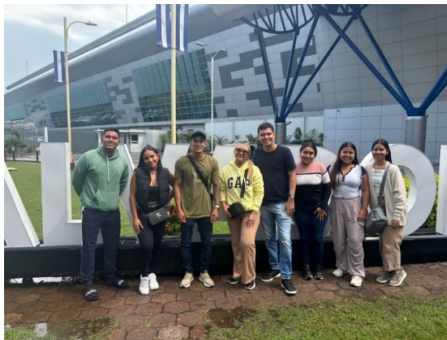
Figura 2 Los integrantes de la misión académica en las áreas externas del Aeropuerto Internacional de El Salvador

En la figura 1 se observa el espacio ubicado dentro del Aeropuerto Internacional de El Salvador, en el que resaltan las figuras del Presidente y la primera dama. Observé que es una sala muy fotografiada por los visitantes.