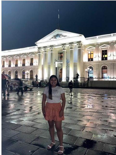
Figura 4 Centro histórico de San Salvador