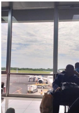
Figura 15 Área de embarque del Aeropuerto Internacional de El Salvador

Si bien, la visita durante 8 días a El Salvador me generó gratas impresiones respecto a la tranquilidad y sensación de seguridad que experimenté, no pude evitar sentir un fuerte contraste con la situación en Colombia en materia de seguridad. Dicho contraste se acentúa con las expresiones de los lugareños con quienes pude interactuar y manifiestan que ahora viven sin miedo, pues el crimen y la violencia en su país ha disminuido significativamente. Al respecto, producto de la reflexión de ambas realidades me surgieron algunas interrogantes: ¿Cómo se puede sentir absoluta seguridad en todos los lugares y a toda hora en El Salvador, país con una cruda historia reciente de violencia? ¿Qué ocurre realmente en Colombia para sentirnos tan vulnerables frente a la delincuencia? ¿Cómo logró El Salvador superar la violencia?