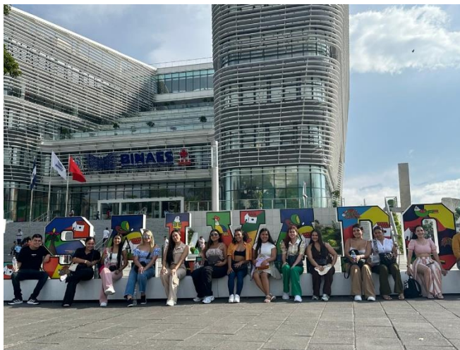
Figura 9 Los integrantes de la misión académica frente a la Biblioteca Nacional de El Salvador

Como mencioné anteriormente, el recorrido por el Centro Histórico fue para mí, una de las experiencias más significativas de la visita a El Salvador por varias razones. En primer lugar, el aprendizaje de un lugar que se adquiere cuando se cuenta con un guía turístico permite que la experiencia trascienda de lo contemplativo a lo cultural. En segundo lugar, las normas establecidas en cada uno de los sitios visitados reflejan un orden y disciplina, que ha sido recurrente en los diferentes sitios que conocimos. Y en tercer lugar, el ambiente de tranquilidad que se percibe en las calles del Centro Histórico (también común en los sitios visitados anteriormente). Aprecié que las personas en general, caminaban con tranquilidad y se siente un disfrute por su entorno. Adicionalmente, se observa gran presencia policial en las calles.