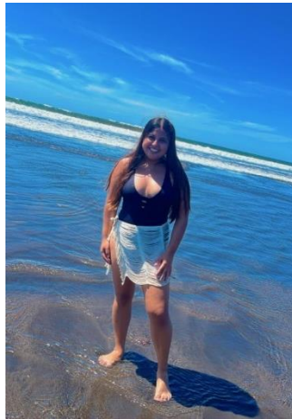
Figura 13 Playa San Blas

Al final del día, la excursión continuó con una visita al pintoresco Sunset Park, que es un parque de atracciones en el que no solo pasamos una tarde de diversión y relajación, sino del disfrute de una vista impresionante del atardecer y un hermoso el paisaje. Fue un día lleno de belleza natural y momentos de esparcimiento en un contexto de tranquilidad, como todos los días anteriores.