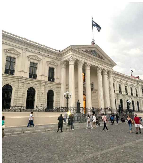
Figura 12 Palacio Nacional de El Salvador

El miércoles visitamos el Palacio Nacional de El Salvador, ubicado en el corazón del centro histórico de San Salvador. Este icónico edificio, donde el presidente toma posesión de su cargo, fue en su momento la sede de los tres Poderes del Estado. Aunque muchos podrían suponer que es la residencia presidencial, actualmente se ha convertido en un atractivo turístico bajo la dirección del Ministerio de la Cultura. Los visitantes tienen la oportunidad de recorrer sus espacios y descubrir la rica historia que guarda entre sus muros.