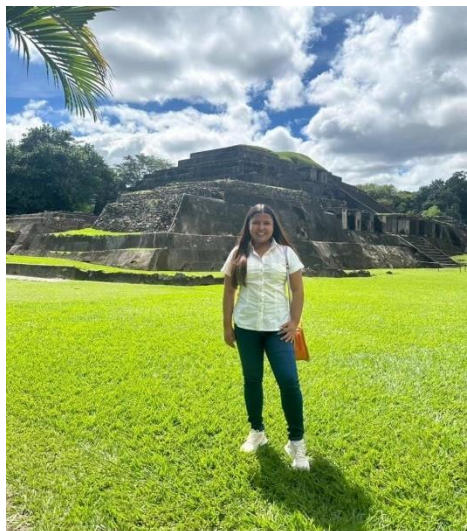
Figura 10 Parque Arqueológico Tazumal

Posteriormente, nos dirigimos al Centro de Integración Social El Espino, centro de reinserción destinado a jóvenes que han formado parte de las pandillas; en los cuales, a través de la disciplina y la enseñanza de oficios útiles para la vida, se busca rehabilitarlos y reivindicar su condición humana, tan seriamente afectadas por la participación en acciones delictivas.