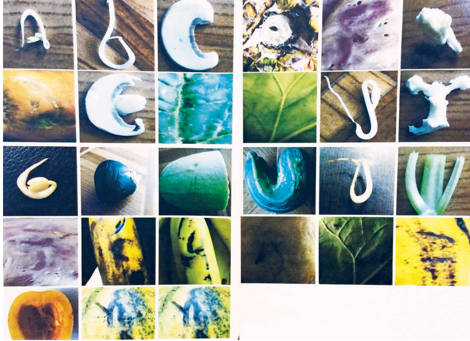
Figura 1. Sistema alfabético en arquitectura, 2016.