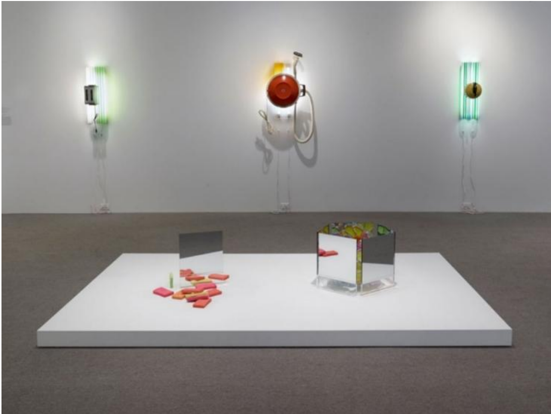
Autor: Jeff Koons Título original: "Pre- New" Museo: Almine Rech Galery Técnica: Escultura (Original perdido) Año: 1979

Este artista no solo estudió el arte de Duchamp, también revisó el de otros creadores como Ed Paschke otro estadounidense que se enfocaba en la pintura, pero con un estilo muy peculiar debido a que involucraba muchos colores, objetos y formas que hacían pensar en la esencia que ahí se refleja y que puede llegar a ser poco agraciada por la mayoría, debido a que rompe con esa idea de arte tradicional. Por otro lado, en la parte que involucra los objetos otro artista que lo inspiró fue Donald Judd quien usaba objetos como cajones, gavetas y hasta incluso cajas de madera y los ubicaba de una forma estratégica dando la ilusión de una repetición del elemento