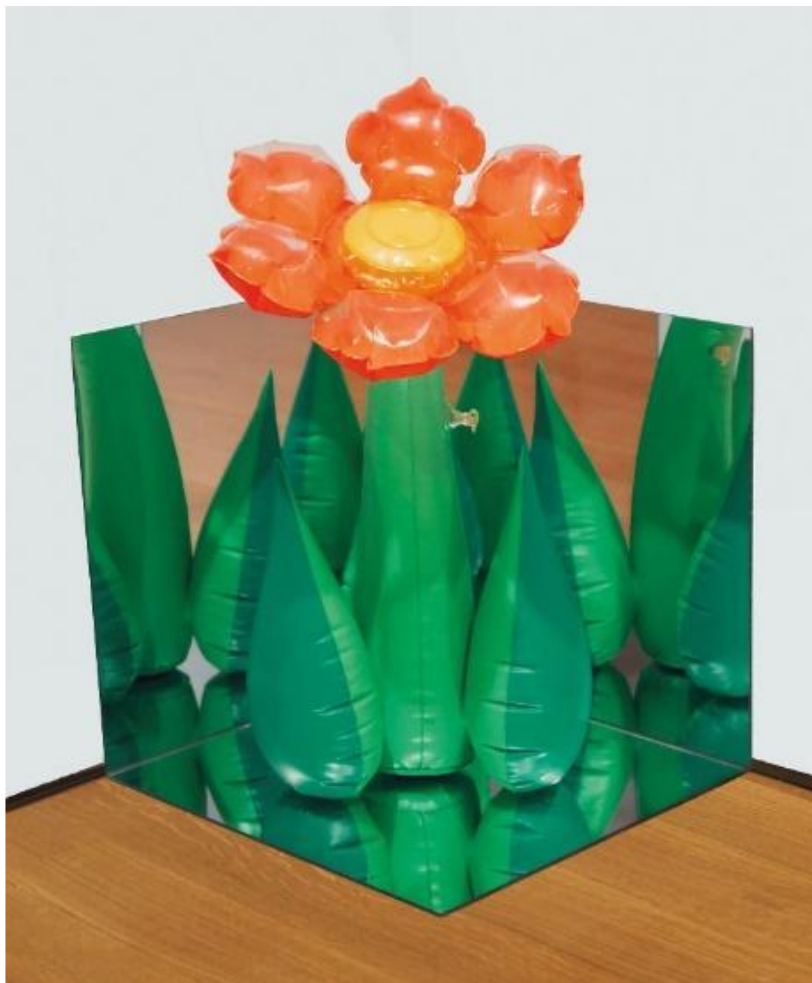
Autor: Jeff Koons Título original: "Inflatables" Museo: Tienda de arte Christie's Técnica: Escultura (48,9 x 43,2 x 43,2 cm.) (Original perdido) Año: 1955