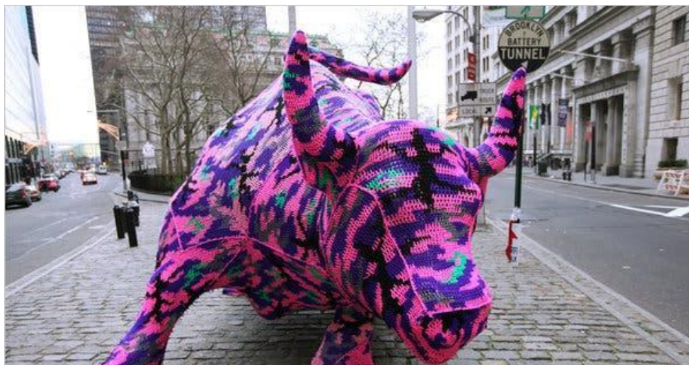
Autor: Yarn Bombing Título original: "s.t." Técnica: Escultura (Original perdido) Año: 2005