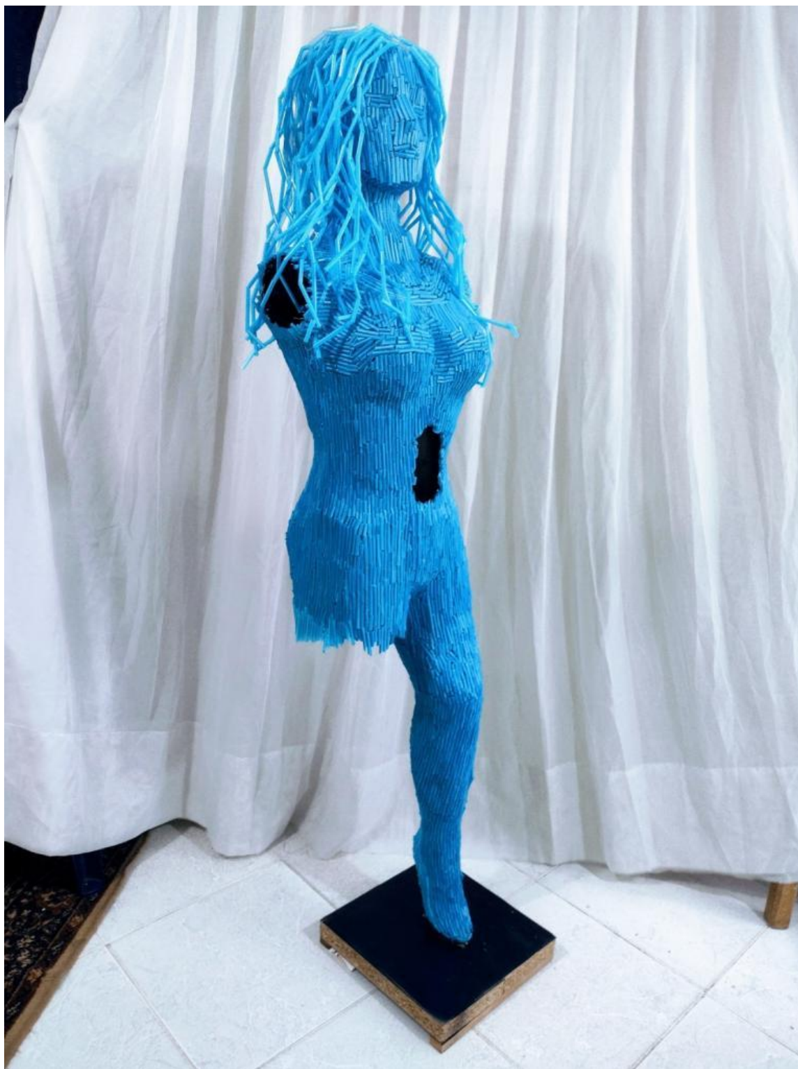
Autor: Angie Almanza Título original: "Renacer" Técnica: Escultura (Obra original) Año: 2023