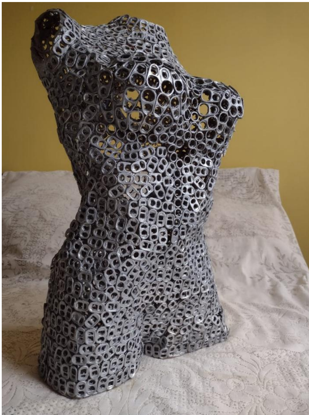
Autor: Angie Almanza Título original: Heridas profundas Técnica: Escultura (Obra original) Año: 2023