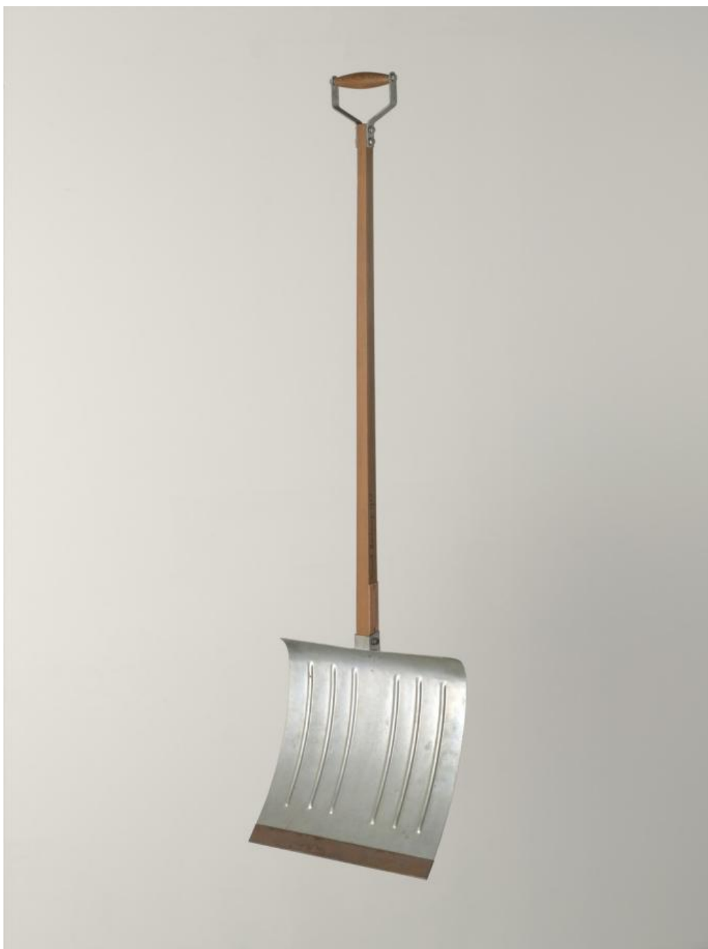
Autor: Marcel Duchamp Título original: In Advance of the broken arm Museo: Galería de arte de la Universidad de Yale (Estados Unidos) Técnica: Escultura (52 x 132 cm.) (Original perdido) Año: 1915