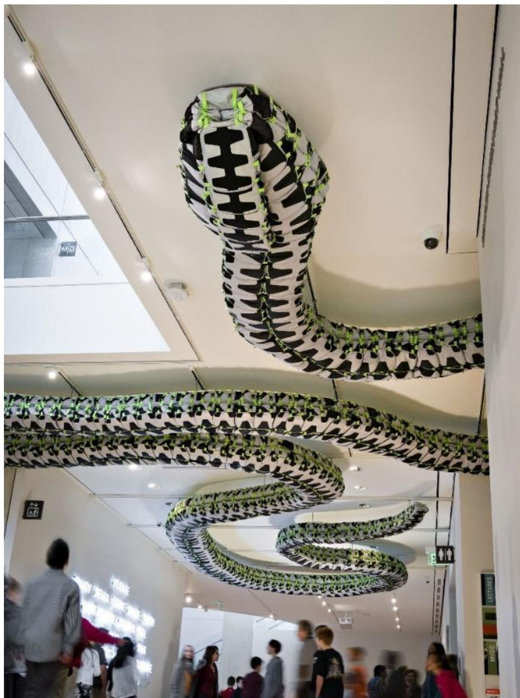
Autor: Ai Weiwei Título original: "Snake Ceiling" Técnica: Escultura (Original perdido) Año: 2009