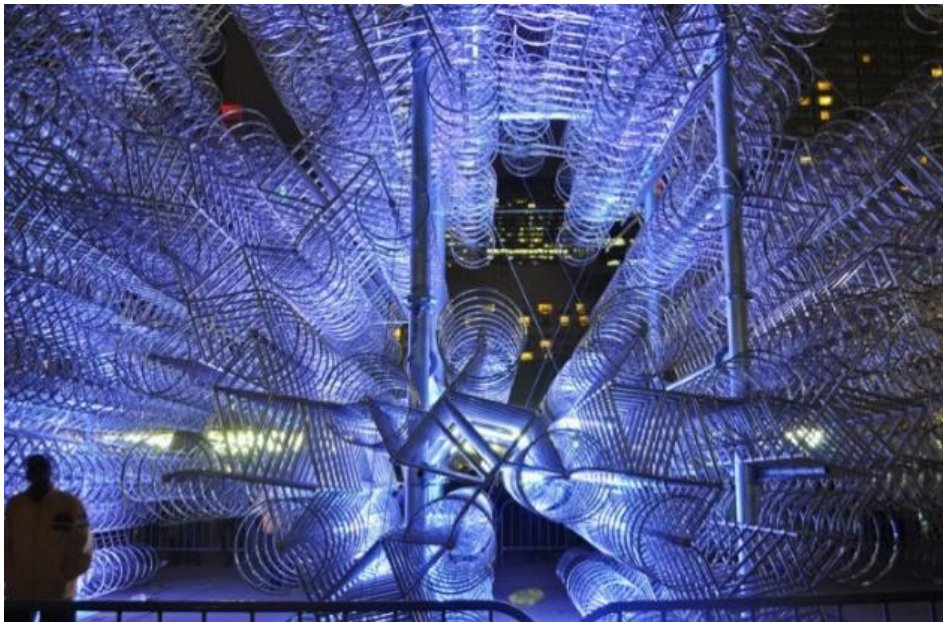
Autor: Ai Weiwei Título original: "Forever Bicycles" Técnica: Escultura (Original perdido) Año: 2003