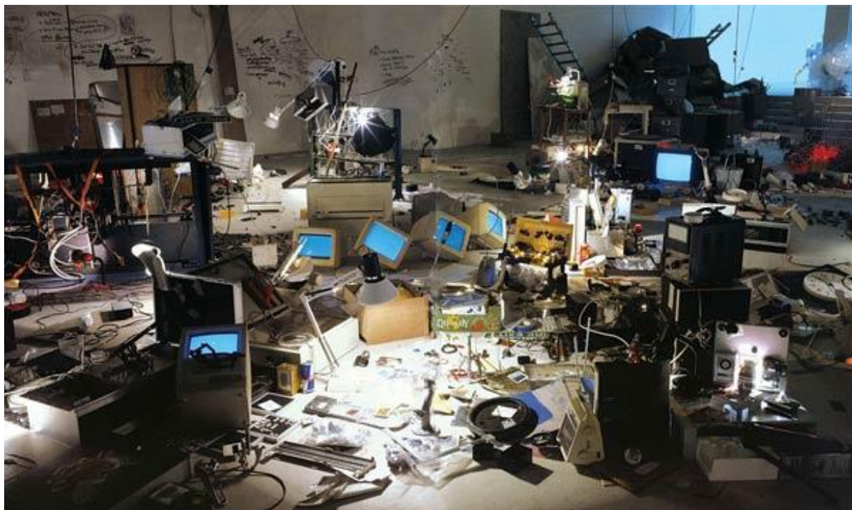
Autor: Tomoko Takahashi Título original: "IDIS" Técnica: Escultura (Original perdido) Año: 2000