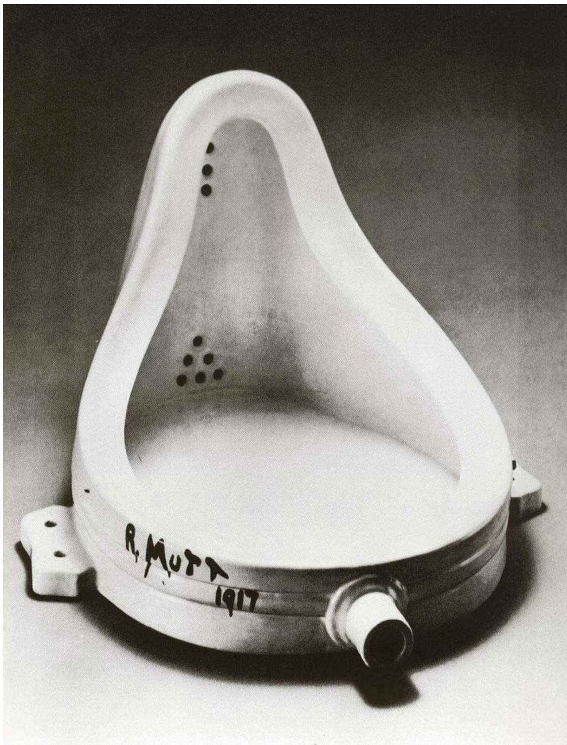
Autor: R. Mutt (seudónimo utilizado por Marcel Duchamp) Título original: Fontaine Museo: Tate Modern, Londres (Reino Unido) Técnica: Escultura (63 × 48 × 35 cm.) (Original perdido) Año: 1917