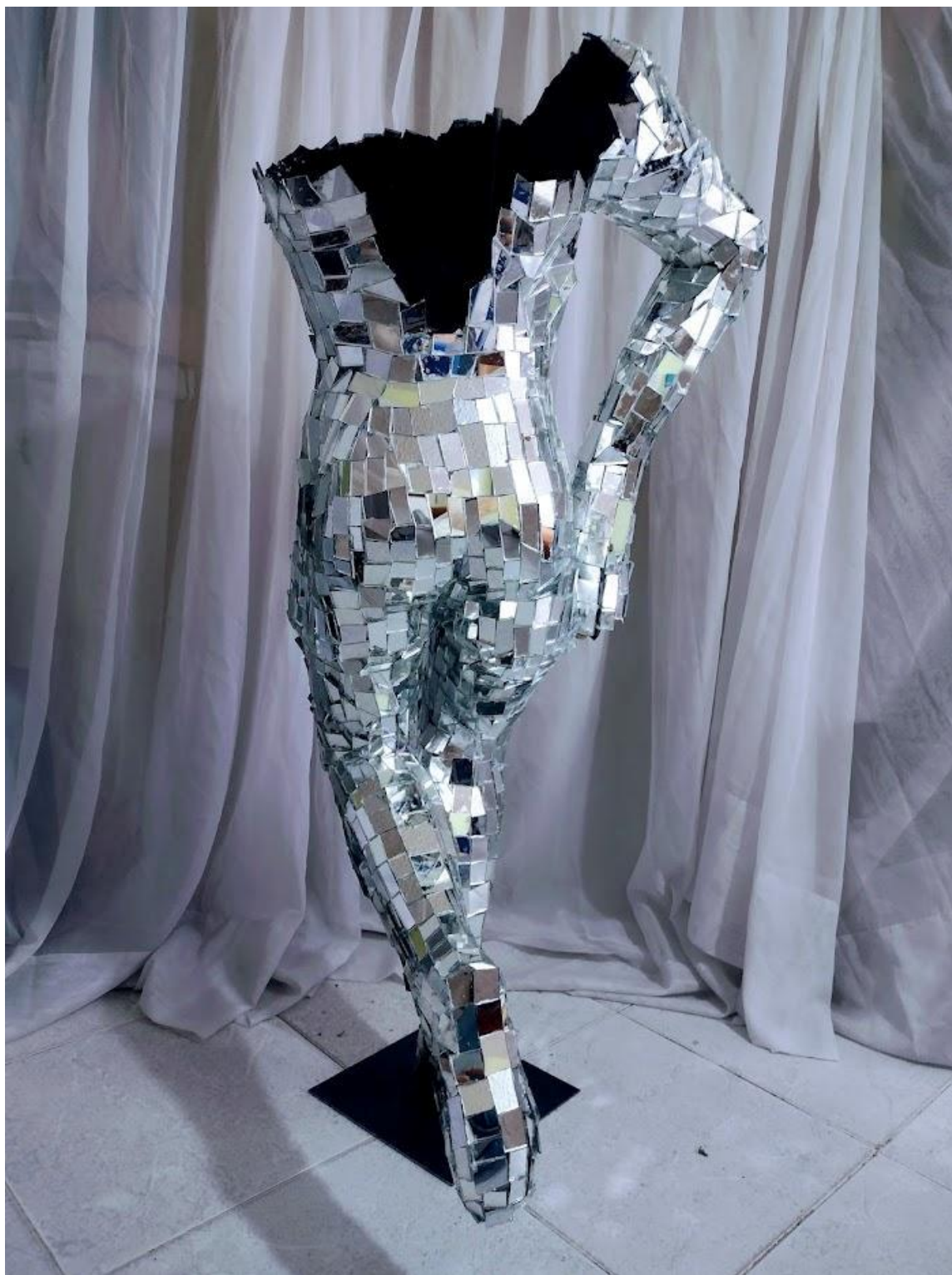
Autor: Angie Almanza Título original: "Al mirar" Técnica: Escultura (Obra original) Año: 2023