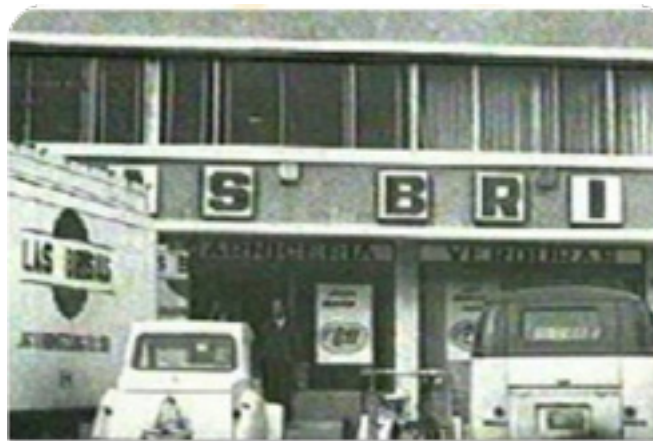
Autoservicio “Las Brisas” – Temuco

Otorgar el mejor servicio a nuestros clientes.