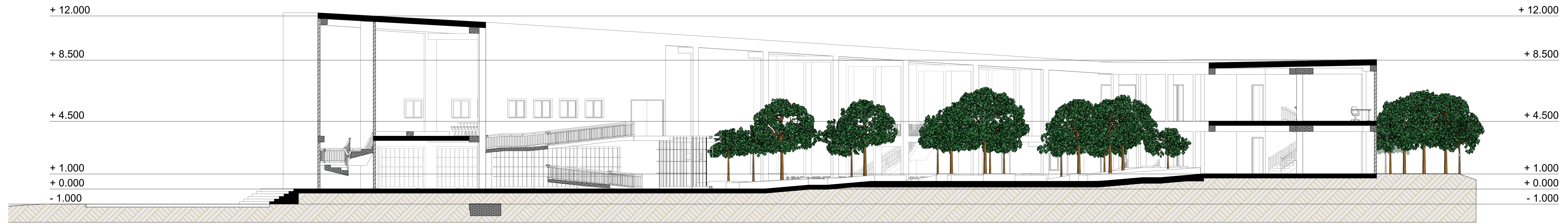
SECCIÓN A - A' ESC: 1:125