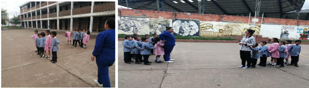
Los niños manejan su equilibrio por medio de huellas.

Durante la actividad 3 y la actividad 4 (Diario N°3, Anexo N° 9 y Diario N°4, Anexo N° 10), donde se refleja estrategias didácticas como el Huellero en el cual sigue instrucciones y fortalecen la concentración y asimismo la carrera de parejas manejada como carretilla en donde se trabaja su lateralidad y equilibrio utilizando todas las partes de su cuerpo, experimentando y realizando dinámicas nuevas que le permitieron acercarse mucho más a su autonomía y trabajo en equipo. El juego bien planificado en función de los conocimientos que el niño o la niña debe adquirir a través de su edad, de su ritmo y estilo de aprendizaje, teniendo en cuenta las necesidades significativas que se viven en el aula de clase a través de actividades lúdicas aprovechando el tiempo libre, integrando así los contenidos o actividades planteados por la docente.