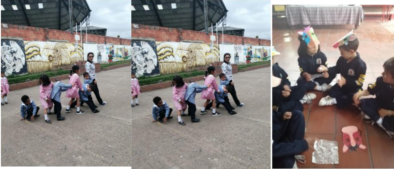
La docente juega con los niños al apretujón