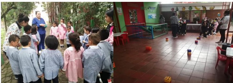
Se trabajan carreras de obstáculos.