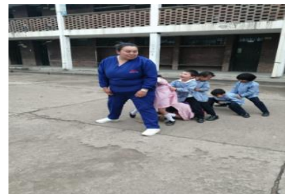
Se trabaja el equilibrio y coordinación.