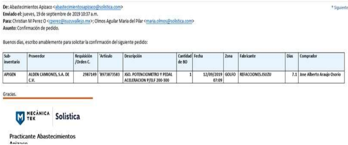
Imagen 4. Ejemplo de falencias en los procesos, Tomado de los archivos del área de compras de FEMSA, 2019

Referente a los procesos es alentador evidenciar que la empresa en general ha mejorado, y más aún en cuanto a los procesos que están relacionados con el departamento de compras. Como se mencionó, este avance en los procesos se debe en gran parte a la auditoría realizada, no es favorable que la empresa conozca la fecha de dicha revisión, ya que previo a ella intentan tener todo lo que debió hacerse en determinados meses, por ello sería favorable que esto sea en fecha sorpresa. Pero se reconoce que mejoro. Antes de dichas auditorias se evidenciaban bastantes irregularidades.