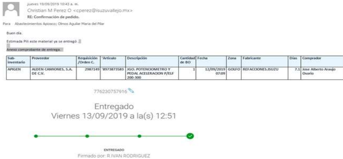
Imagen 5. Ejemplo de falencias en los procesos, Tomado de los archivos del área de compras de FEMSA, 2019

El departamento de compras aproximadamente cada semana debe descargar un reporte del sistema que expone información acerca de las compras, es decir, el proveedor, el artículo y su código, el número de la orden de compra, la fecha en la cual se creó esa orden y la cantidad de días que lleva desde que se realizó el pedido; en cuanto llega la mercancía al almacén, el personal debe ingresar al sistema y registrarla.