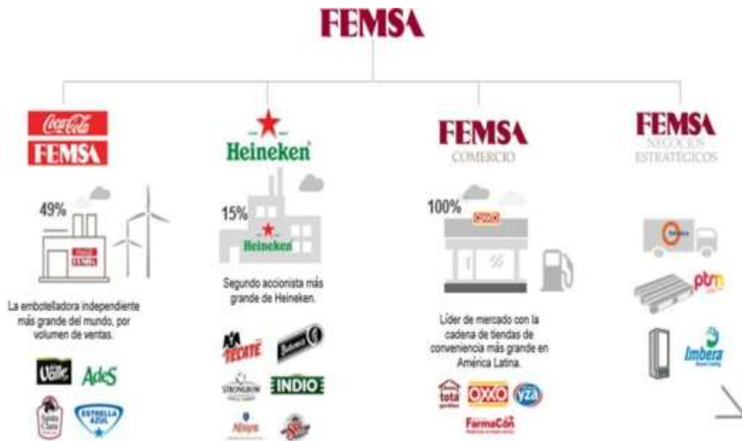
Imagen 1. Estructura Corporativa. Adaptado de Femsa, 2019.

En la imagen anterior se identifica las cuatro unidades de negocio que hacen parte de FEMSA, en la última unidad se encuentra Solística, y allí se ubica Mecánica Tek. Por ende, se puede apreciar la magnitud de esta empresa, como a lo largo de los años ha ido en aumento y se ha convertido en una de las mejores en Logística.