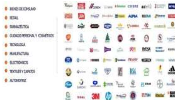
Imagen 3. Portafolio de clientes. Adaptado de Femsa, 2019