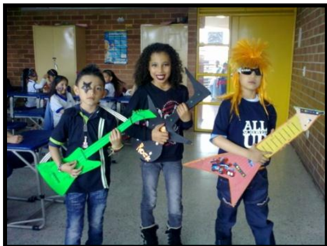
Representación de Roles en la aplicación de la lúdica pedagógica