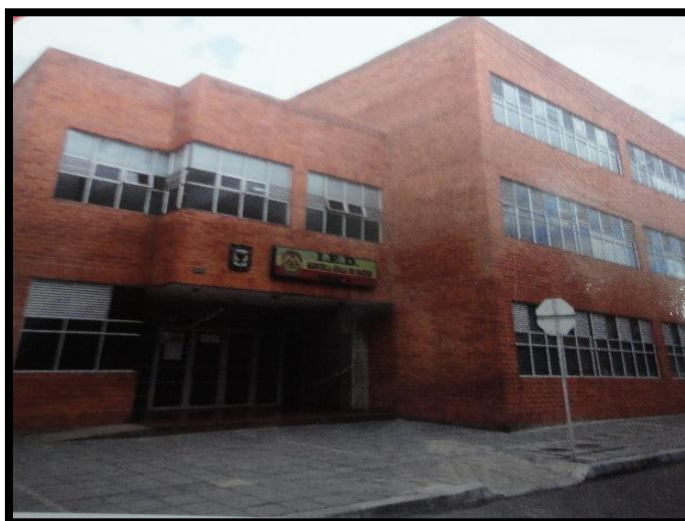
Fachada IED. Manuela Ayala de Gaitán. Sede B

Con la autorización de la directiva, se da acceso a una parte inicial del Proyecto Educativo Institucional, que aún se encuentra inconcluso. La coordinación con los docentes de la institución, permite organizar su historia, al igual que se hace un mejoramiento al plan de estudio y una actualización del Manual de Convivencia 2013-2014. Se retoma la información para poder dar a conocer parte de la historia de la Institución.