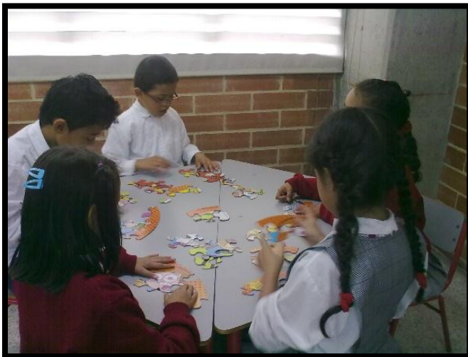
Lógica en la construcción de palabras

La enseñanza es entendida como la forma de generar ambientes para el aprendizaje en donde el docente utiliza una gran variedad de técnicas y estrategias para que el niño a través de su propio conocimiento explore y obtenga una nueva experiencia de aprendizaje. Con respecto al esquema de la enseñanza Aguilar, (1991) retoma algunas ideas de Vygotsky y Bruner referente a las nociones de las zonas de desarrollo, andamiaje y transferencia del control y la responsabilidad. Con relación a la enseñanza, el docente debe ser una guía para sus estudiantes, encargado de dar a conocer pasos importantes como es la presentación de las estrategias. La