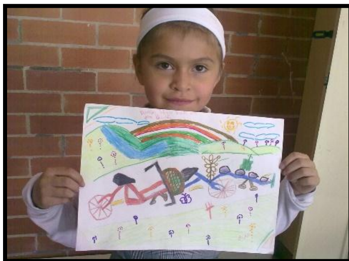
Lectura Grafica

El aprendizaje es la adquisición de conocimientos necesarios para adquirir habilidades, destrezas, valores y actitudes que llevado al ejercicio de la experiencia contribuye al desarrollo humano. En relación con la lúdica, es entendida como un instrumento o una herramienta, que se