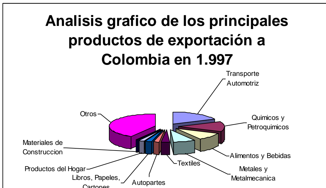
GRAFICO Nº 2