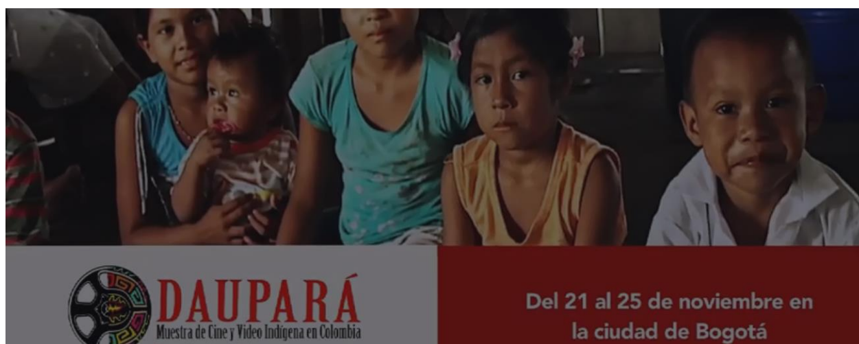
Daupará 2017