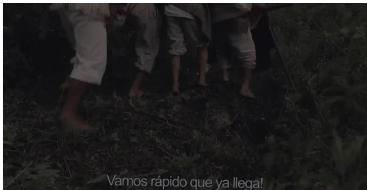
Daupará 2017

Jueves 23 de noviembre de 2017 - dialogo con el público Alianza Francesa