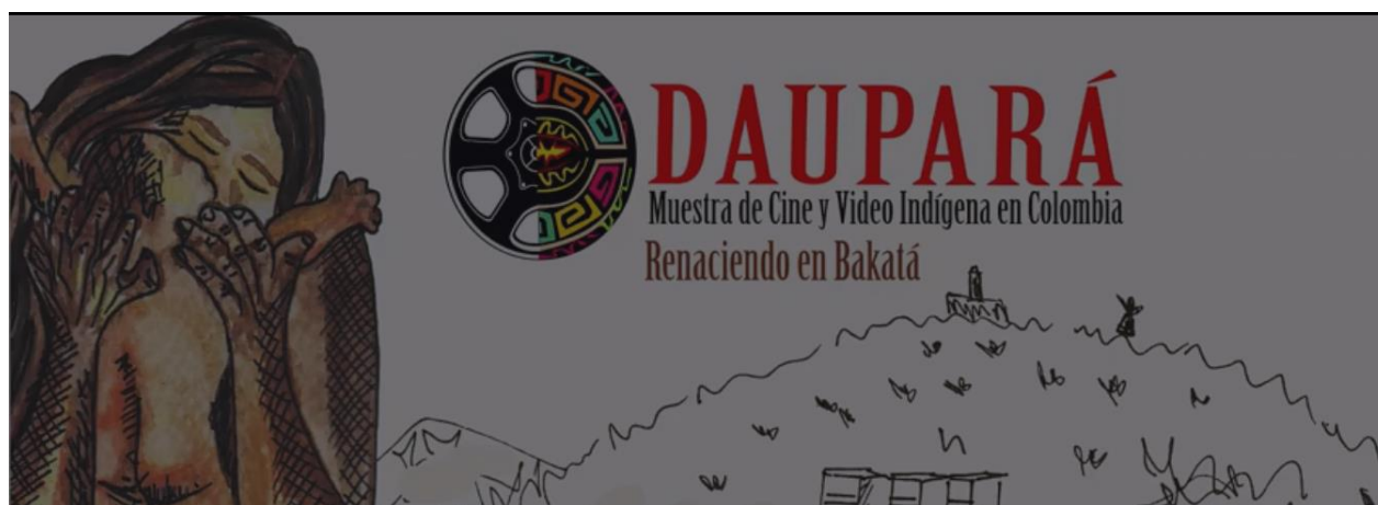
Daupará 2017

A lo largo de las actividades y proyecciones audiovisuales fílmicas y cinematográficas que se presentaron en la muestra empiezo a comprender y analizar cómo las piezas audiovisuales presentadas en la muestra de cine y video indígena Daupará 2017 aportan a la construcción de etnoeducación en los pueblos indígenas, de la misma manera examino como la noción de memoria es representada en las piezas audiovisuales presentadas en la muestra e indago de qué manera se aborda el concepto de territorio en la muestra de cine y video indígena Daupará 2017. Abordando estas preguntas e inquietudes que me invaden en mi rol de investigadora respecto a la muestra opto por realizar fotografías y pequeños videos del proceso que se llevó a cabo en la muestra con el objetivo de ir contestando aquellas interpelaciones. A continuación, evidenciaré algunas piezas.