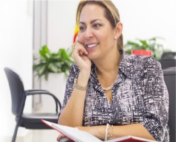
Imagen 1 Gobernadora del Meta, pagina web de la Gobernación del Meta 2016, Adaptado. (Gobernación del Meta, 2019)

Nuestra Gobernadora Marcela Amaya García