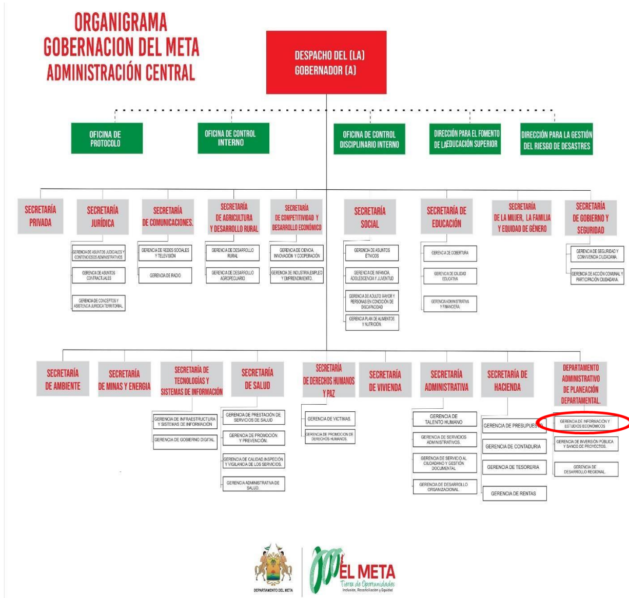
Imagen 4. Organigrama funcional de la Gobernación del Meta, Adaptado. (Gobernación del Meta, 2019)

Nota: El círculo rojo indica el área donde se realizaron las prácticas profesionales.