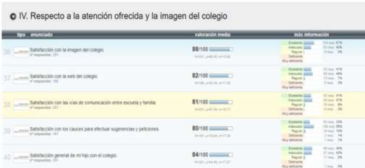
Resultados encuesta satisfacción familias