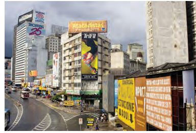
Figura 17. El caso de la ciudad de Sao Paulo.

si el inmueble supera los 10 metros de frente, puede tener avisos de hasta 4 metros cuadrados pero sin exceder los 5 metros de alto. Avisos grandes, para inmuebles que superen los 100 metros de frente podrán optar a dos avisos publicitarios de 10 metros cuadrados cada uno. A quienes no respeten la normativa propuesta en Ciudad Limpia, se les multará con 5.500 dólares, más 550 por metro cuadrado excedente. (Méndez, 19 de noviembre de 2008, s. p.)