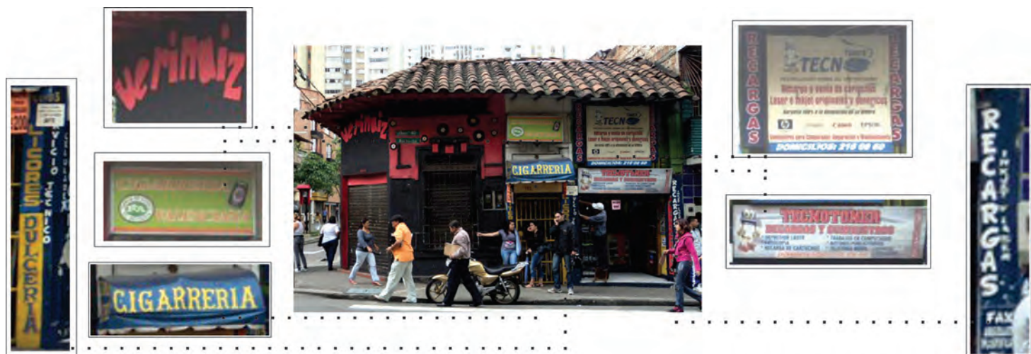
Figura 22. Despiece en los detalles gráficos de fachadas en el tramo 2.

En medio de estas dos formas gráficas encontramos intervenciones que tienen un poco de uno y otro extremo a la vez, lo que hace que se inserten en el ámbito del arte urbano; aunque también hay mezclas en las formas mismas de intervención comercial que emplea dispositivos grafiteros, así como de grafica artesanal o popular para decorar.