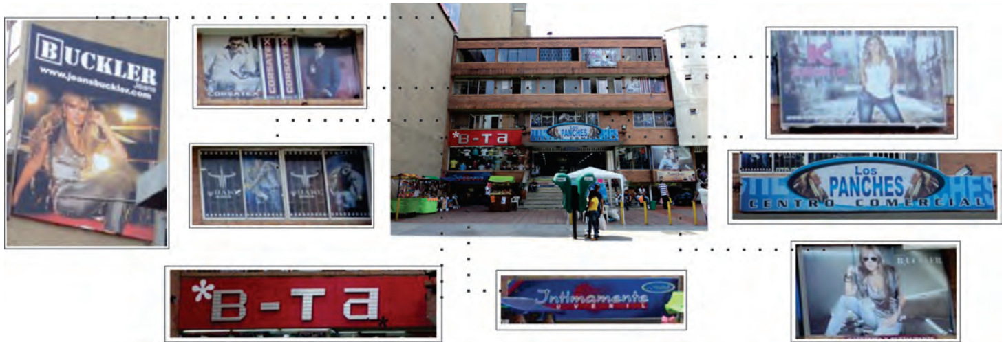
Figura 20. Tramo 1 de la calle Ayacucho: despiece de detalles gráficos de fachadas.

Este tramo atraviesa el centro de la ciudad; en este el mayor porcentaje de las grafías van en correspondencia con su actividad comercial, que muestran cómo los artificios comerciales y publicitarios se instalan prácticamente en la totalidad del tramo