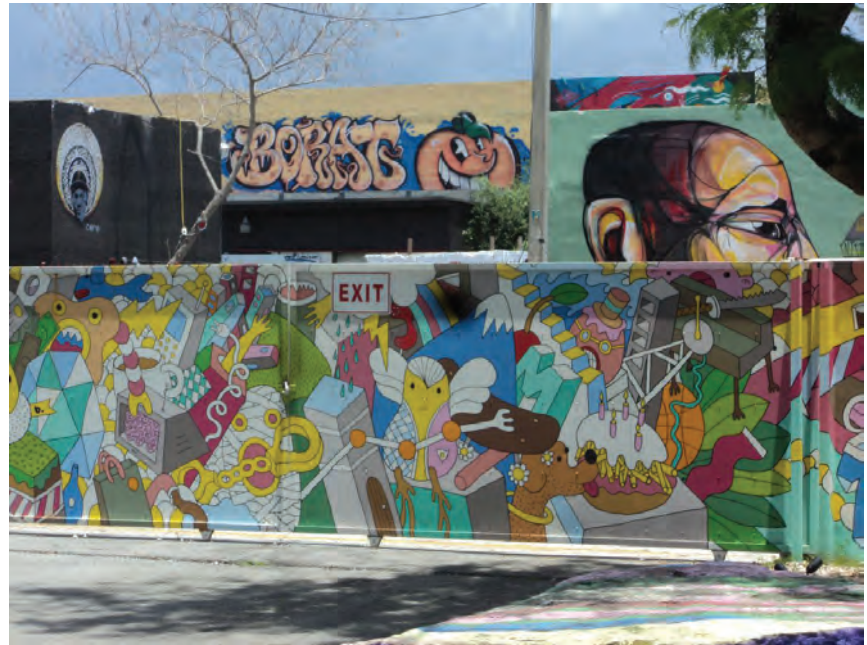
Figura 14. Wynwood, Miami. 2014.

En el contexto latinoamericano nos encontramos las manifestaciones gráficas en Santiago de Chile, las cuales son particularmente interesantes por haber recorrido un camino de reivindicaciones frente a la dictadura militar o las demandas de las minorías étnicas. Este tipo de expresión comienza a mediados de la década de los ochenta y principios de los noventa, cuando es criminalizado, condenado y perseguido por la policía sin gozar de ningún prestigio, pero ejecutado por varios actores sociales, en su mayoría jóvenes