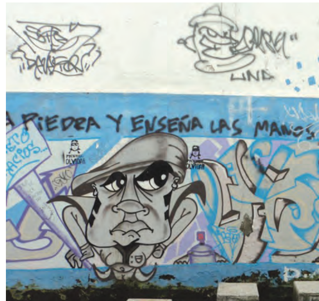
Figura 10. Grafiti en el denominado Bulevar 40, Carrera 40 con Ayacucho.

Las acciones cometidas sobre los vagones el metro de Nueva York fueron las que llevaron a los grafiteros de la década de los setenta a alcanzar la fama internacional ya que “la concurrencia de público y la dimensión escenográfica y hasta espectacular del metropolitano —que en Nueva York es subterráneo y aéreo—