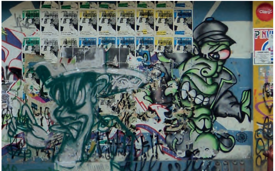
Figura 25. Graffias superpuestas, Medellín 2013.

Lo que nos queda es que en su conjunto, todas esas prácticas hacen que el paisaje urbano resultante sea asimilado como una entidad mutable, que cambia con el tiempo y con las particularidades del contexto. ¿Es tal vez un proceso de colonización espacial de las expresiones gráficas?