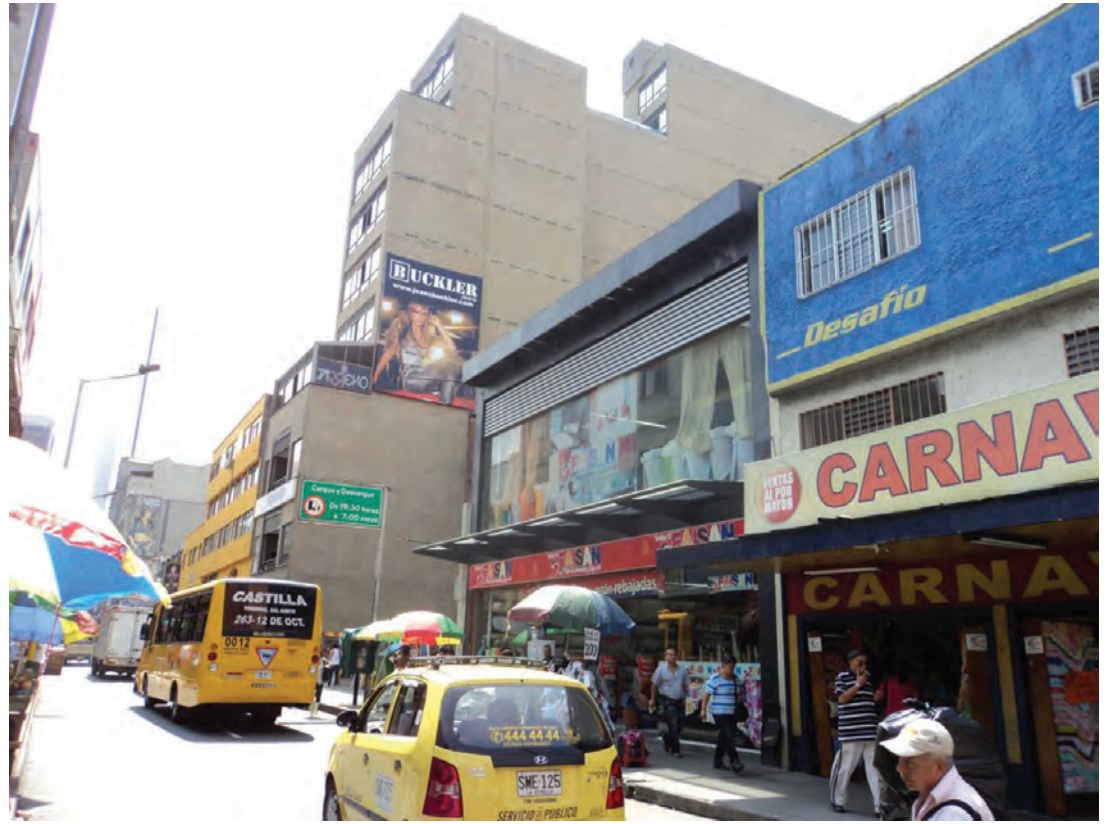
Figura 2. Ayacucho, centro de Medellín.

Para el interés de la investigación, ha sido importante la construcción de una “imagen actual” del contexto por estudiar, iniciado en 2010 y concluido en 2015; sin embargo, sabiendo que las dinámicas sociales hacen que ese mismo espacio cambie con el paso del tiempo, la investigación invita a retornar a los espacios previamente registrados para observar esos cambios que vayan aconteciendo mientras el proceso de investigación perdure. Aún hoy, ese mismo espacio está transformándose debido a la implementación del sistema masivo de transporte tipo tranvía, que utiliza un trayecto de la calle Ayacucho como su eje principal.