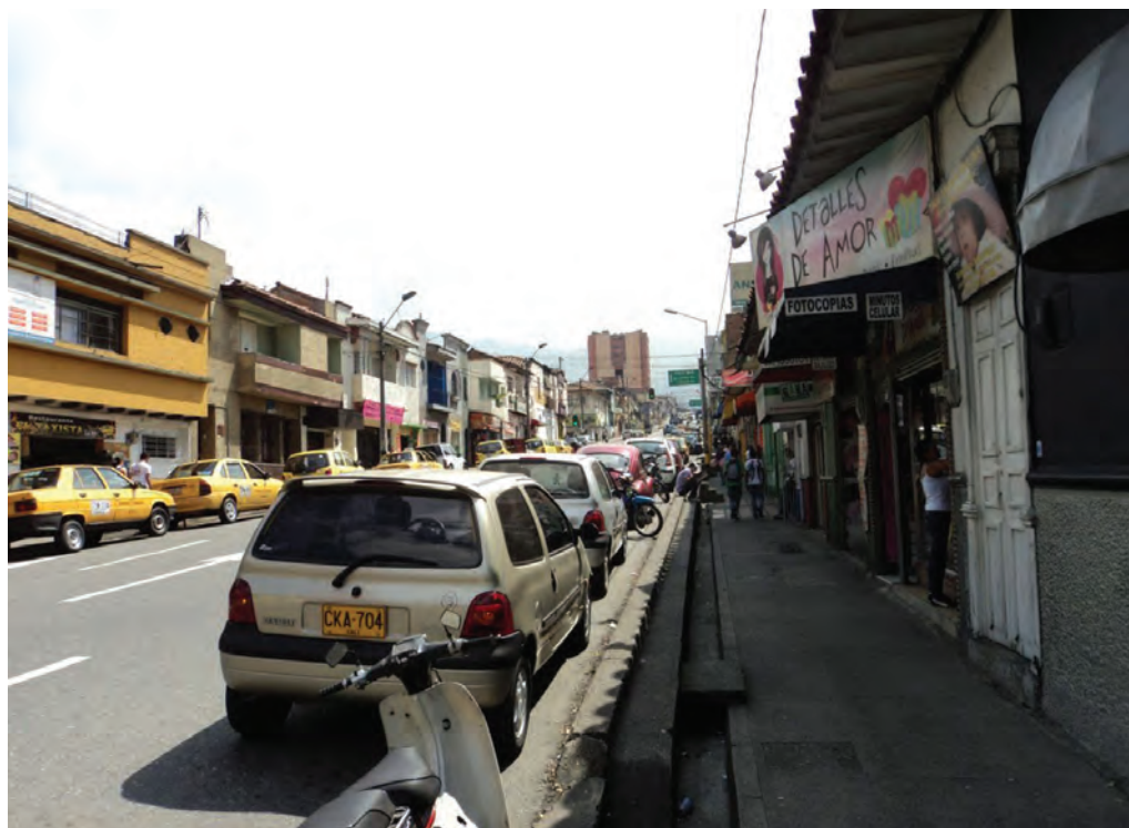
Figura 3. Ayacucho a su paso por el barrio Boston.

Tendríamos entonces la idea de un espacio público como un escenario neutro, como construcción material de una sociedad. En este sentido, seguimos las pautas de Setha M. Low (2002), para quien el conjunto de procesos artísticos, económicos, políticos y tecnológicos que lo materializan, en cuanto artefacto urbanístico, termina por concretarlo en un procedimiento que define como producción social del espacio (Low, 2002, p. 112).