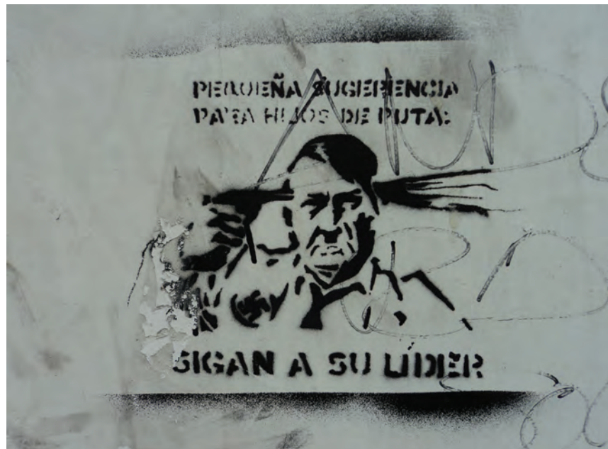
Figura 11 y Figura 12. Pintadas y esténcil sobre local comercial en Ayacucho.

De esta manera, se asiste a otra etapa en el desarrollo de una estética urbana marcada por la proliferación de las expresiones sociales que coquetean, se marginan, se acercan y se desmarcan del mundo del arte, del marketing y de la publicidad. Con su presencia y accionar contribuyen a repensar la variedad de relaciones entre las personas en el espacio público, así como entre ellas y el espacio mismo, incidiendo en la construcción de un paisaje netamente urbano, un escenario híbrido, mestizo