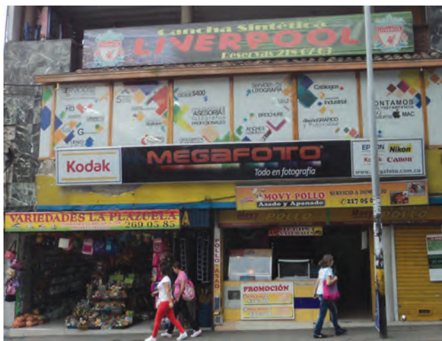
Figura 9. Publicidad en Ayacucho con Carrera 44.

Es esta una idea corroborada por Canales Hidalgo, quien ubica el surgimiento de la publicidad comercial moderna dentro del contexto de las revoluciones burguesas de los siglos XVIII y XIX, donde “esta íntima filiación entre el entorno urbano y la publicidad, la convierte en un fenómeno de comunicación; comunicación pagada en los mass media mediante mensajes, con la finalidad de conseguir, casi siempre, una venta» (Canales Hidalgo, 2006, p. 36). Canales Hidalgo define entonces la publicidad como una “potente arma que sirve para perpetuar el poder social y político [...], ora de manera sutil, ora de manera zafia, parece subrayar una preocupación obsesiva por el orden (integración) y el control (socialización) en las sociedades neocapitalistas” (p. 95).