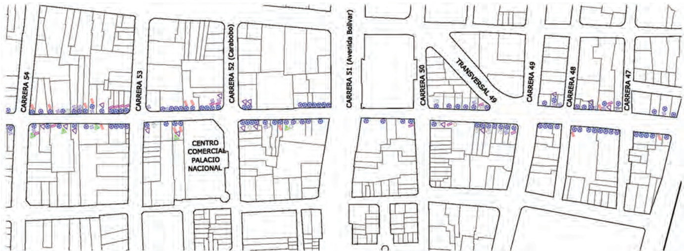
Figura 19b. Plano del tramo 1: Distribución según tipos de grafías.