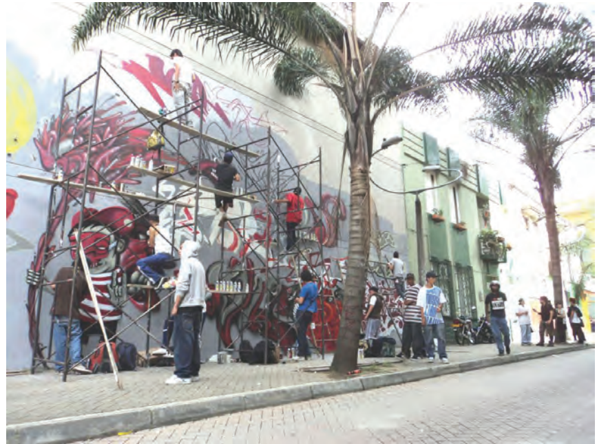
Figura 4. Intervención colectiva de grafiti. Medellín, 2011.

En este punto retomamos a Low, para quien los procesos sociales como el intercambio, el conflicto, el control y los hábitos cotidianos serían matriz no solamente de la comprensión del espacio, sino también de transformaciones espaciales ulteriores, configurando aquello que denomina la “construcción social del espacio” (Low, 2002, 112). Tendríamos entonces un doble movimiento que va, por una parte, desde el afuera, el espacio público, hacia el interior del sujeto que lo percibe, quien hace una construcción mental de este; por otra parte, un movimiento recíproco en el que a partir de la construcción de una imagen se posibilita su transformación posterior