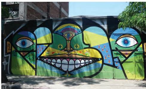
Figura 16. Mural pintado por el duo de grafiteros AYSLAP de Santiago, Chile en el barrio Bellavista.