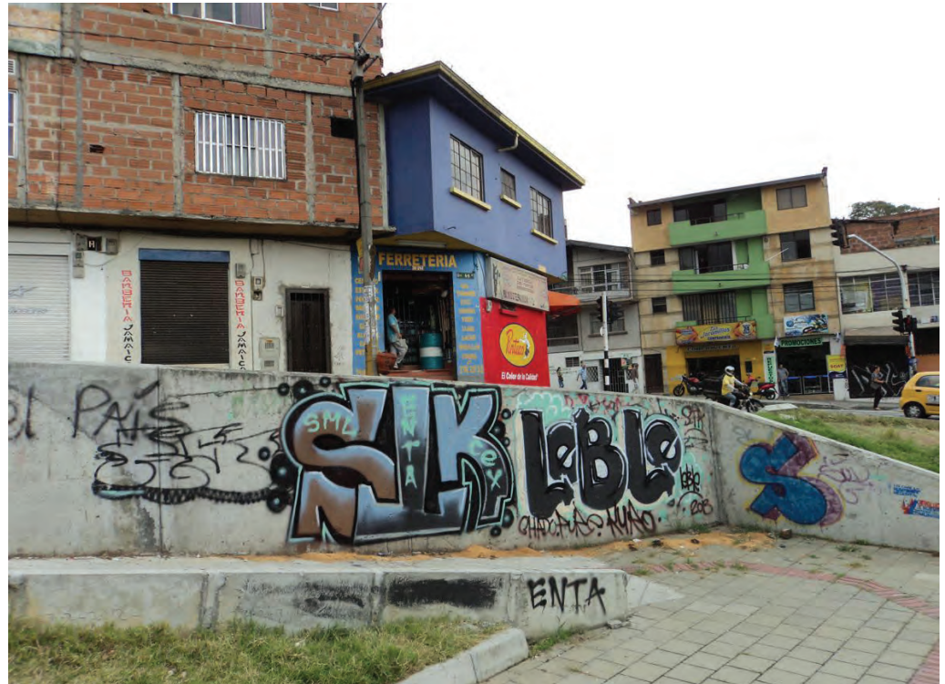
Figura 1. Ayacucho con la Carrera 37. Medellín, 2013.

Partiendo de la evidencia de este tipo de actuaciones, nuestra hipótesis consiste en la consideración de que desde el estudio de las formas gráficas es posible leer prácticas conflictivas que conciernen al uso y apropiación de ese espacio público en particular. Esas situaciones que caracterizamos como conflictividades, pueden ir desde sus autores hacia aquellos con los que comparten actividad hacia los otros con los que no lo hacen, pero con quienes cohabitan ese espacio así sea transitoriamente y con las normativas o programas oficiales que entran a encauzar su quehacer en la ciudad.