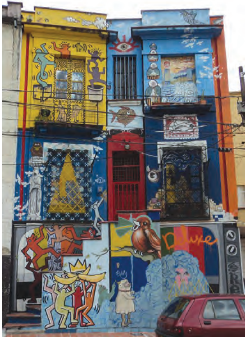
Figura 8. Mural realizado en la sede social de la Asociación Cultural Platohedro, en la Carrera 37 con Ayacucho.

reivindicativas, económicas, estéticas, académicas o políticas, configuradas como huellas de la actuación social. Expresiones gráficas emergen de diversos entramados sociales, como las que están por fuera de la industria publicitaria introduciendo otros procesos comunicacionales como el grafiti, la contrapublicidad o el arte urbano