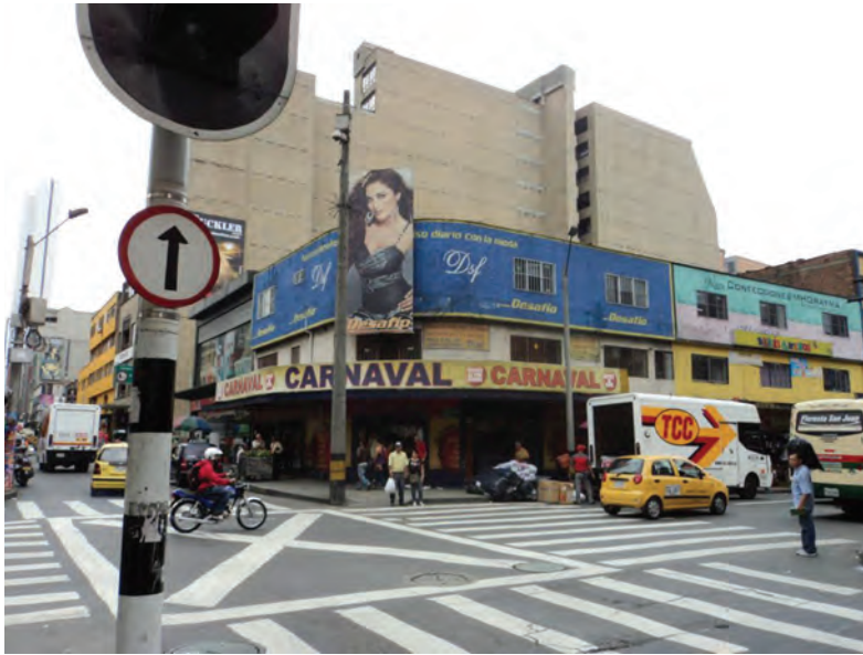
Figura 6. Ayacucho con Carrera 54.

Su desaparición en cuanto dispositivo de comunicación interpersonal se debería también a la saturación que el espacio público experimenta por “la ingente masa de señales indicadoras y códigos cromáticos que orientan los trayectos en un espacio abstracto”, entre ellos el más apremiante de todos, aparte del sistema de la señalización urbana: la publicidad (Pardo, 1992, p. 220).