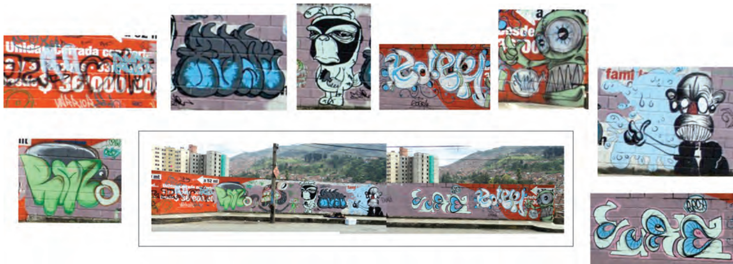
Figura 24. Detalles gráficos de fachada de un solar deshabitado.