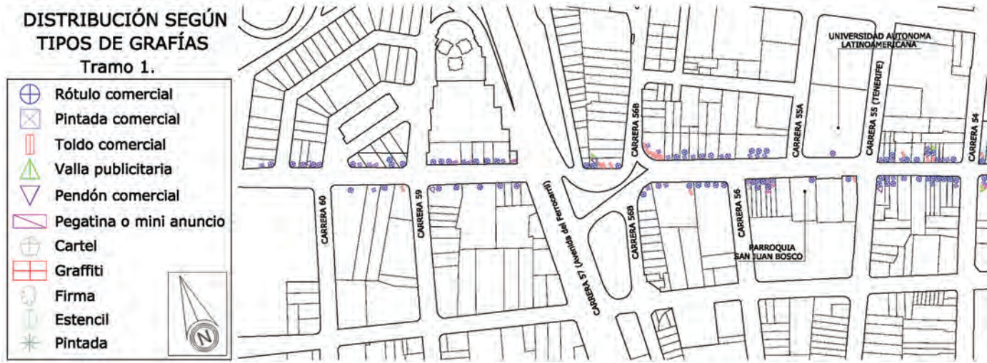
Figura 19a. Plano del tramo 1: Distribución según tipos de grafías.