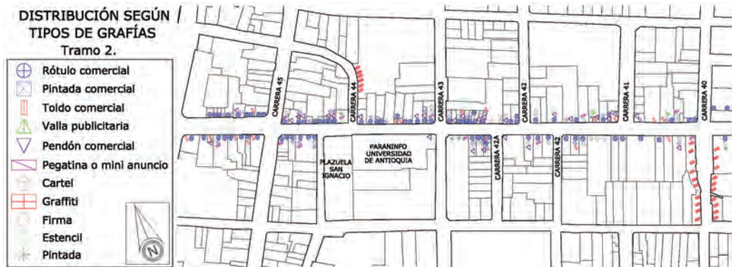
Figura 21a. Plano del tramo 2: Distribución según tipos de grafías.