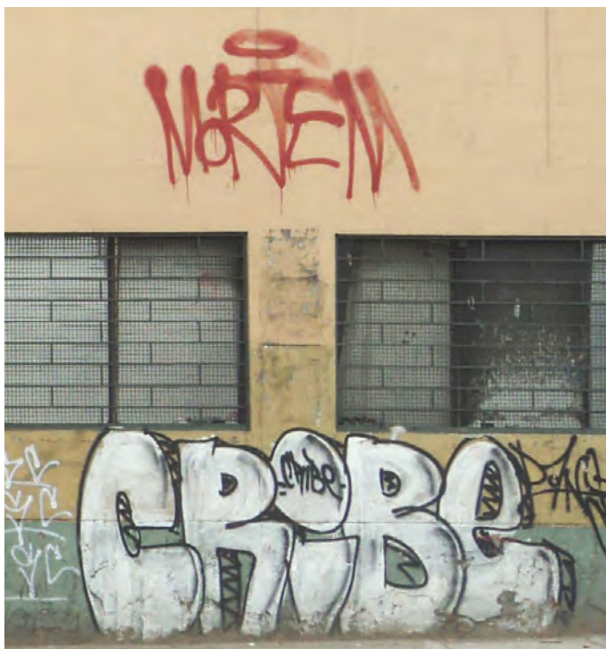
Figura 7. Grafiti en Ayacucho con Carrera 40.

En Villanueva de la Cañada la diferenciación de la piel se produce entre lo que es externo y lo que es interno. Es algo que ocurre en muchos de los proyectos. La piel se diversifica siguiendo una estructura de capas, de manera que cuando desaparece deja ver otra interior y así sucesivamente hasta que se llega al núcleo. Es un acto expresivo similar al acto de ir corriendo las cortinas, ir descubriendo pieles más profundas. En Villanueva una coraza exterior de ladrillo rodea y protege las superficies blancas con las que se envuelve el espacio de los patios. (Rojo de Castro, 1996, pp. 14-15)