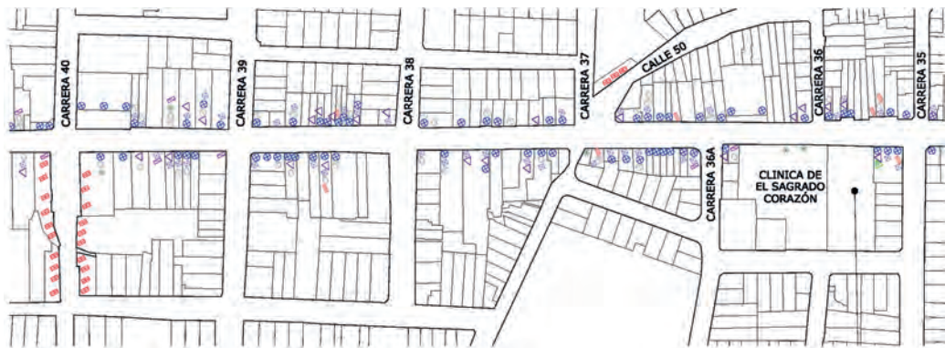
Figura 21b. Plano del tramo 2: Distribución según tipos de grafías.