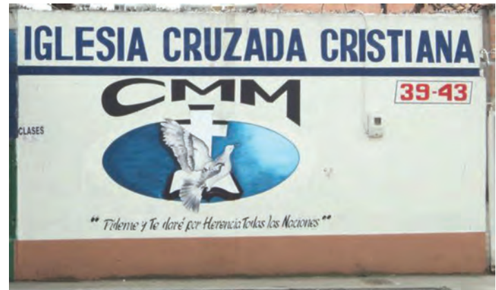
Figura 5. Pintada en Ayacucho con Carrera 39.

Como contrapunto y no menos importante, un espacio público puede ser asimilado también a su incapacidad para posibilitar una comunicación interpersonal en función del automóvil y, con una población en aumento, devenir en escenario de un inexorable anonimato. El espacio público puede entonces potenciar interacciones sociales fundamentadas en torno al anonimato, es decir, en cuanto “relaciones efímeras basadas en la apariencia y la percepción inmediata, interpretaciones de las otras personas que por el espacio público fluyen, fundadas en el simulacro y disimulo” (Delgado Ruiz, 1999, p. 12).