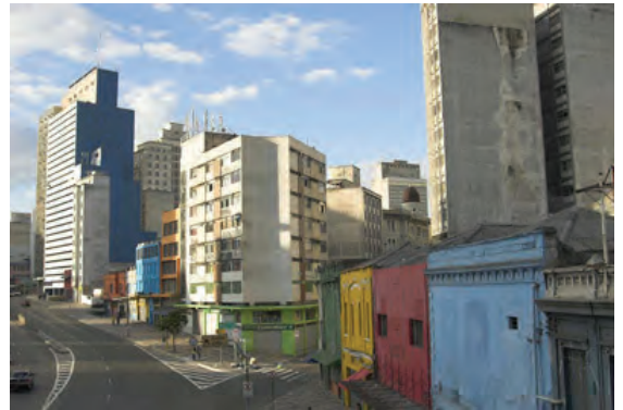
Figura 18. El caso de la ciudad de Sao Paulo.

Este sigue siendo un caso interesante, ya que es una ciudad de casi 12 millones de habitantes, capital del Estado de Sao Paulo y una de las más populosas de Brasil, donde los anunciantes se ingenian nuevas formas publicitarias que no excedan las reglas impuestas; donde aparte de los soportes publicitarios convencionales como vallas y pancartas, se han suprimido las pintadas comerciales. Esta es una medida que comenzó en el centro de la ciudad, pero que paulatinamente se ha extendido a todo su territorio.