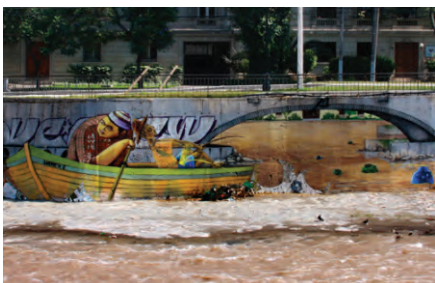
Figura 15. Mural en la orilla del Rio Mapocho.